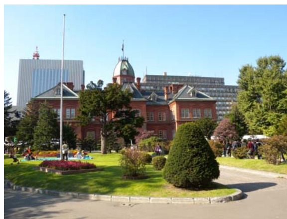
いつ見ても美しい赤レンガ前で開催しました

私たちは、札幌市民の水瓶、定山溪国有林で地域に根ざした取組み、地域のもりから学ぶ「森林づくり」や森林の調査観察、森林生態系（森林の生物多様性）を学ぶ活動を生徒や市民とおこなっています。