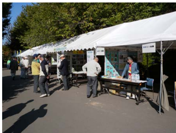
準備中につき人がいません