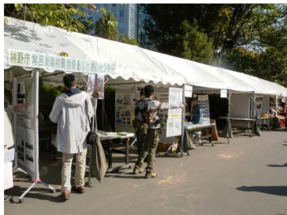
全道の森林環境保全ふれあいセンターと 知床森林センターが集合