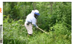
森林づくりを深く考える