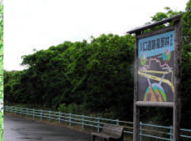
川口遺跡風景林(天塩) レクリエーションの森