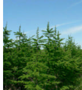
ふれあいの森のグイマツ (天塩)