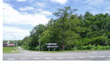
サロベツ湿原の植物群落保護林(幌延) 強風から田畑を守る防風保安林(天塩)