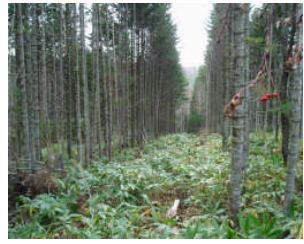
間伐後のトドマツ人工林(遠別) 森林共同施業団地協定調印式