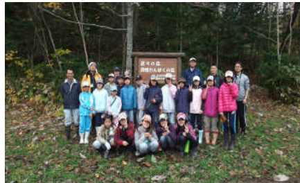
羽幌町教育委員会 遊々の森「羽幌わんぱくの森」(羽幌)