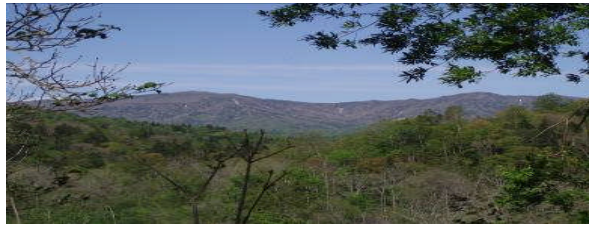
ピッシリ山(羽幌 標高1,032m)