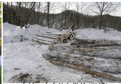
木材の安定的な供給(羽幌) 「森林・林業再生プラン」2020年までに 木材自給率50%以上を目指します