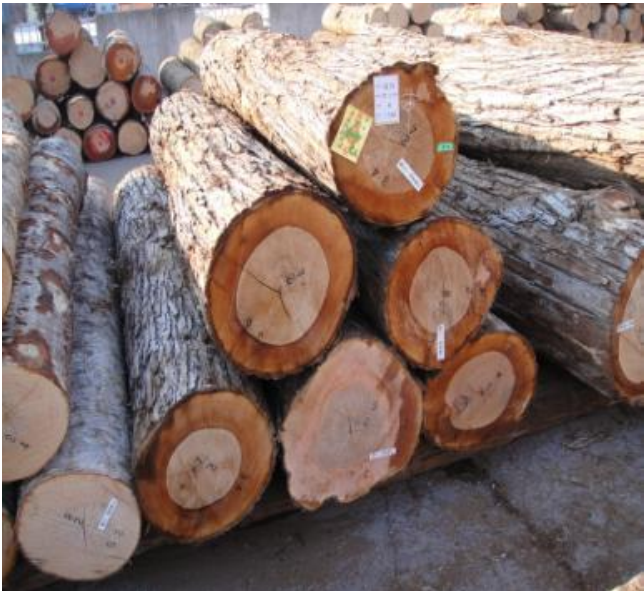
【樫番号 7004番 ヤチダモ】