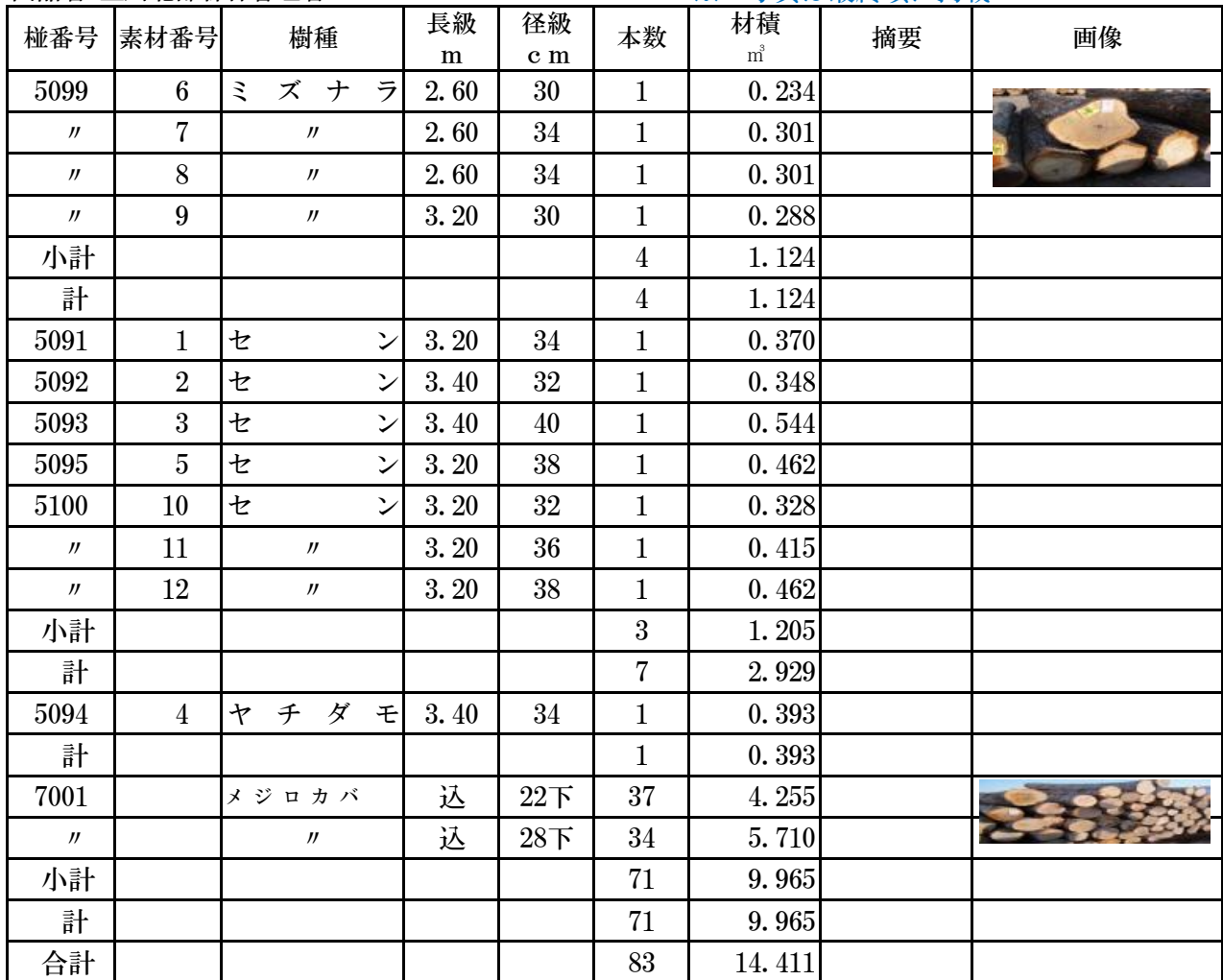
【極番号 5099番 ミズナラ】