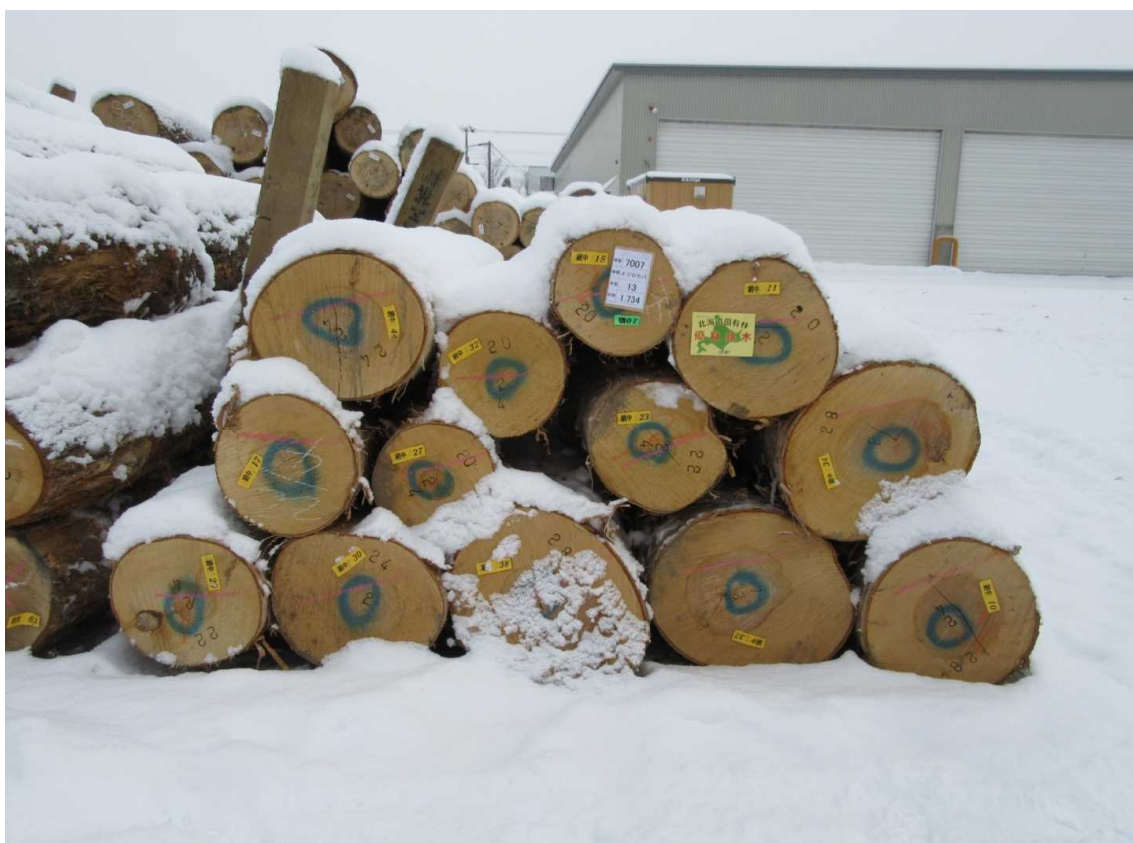
桤番号：7027 メジロカバ