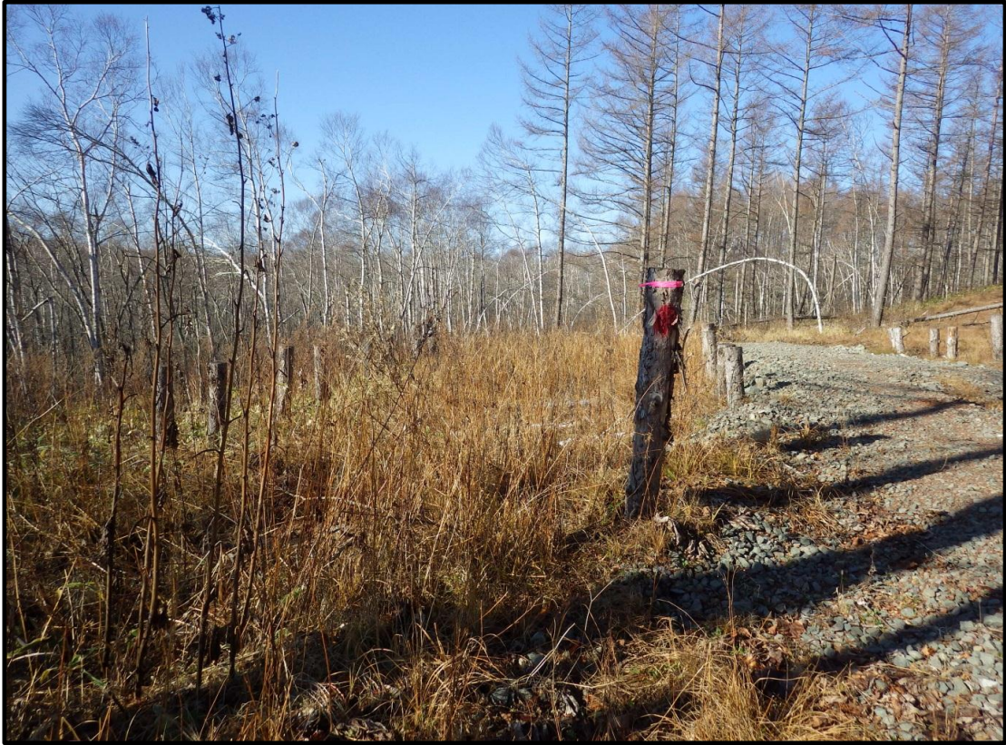
集積番号1-2 対象土場は入口杭にピンクテープ・赤スプレーで表示