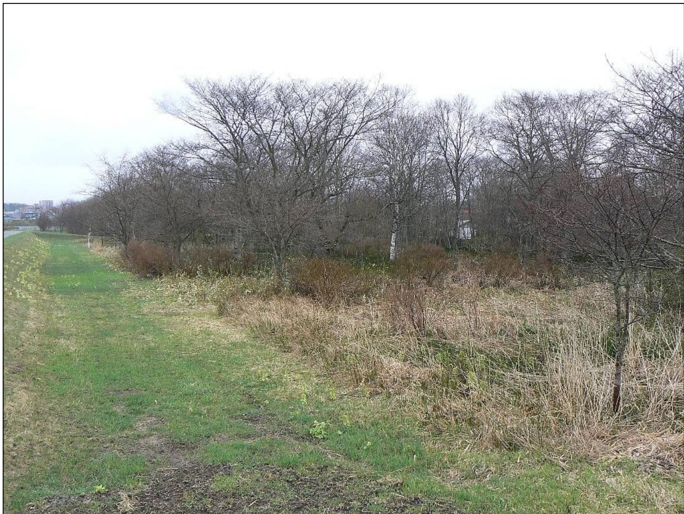
東から売払地の一部を臨む