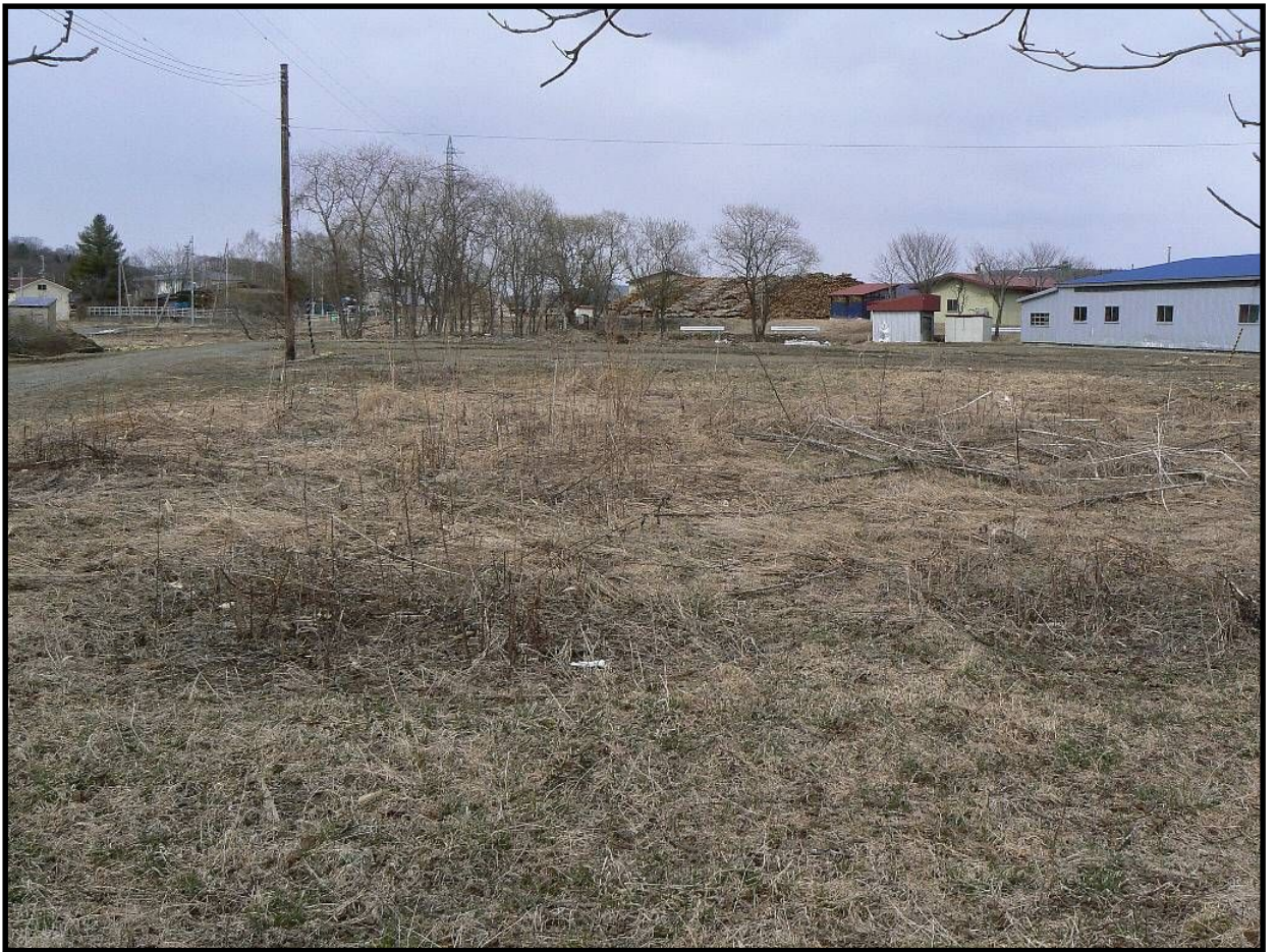
市道北3丁目仲道路から売払地の一部を臨む