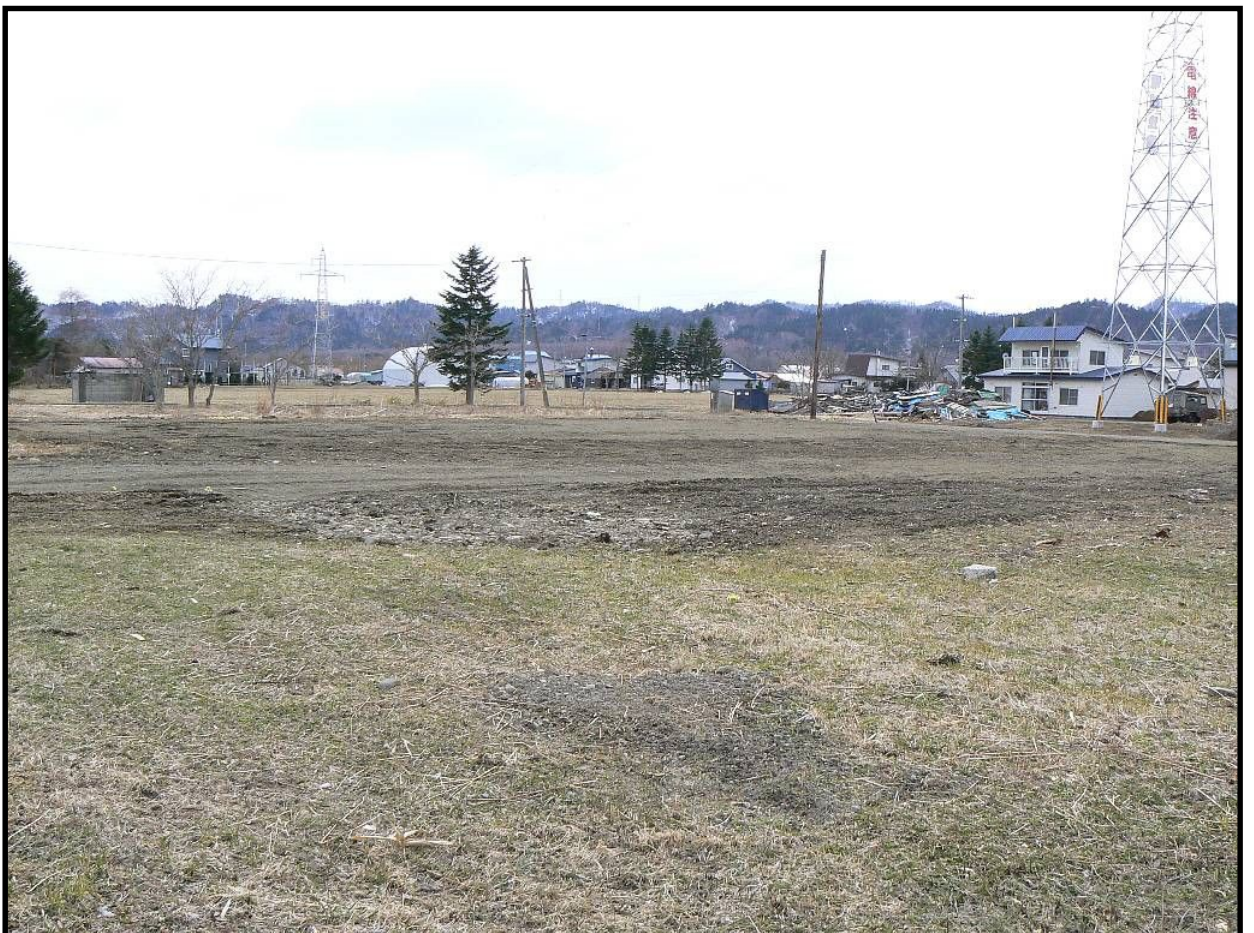
南側から売払地の一部を臨む