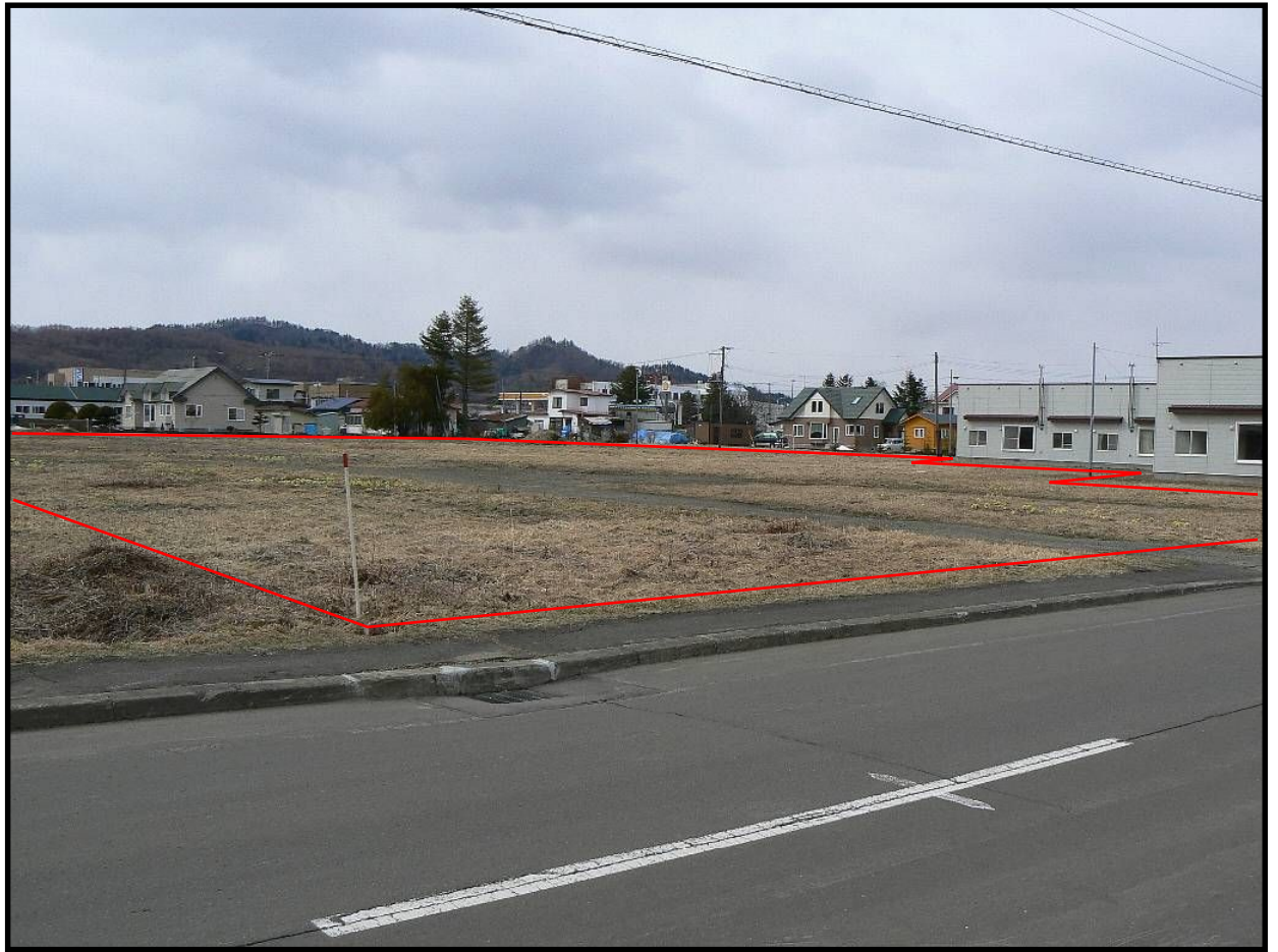
市道東1条道路から売払地の一部を臨む