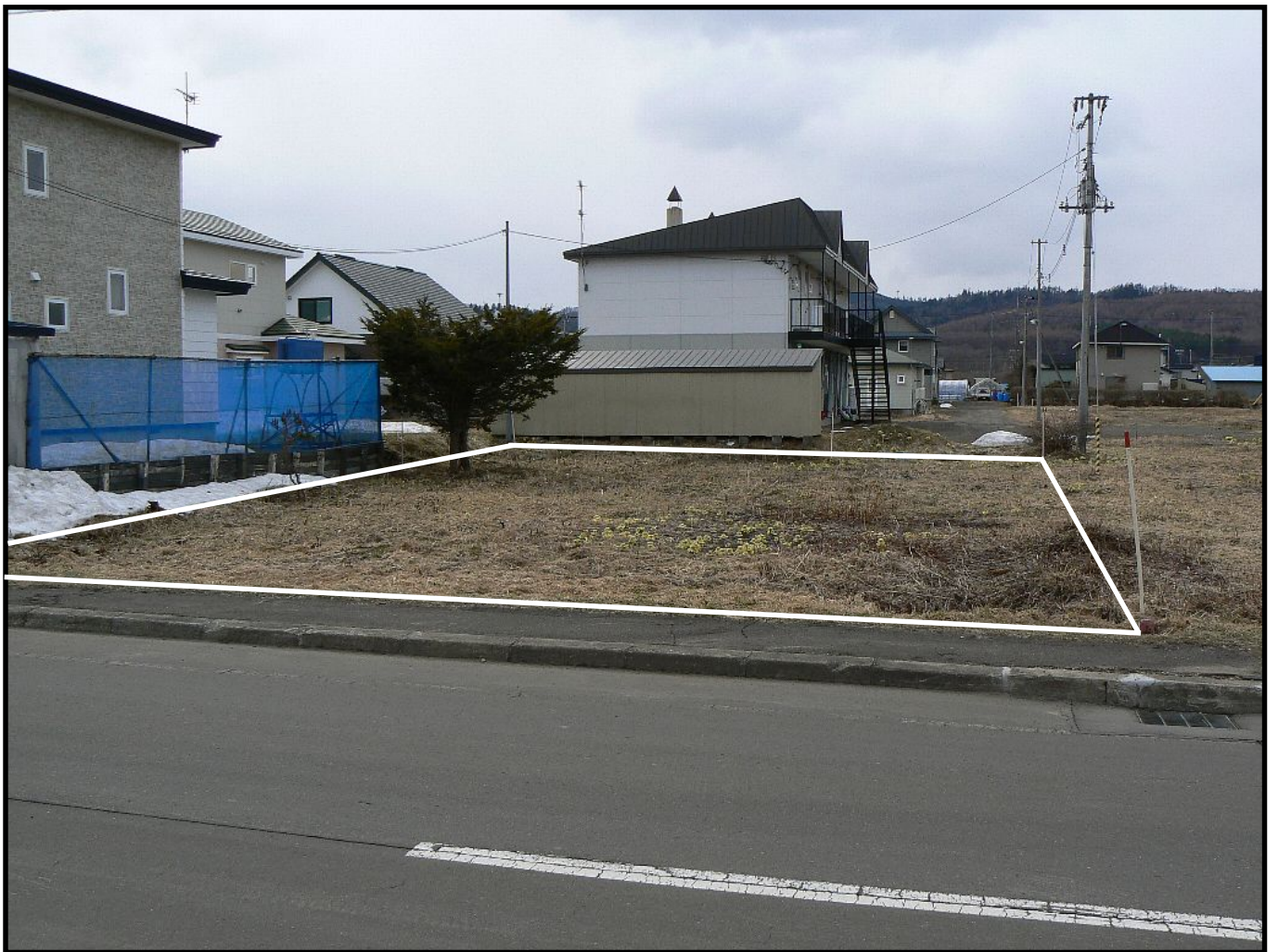
市道東 1 条道路から売払地を臨む