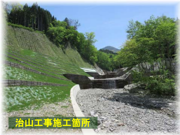
治山工事施工箇所