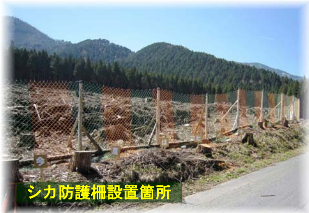
シカ防護柵設置箇所

林野庁中部森林管理局では、国有林の森林計画に地域の情報や意見を反映させるための取組を行っています。