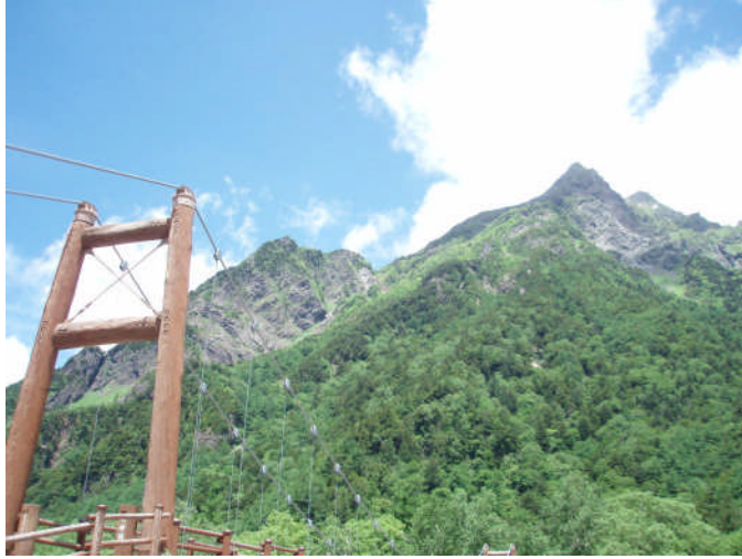
明神橋から見た明神岳

大正池をはじめとする湖と、湿原を有する平準な梓川一帯にあり、北アルプスの山岳景観を背景にした涸沢、横尾、梓川の溪谷美はすばらしく、特別史跡名勝天然記念物に指定されています。