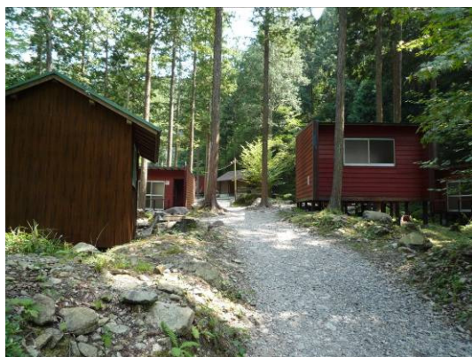
キャンプ場とバンガロー

キャンプ場の中央には緑豊かな山々から流れる清流「川上川」 かわうえがわ があり、マス釣りなどが楽しめる他、夏には涼を求めて多くの人を訪れます。