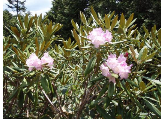
奥三界山山頂付近に咲くシャクナゲ （6月初旬に撮影）