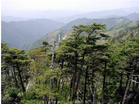
奥三界山山頂からの景色