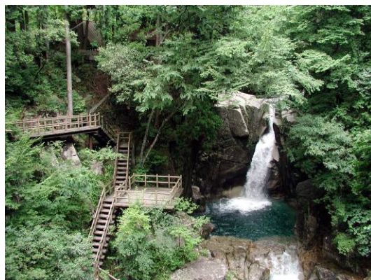
遊歩道と龍神の滝

岐阜県の名水 50 選にも選ばれている「龍神の滝」などの見どころへ繋がる遊歩道も整備され、春には桜、秋には紅葉も美しいことから自然散策や憩いの場としても多くの人に親しまれています。