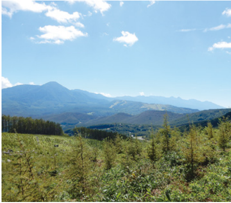
大笹峰方面から蓼科山方面への大展望 (中央ピークは蓼科山)