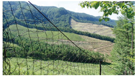
皆伐跡地保育（下刈）箇所、ニホンジカ防護柵を実行

定された箇所を含む、標高九五五㍉〜一、九九〇㍉、八、二、三、九㍉の国有林野を管轄します。管内国有林の約六割が人工林で、大部分がカラマツ林となっています。国産材への期待が高まるなか、平成三十年度計画では約一万七千立方㍉の木材を生産する予定になっています。そのなかで国有林野事業の円滑な事業実施の課題である、生産性向上に向けた目標達成に林業事業体と連携して取り組んでいます。