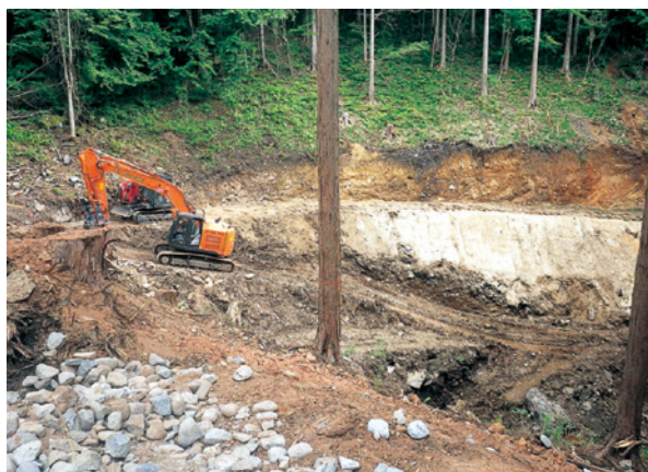
林業専用道開設の様子

本工事は、下呂市小坂町 落合 国有林三七・三八林班内において林業専用道五〇〇メートルを新設する工事です。