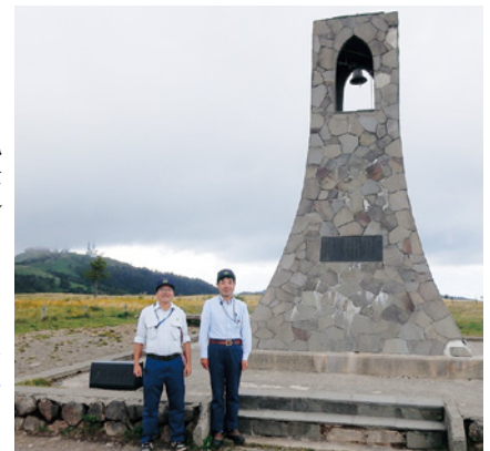
美ヶ原高原美しの塔 (左側地域技術官、右側筆者)

また、美ヶ原高原は標高約二、〇〇〇㍉の雄大な草原として人気があります。他にもハイカーに人気の中山道と宿場などもあり、長和町では「エコハイイク『歩く博物館』インながわ」としてモデル