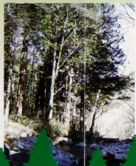
⑥ 大萱谷から見た天保林