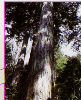
② ヒノキ (森の巨人たち百選 選出木)