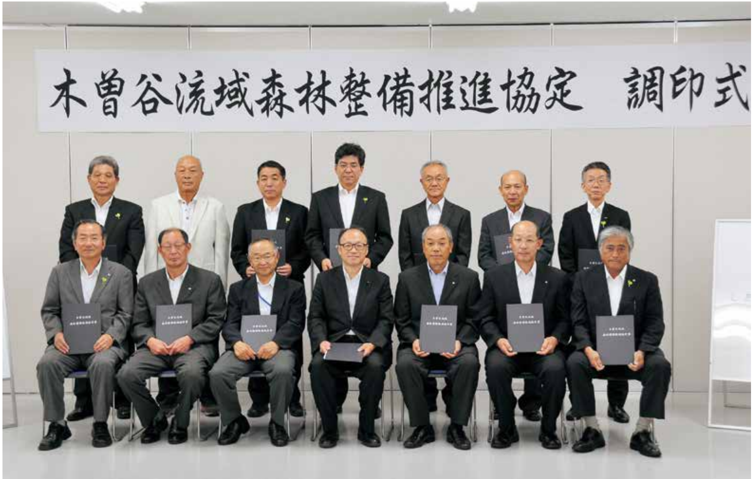
調印を終えた協定団体の代表者