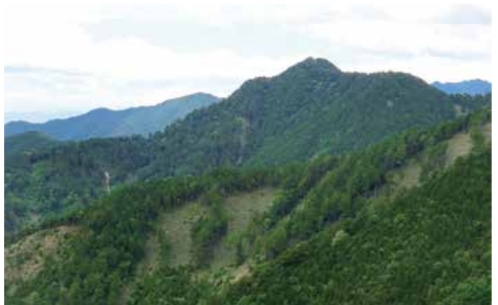
付知裏木曾国有林から夕森山を望む

「夕森山」の標高は一、五九七mで山頂からは、霊峰「御嶽山」をはじめ「恵那山」、「小秀山」など周辺の山々を望むことができます。