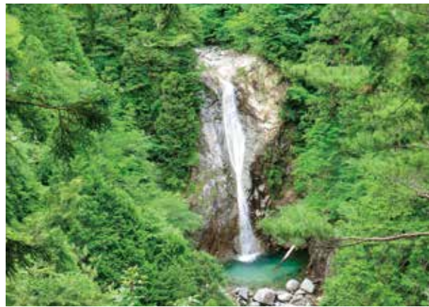
展望台から見た百間滝

不動滝の上流は、更に断崖絶壁の急峻な地形を呈しており、国有林入口から東股本谷を六キロメートル遡った所に「百間滝」があり、林道際の展望台から望むことができます。