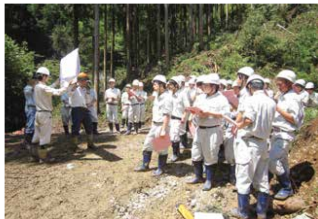
間伐事業現場の様子

森林組合とその土場です。組合長から森林組合の仕事や木を使うことの重要性などについてスライドを使って話があった後、スギやヒノキの丸太が並ぶ土場で森林組合の職員から、丸太の売り、高い値がつく丸太の見方などについて学習しました。ここでも丸太一本の値段等についてのクイズがあり、自分の答えと大きく違う説明があると皆びっくりした様子で聞いていました。