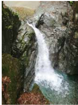
伝説が残る不動滝

付知峡の中でも多くの人々が訪れる名所「不動滝」は、断崖上の展望台から見下ろすことができ、エメラルドグリーンの綺麗な水が目を引きまます。