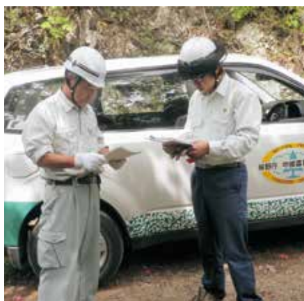
現場で打合わせする森林官

これからも、上司、先輩からのアドバイス等を大切に、多くの知識、経験をj得て、自然豊かな南北相木村の国有林として、地元には喜ばれる、よりよい山づくりを目指し、日々業務に励みたいと思います。