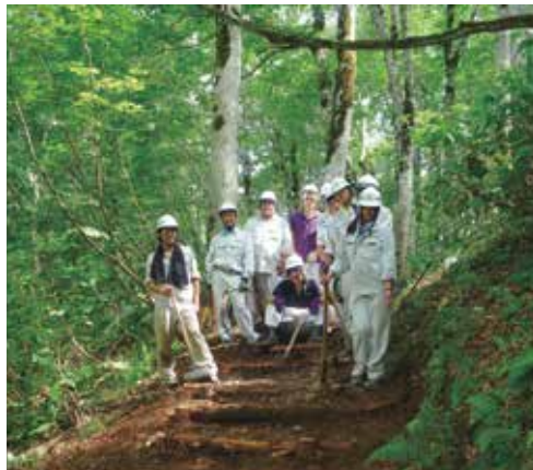
歩道整備に取り組んだ生徒たち

この活動は、歩道整備を行いながら地元のカヤの平高原の豊かな自然環境について学ぶことを目的として実施しました。作業は丸太を使った階段作りで、北信州森林組合より提供された、同村に隣接する中野市の山林で間伐したスギの小径木を利用しました。