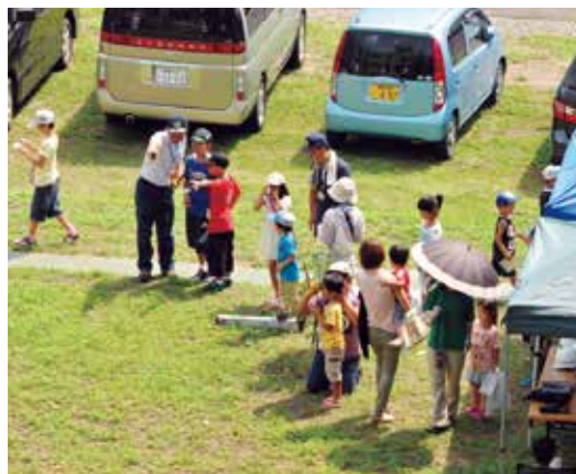
局中庭でのイベントの様子

探知機で探せ」、「木の高さを測定せよ」、「十メートルの距離を当てろ」、「機関車に乗って写真を撮るのダ」、「自分の名刺作るのダ」、「局長にあいさつに行くのダ」、「木工クラフトで作品を作れ」、「丸太切りを体験せよ」、「マイ箸を作るのダ」、「航空写真の立体視を成功させよ」の十種類のミッションを通して森林・林業に興味を持っていただくための体験をしていただきました。