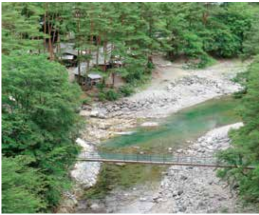
青色の清流をたたえる付知川とキャンプ場

岐阜県中津川市付知町の中央を流れる付知川の上流部は「付知（つけち）峡」と呼ばれ左に西股谷、右に東股谷と分かれます。この付知峡は、「森林浴の森日本一〇〇選」「岐阜県の名水五〇選」「飛騨・美濃紅葉三十三選」に選ばれたところ。今回は東股谷を紹介します。