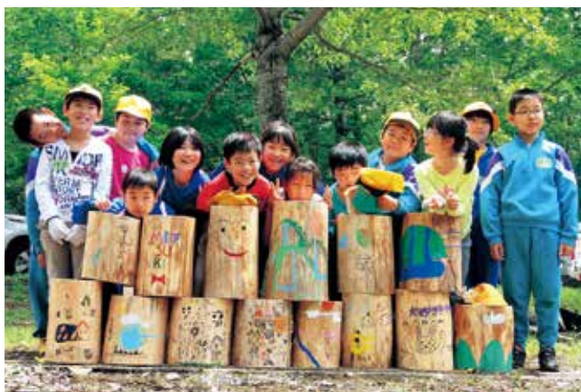
完成した丸太イスと児童

児童たちは、自分で設置した丸太いすにさっそく座り、「このいすに座ってお弁当を食べてもらいたい」、「家族にこの森へ来ていすに座ってもらいたい」と大はしゃぎしていました。