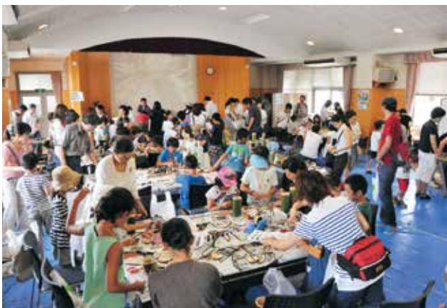
局大会議室でのイベントの様子

探知機で探せ」、「木の高さを測定せよ」、「十メートルの距離を当てろ」、「機関車に乗って写真を撮るのダ」、「自分の名刺作るのダ」、「局長にあいさつに行くのダ」、「木工クラフトで作品を作れ」、「丸太切りを体験せよ」、「マイ箸を作るのダ」、「航空写真の立体視を成功させよ」の十種類のミッションを通して森林・林業に興味を持っていただくための体験をしていただきました。