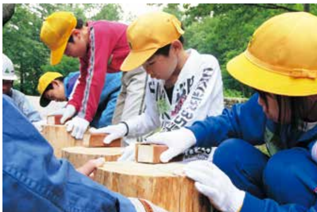
丸太イスを作製する児童

思い絵を描いて遊歩道に設置しました。丸太のヤスリがけでは、一抱えもある大きな丸太と不成形の切り口に児童たちは悪戦苦闘していましたが、白山白川自然休養林のオフィシャルサポーター協定を結んでいる名古屋林業土木協会荘川支部会員のおじさんたちに丸太を支えてもらったり、ヤスリがけのコツを教わり、丸太の仕上げり具合を確かめながら小さな手を一生懸命に動かしていました。