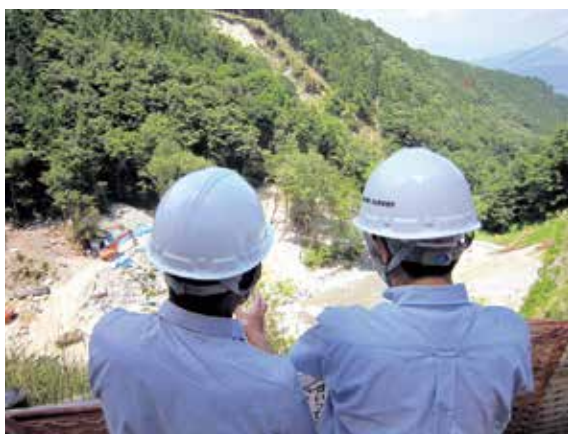
コハ清水の視察の様子

当日は、市議等十八名の参加があり、市役所を朝九時に出発し、まずは湯舟沢国有林内の姥ナギ沢復旧治山工事現場へ向かいました。途中、マイクロバスの中で、署長から東濃森林管理署の業務の概要について説明を行いました。姥ナギ沢の現場では、総括治山技術官と監督職員である治山技術官から工事の概要について説明を行いました。非常に急峻な現場でのロッククライミングマシーンを使った作業等について説明を受けた市議からは、「現場を遠望するだけでも足がすくむ思いだ。」「大変な苦勞をして治山工事が行われていることがよくわかった。」等の感想が聞かれました。