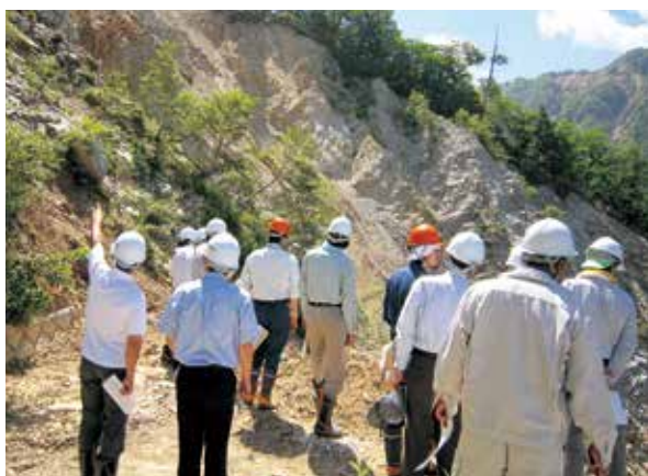
姥ナギ沢の視察の様子

地域の関係者に国有林野事業の業務をより理解していただくことを目的に、森林管理署から市議会事務局に要請をして実現したものです。