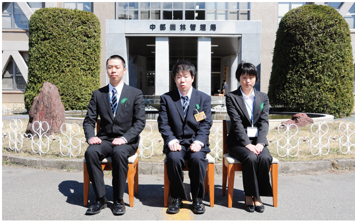
国有林マンとなった3人の活躍を期待します