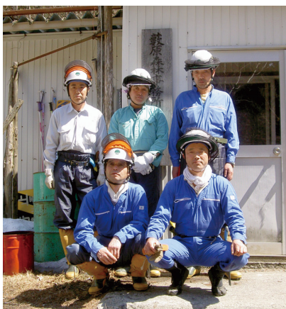
藪原造林班の皆さん