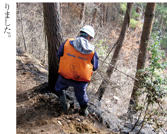
ジェットシューターによる消火活動

〔南信署〕三月に入り各地域で山火事が多発している中、三月三十日十五時三十七分頃、当署豊丘森林事務所管内の民有林において山火事が発生したとの通報を受けました。場所は国有林に隣接する民有林で、この時点ではヘリコプターによる消火活動を実施中であり、当署としては豊丘村から応援要請があった場合に備えジェットシューターの搬送準備、ヘッドライト、トランシーバー、クワ等の準備、出動員の人选、新たな情報の収集と職員が手分けして準備をしていました。