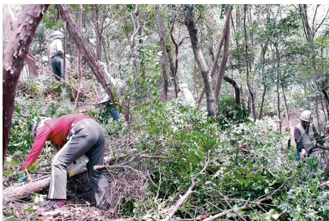
除伐作業に汗を流す隊員の皆さん

で、新緑も鮮やかな中、隊員三十四名は、時折舞う山桜の花びらの中、気持ちの良い汗を流しました。