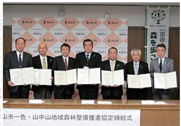
山市一色・山中山地域森林整備推進協定締結式