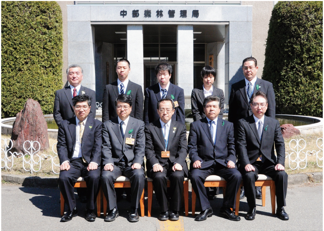
局幹部と新規採用者