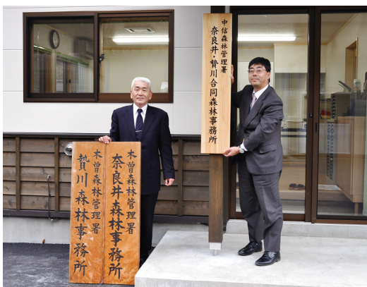
新たな看板を掲げる中信署長とこれまでの看板を持つ木曽署長

両森林事務所については、平成二十三年四月一日から森林管理署の管轄区域の変更により、木曽森林管理署から中信森林管理署の管轄となることから、去る三