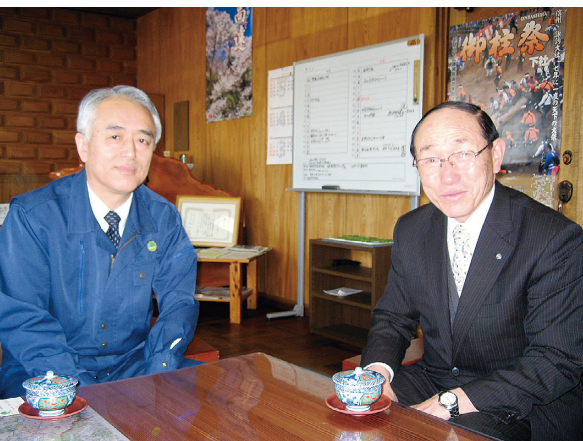
お礼に来署された豊丘村村長

十九時四十分、豊丘村から本日の消火活動の終了、翌早朝から再開する旨の報告を受け、その際、当署への応援要請があったことから、当署からは五名の職員が翌朝五時に署を出発し消火活動に当た