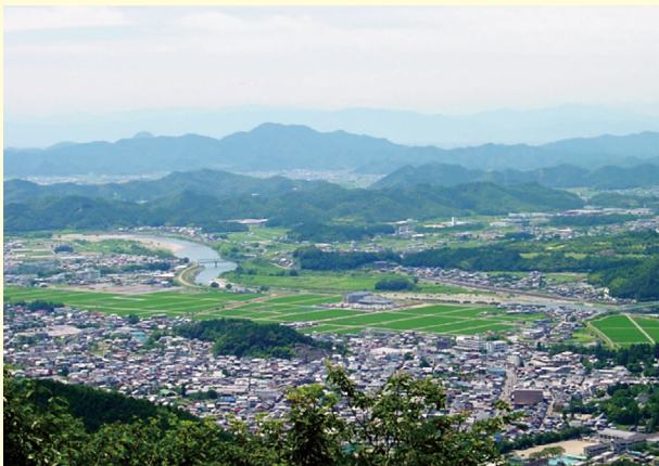
山頂から市街地を望む