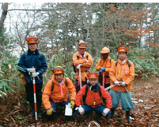
収穫調査へ向かう上矢作班の皆さん

今後もこれらのことを継続し、より一層活気溢れる職場づくりを職員一丸と成って目指し、無災害を続けていく決意です。