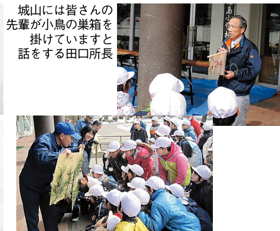
の箱をと長 さんですす 皆のますす は鳥の田口 山小の田 城先輩が掛 先掛ける話

当日は木曾署のふれあい係長の応援を得て、木曾五木の見分け方の説明の後、ヒノキ間伐木を輪切りにして絵や名前を書いて首に下げるときの作業を計画していましたが、時間の関係で丸太切りまでとなりました。