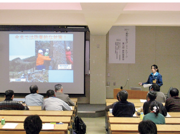
発表する森林ふれあい係長

また、「森林に学ぶネットワーク」は、県内の森林・林業関係のNPO法人等が構成する「森林に学ぶ」ネットワーク運営委員会が主催し、今回で十二回目の開催となり、一般の者を含め約七十名が参加し、大学生の外三団体の取組内容が発表され、当署からは森林ふれあい係長が「地域との連携による事業展開」と題して、南アルプス食害対策協議会と連携したニホンジカ被害対策の取組を発表しました。 ニホンジカ対策に関しては、現地の被害をよく知る参加者から様々な情報を得る中で、意見交換等を行い、科学的な調査が更に必要であるとの認識が再確認されました。森林・林業再生プランを踏まえ、民国が一体となった施策の推進が求められている中、このような機会を通じて林業関係者の資質の向上と交流が図られたことは大変有意義なものであり、当署としても地域林業を担う一翼として重