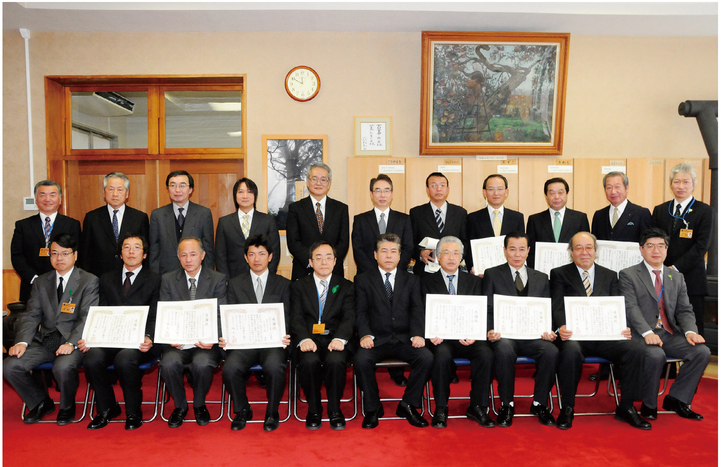
社会貢献活動に顕著な功績のあった企業・団体の皆様