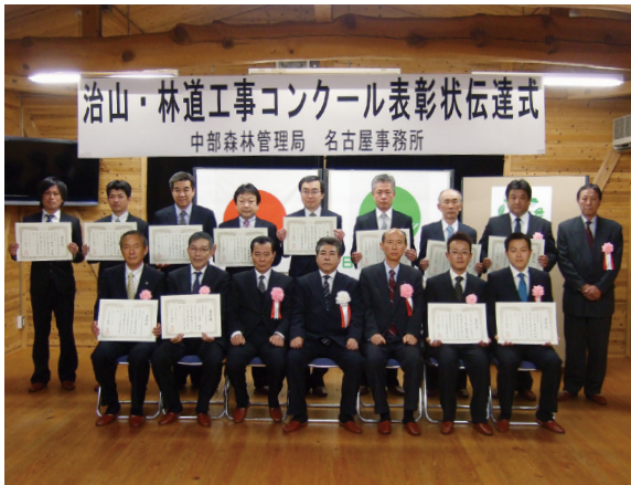
表彰状伝達式 (2月28日:名古屋事務所)