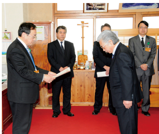
城土局長より感謝状を贈呈

◆森林づくり 長野林業土木協会東北信支部東信分会 （社）名古屋林業土木協会古川支部