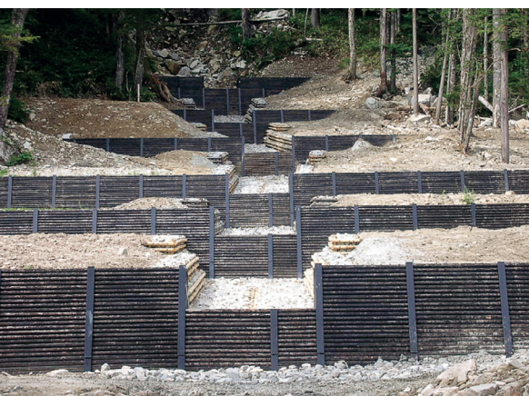
中信署の事例（善六沢復旧治山工事）

長野県産材振興対策協議会土木用材 利用推進部会では、コンテストに応募し た二十七件の施工事例と県内で製造され る木質土木用製品の施工事例等を掲載し た冊子（木製構造物等施工の手引き集） を作成し、長野県内で公共土木工事を 行う機関に配布して土木用材の利用拡大を 要請することとしています。