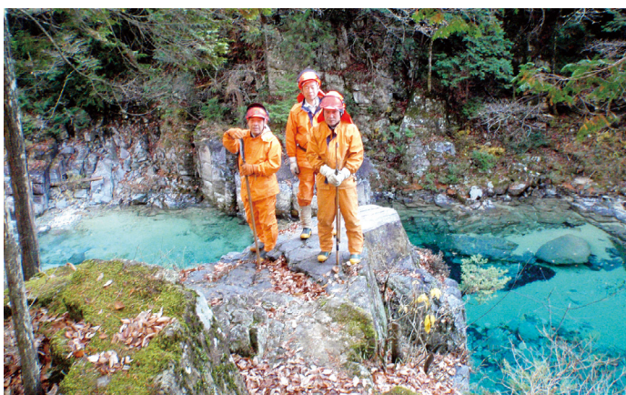
阿寺ブルーをバックに

これからも、少人数ではありますがチームワークと互いの思いやりを大切に、阿寺の国有林を守り・育て・親しんでいただく森林づくりに取り組んでいます。