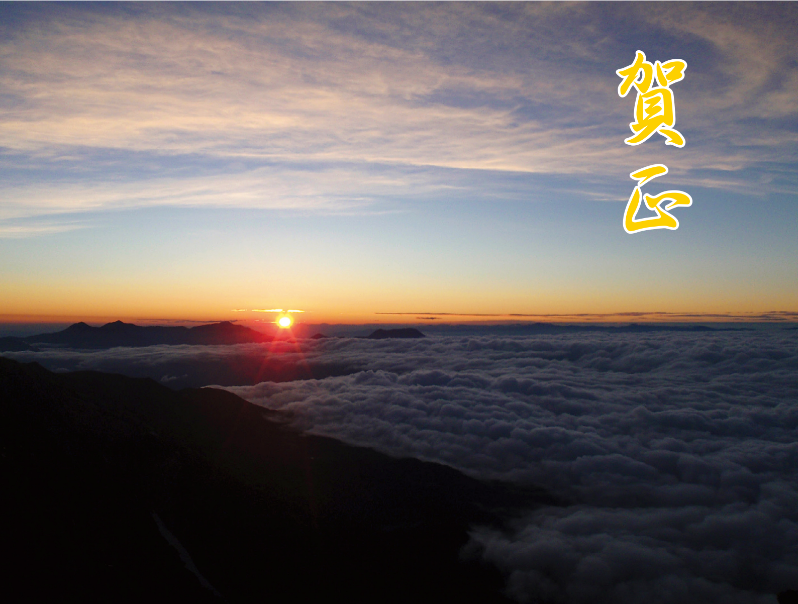
白馬岳から望む日の出