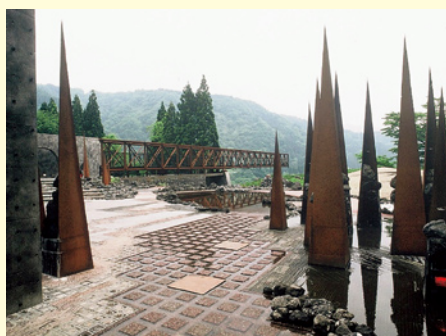
まんだら遊苑 (餓鬼の針山から見た精霊橋)