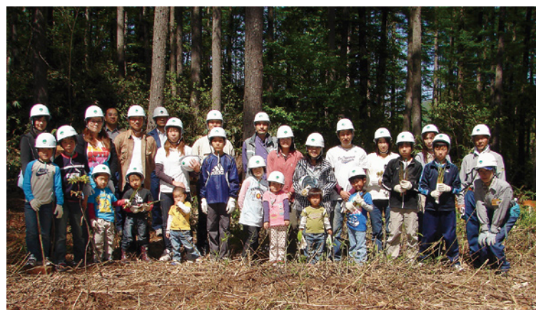
戸隠国有林にて植付作業を体験した親子の皆さん

今回使用したミニチュアハウスは、一般住宅と同じ方法で設計され、プレカット加工した本格的なもので、大人と子供達が各工程を分担しながら、家を建てるための作業を体験し、立派なミニチュア