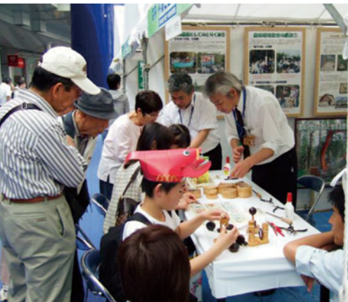
中部森林管理局のブース