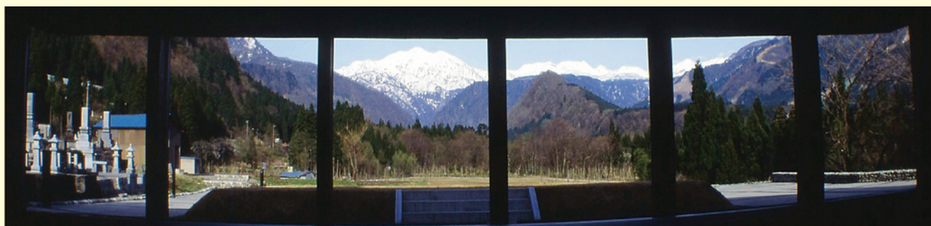
遙望館ホールから望む立山連峰

立山博物館(まんだら遊苑、遙望館)から少し足を延ばせば、「称名滝」日本一の落差を誇る名瀑布(ブナ坂国有林) また、富山地方鉄道「立山駅」からは美女平、室堂方面(ブナ坂国有林)へ行けます。