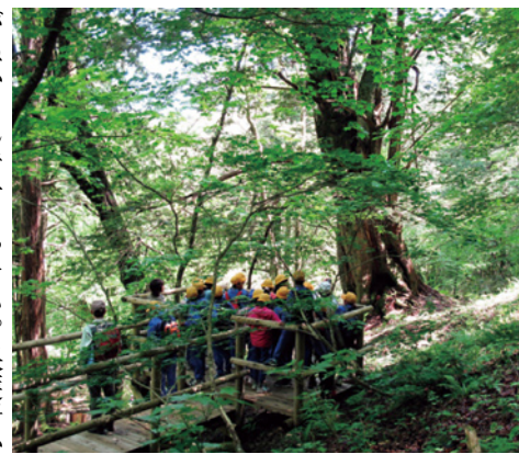
完成した展望デッキから大イチイを見学

【飛騨署】当署管内の大イチイは、富山湾へ流れる宮・庄川の最源流部に位置する天然ヒノキの遺伝資源保存林内にあり、これまでも地元の小中学校の森林教室等に活用してきましたが、歩道や階段