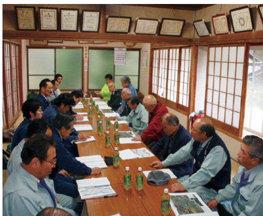
林道整備の必要性等について意見交換

岩地帯となっており、裸地化した箇所においては降雨の度に土砂が流出する脆弱な地質となっています。また、この林道沿線は樹齢百年前後の人工林ヒノキを有し、間伐を実施しつつ広葉樹の生育も促進しながら複層林化を図り、より災害に強い林分に誘導する必要があります。 このため工事や森林整備に際し、下流域の地元住民の理解を得ながら進めることとし、法面緑化・アスファルト舗装等による土砂の流出を抑えた工法や間伐について、現地視察などを実施してきました。 当日は雨降りの中でしたが、参加者全員でシラカバの記念植樹を行い、終了後は地元公民館で工事内容や森林整備、今年度以降の間伐と林道整備の必要性、さらには隣接民有林との連携等について意見交換を行いました。