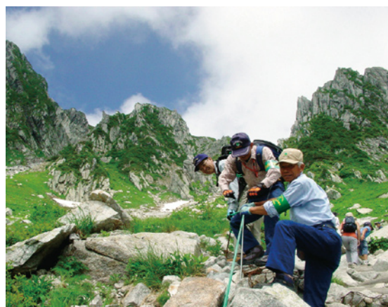
高山植物の保護活動(グリーンロープの点検補修)