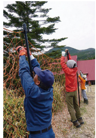
鹿よけのネットを設置する参加者