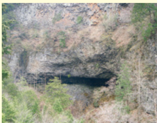
根尾の滝への途中の「あまどり岩」