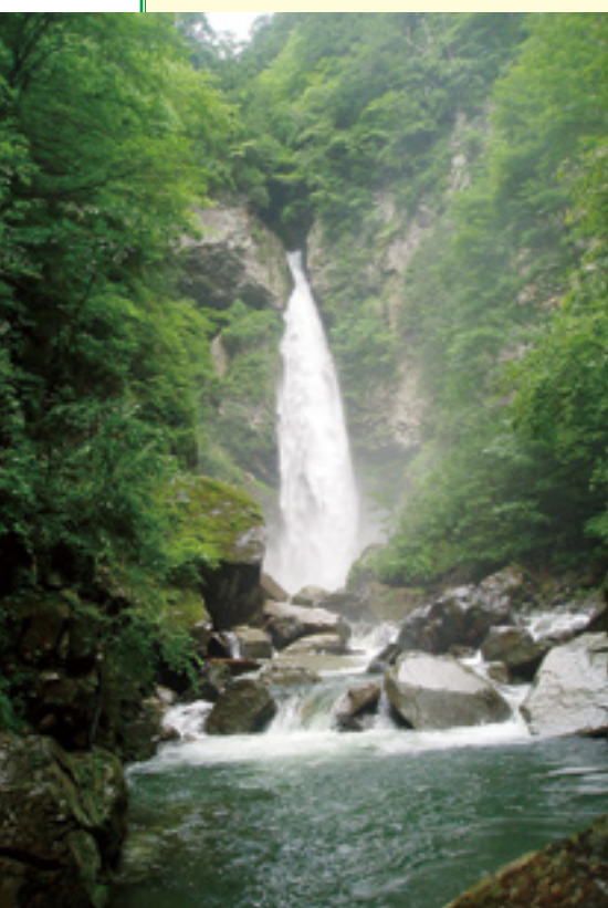
日本の滝100選「根尾の滝」