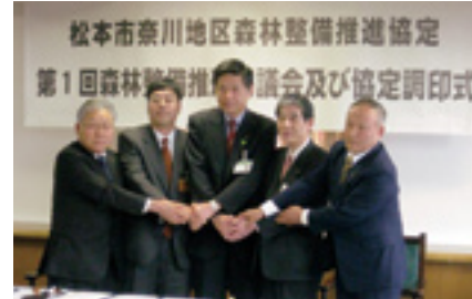
森林整備推進協定調印式

松本市奈川地区は、森林率九十五%、国有林率四十五%と中部山岳森林計画区内では高く、上部に国有林、下部に民有林が占めていることから、連携した路網整備・施業連携等を行うことで、流域単位での統一的な森林整備及び素