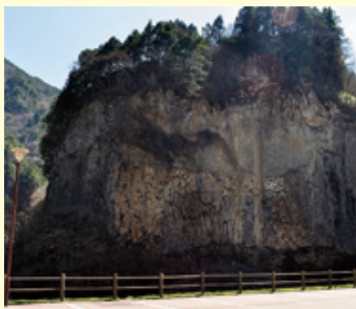
御嶽山の大噴火によって出来た壮大な巖立岩