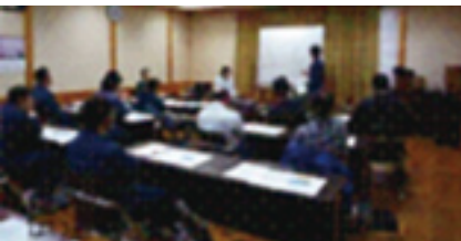
伝達を受ける職員