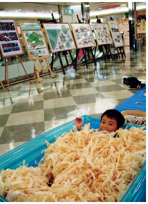
カンナ屑プールで楽しむ子供

昨年引き続き二回目となる本展示は、十月十六日(土)から十月三十一日(日)までの間、長野駅前ビルの「MIDORI」五階特設会場において、森林の働きや役割、地域材利用や国有林の取組についてパンフレットやパネル、木工品などを展示しPRしました。また、三十日(土)と三十一日(日)には、カンナ屑プール・ウッドイフ笑いやマイ箸作りなどを通じて木に直接触れて、木の香やぬくもりを体感してもらい、森林の大切さ・地域材の利用などについて普及啓発活動を行いました。