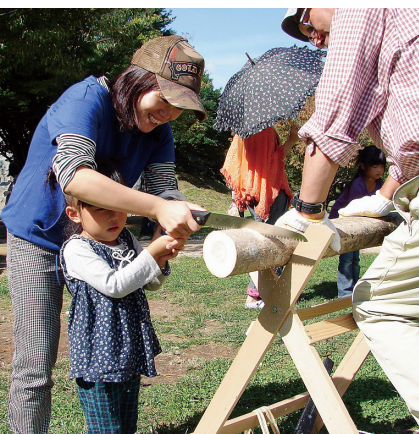
親子で丸太切り体験