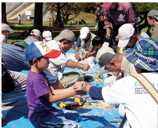
竹とんぼづくりに夢中

一方、体験している子ども達も満面の笑みを浮かべ、笑い声が飛び交い、親子・家族の皆さんも、揃って終始和やかに、そして真剣に取り組んでいる姿が見受け