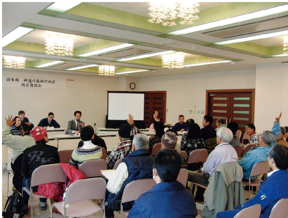
懇談会の様子（神通川森林計画区）