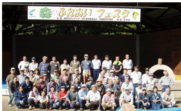
参加者（団体）の皆さん