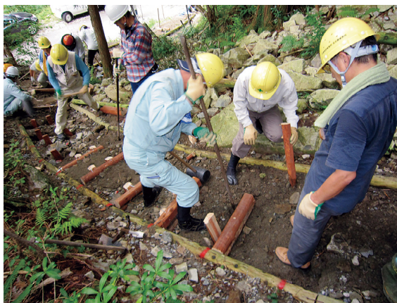
整備を行う隊員の皆さん

スタッフが参加、当署からも署長以下七名が参加し、総勢三十四名の賑やかな事業となりました。