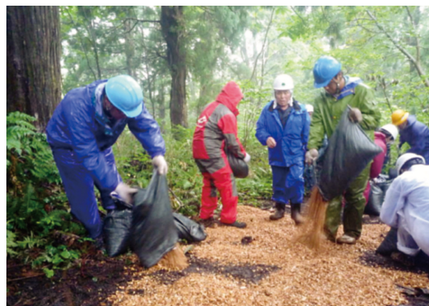
チップ敷設作業 (美女平風致探勝林内遊歩道)

敷設を行いました。立山黒部アルペンルートの美女平駅すぐ近くから整備されている遊歩道は、立山杉の巨木やブナ林などを巡ることができ、旅行雑誌の富山紹介においてはたびたび掲載されるスポットとなっております。 近年、この遊歩道が表流水等により洗掘され、立山杉の根が傷んだり、泥がたまつてぬかるみとなり入林者が歩道の脇を踏み歩く箇所が多く見られるようになりました。このため、富山署では、「地域発案」としてこの問題に取り組むこととし、環境に極力負荷を与えない効果的な手法を検討した結果、保育間伐等による地元林内のスギ材を原料としてチップを製作し、この地元産一〇〇%のチップを傷んだ遊歩道箇所に敷設すること、このための作業を地域やボランティア等の協力を得ることにより地域の意識として実施することを発案しました。 昨年度は、保護管理協議会と協働で