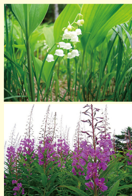
上：スズラン 下：ヤナギラン

冬の季節、夏の花の美しさから神秘的な雪山へと姿を変えます。現在、密かなブームとなっている「スノートレッキング」。今までクロスカントリーでしか行けなかった場所へスノーシューで行けるようになったことから、冬の山へ出かける人が多くなってきました。入笠山は、ゴンドラを利用すれば往復三時間ほどで雪山を楽しむことができます。山頂からの景色も冷たく澄んだ空気の中、山々の白い稜線が神秘的な輝きを見せます。