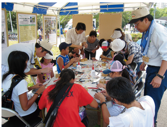
ストラップ（モックン）づくりは大人気

「名古屋事務所」九月十二日の日曜日、 名古屋市熱田区の区民まつりが開催され ました。名古屋事務所からは地元のまつ りということであり、今年で三度目の参 加となり、パネル展示と木の枝を使った ストラップ（モックン）づくりを行いま した。