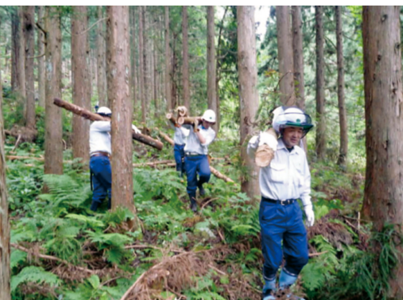
間伐材の運び出し作業 (官行造林地)

敷設を行いました。立山黒部アルペンルートの美女平駅すぐ近くから整備されている遊歩道は、立山杉の巨木やブナ林などを巡ることができ、旅行雑誌の富山紹介においてはたびたび掲載されるスポットとなっております。 近年、この遊歩道が表流水等により洗掘され、立山杉の根が傷んだり、泥がたまつてぬかるみとなり入林者が歩道の脇を踏み歩く箇所が多く見られるようになりました。このため、富山署では、「地域発案」としてこの問題に取り組むこととし、環境に極力負荷を与えない効果的な手法を検討した結果、保育間伐等による地元林内のスギ材を原料としてチップを製作し、この地元産一〇〇%のチップを傷んだ遊歩道箇所に敷設すること、このための作業を地域やボランティア等の協力を得ることにより地域の意識として実施することを発案しました。 昨年度は、保護管理協議会と協働で