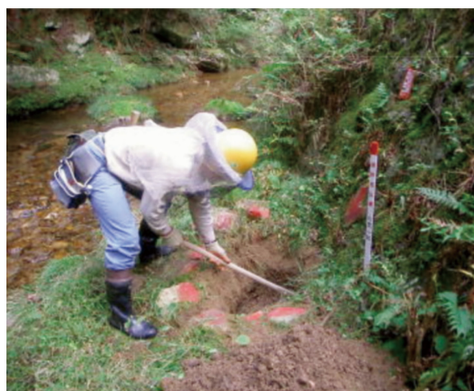
境界管理業務を行う職員

今後も、歴史ある国有林に責任と誇り を持って勤しみ、健康で活力ある職場を 維持していきたいと考えています。