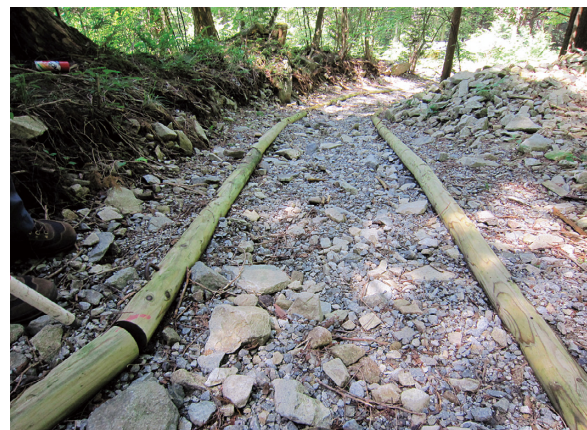
整備前の洗掘された歩道