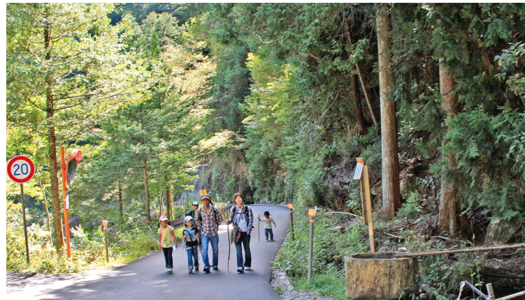
ウォーキングを楽しむ参加者

この阿寺溪谷沿線は地元の要望をふまえて、支署と大桑村や地元ボランティアと協働して景観の整備をしたところです。