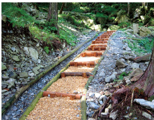
完成した歩道（大雨が降った後でも 洗掘されていませんでした）

先、空には徐々に暗雲が広がり、昼からは雨の中の作業となりましたが、全員 の協力により四〇分ほどの立派な遊歩道 が完成しました。