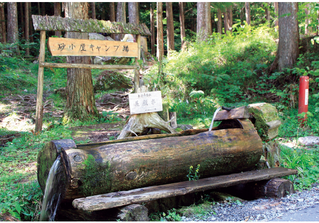
美顔水（美しく色白になるとのいわれも）

美顔水のいわれは「その昔、木曽の山林を管理するためにやってきた尾張の国の役人たちの奥方が、朝に夕に、この水で顔をあらったところ、みちがえるほど美しく色白になった」と伝わる名水です。