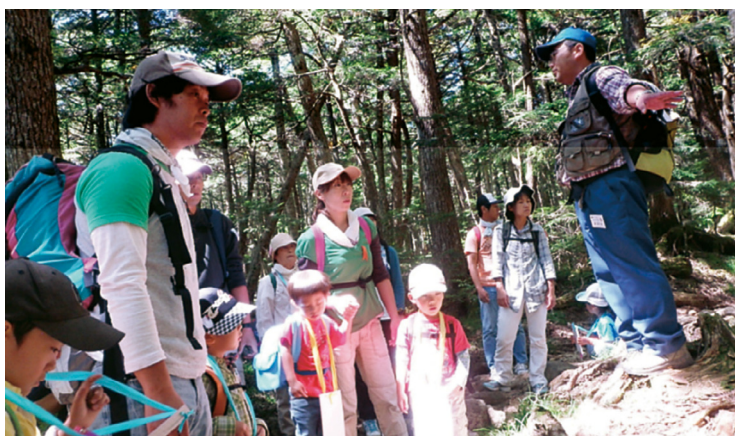
楽しみながら池の周辺を散策

登山コースでは、親子・家族、また参加者同士が助け合いながら標高二千三百三十メートルの丸山や二千二百六十五メートルの高見石の頂に到達し、澄みきった青空のもと、目に飛び込んでくる周囲の山々や白駒池等の情景に、皆さんが驚きと感動の表情を浮かべていました。