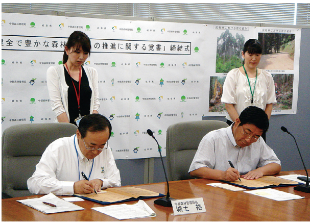
覚書に署名する城土局長（左）と古田岐阜県知事

農林水産省では、昨年十二月に十年後の木材自給率五十%以上を目標とした「森林・林業再生プラン」を策定するとともに、本年六月には、その目標を実現するため、「民有林と国有林が一体と