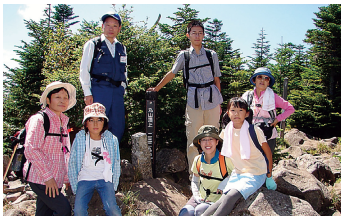
丸山の頂上に立つ登山コース参加者

が降り注ぐ中、参加者の皆さんは、スタート地点の麦草ヒュッテ（麦草峠）において、日本鹿による食害についての説明を受けた後、眺望が素晴らしい丸山・高見石までの登山コースと神秘的森が広がる白駒池周辺の自然散策と森林の学習コースに分かれ、原生林の中を歩きながら北八ヶ岳の大自然を満喫しました。