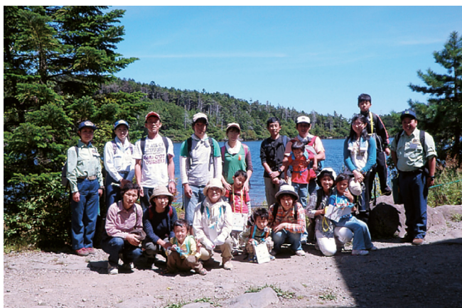
白駒池にて記念撮影

「指導普及課」 九月四日（土）、小中学生の親子・家族を対象に、自然散策や登山、森林浴を通じ、親子・家族が一緒になって、北八ヶ岳の豊かな自然を満喫しながら、森林の役割について理解を深めてもらうことを目的とした「親子森林探検隊in八ヶ岳」を、十四組、総勢四十二名の親子・家族の参加を得て、南佐久郡佐久穂町の北八ヶ岳自然休養林において開催しました。