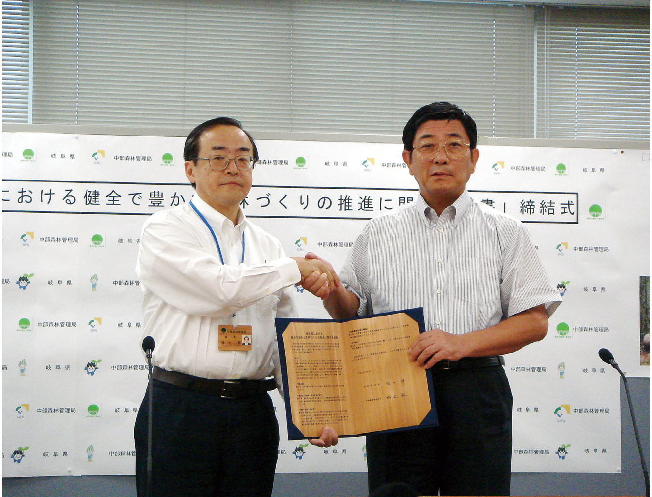
握手を交わす城土局長と古田岐阜県知事