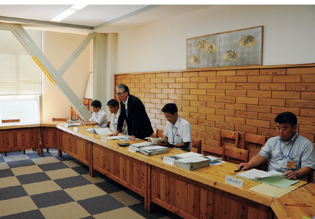
決算概要の公表の様子

売上高等の減少、減価償却費・資産除却損等の増加により、損益計算上の損失は前年度より七億九千万円増加して三十五億三千万円となりました。