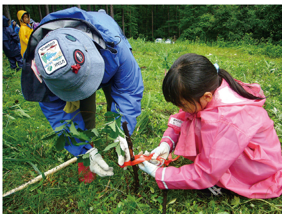
苗木に目印テープを付け替えるスカウトたち

中には冬期の積雪のために折れているものもあり、スカウトたちは、冬の厳しさを実感しながらも、生き残った苗木に頼もしさを感じながら、鎌で丁寧に草を刈り払い、苗木の目印テープを新しく付