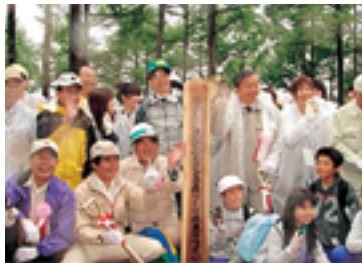
雨中の長野県植樹祭