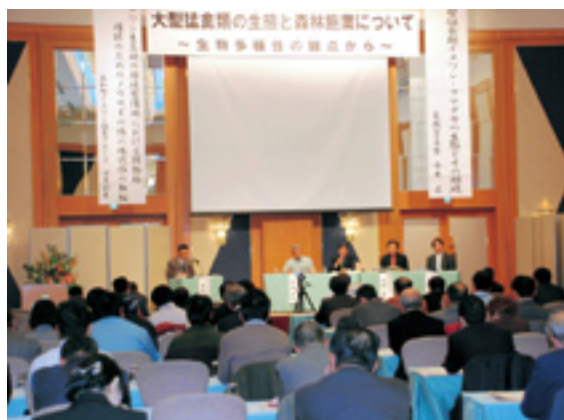
大型猛禽類の生態と森林施業講演会