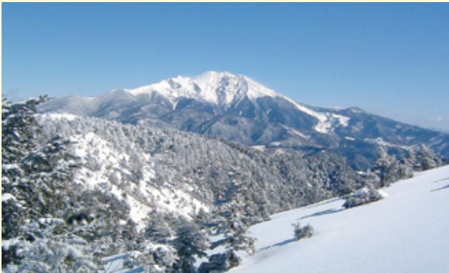
小秀山から望む冠雪の御嶽山