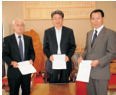
国有林防災ボランティア制度に関する協定を終えて