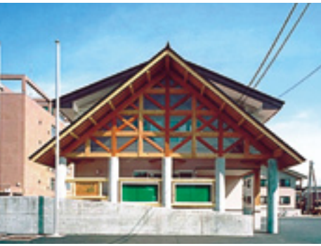
完成した北信署新庁舎