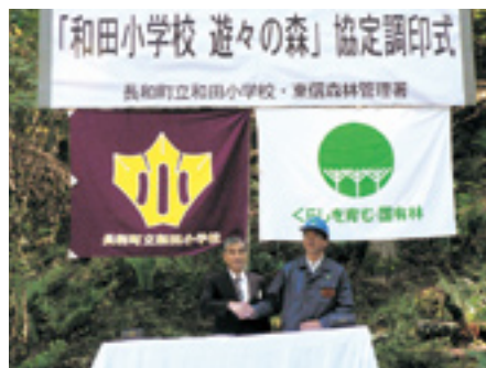
和田小学校「黒耀の森」協定調印式