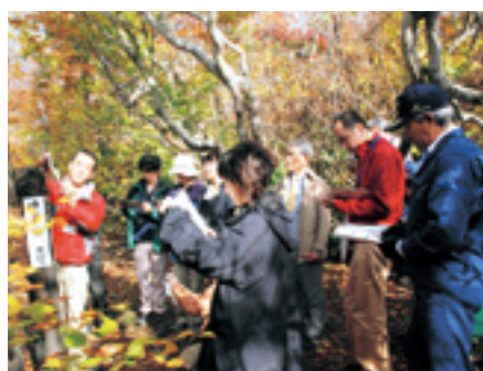
日本ジャーナリストの会 国有林視察