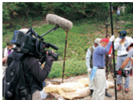
南アルプス仙丈岳ニホンジカ防護柵設置の取材状況