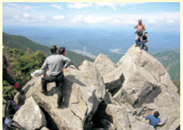
兜岩からの眺望を楽しむ登山者