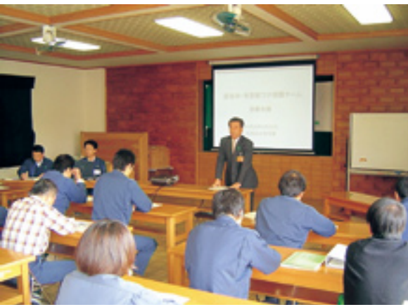
有害獣捕獲チーム設置会議の様子

娠)の合計二十六頭を捕獲し成果を上げることができました。また、この取組では、ニホンジカの個体数調整のほかにも、職員がワナによる有害獣の捕獲の知識、技術を習得できたことや、地域で深刻化している有害獣問題に国有林として地域と連携・協力できたこと、更には、その取組内容がマスコミ等を通じて広くPRされたことで、地域が抱える有害獣問題を関係者や一般に浸透させるなど大きな成果を上げることができました。