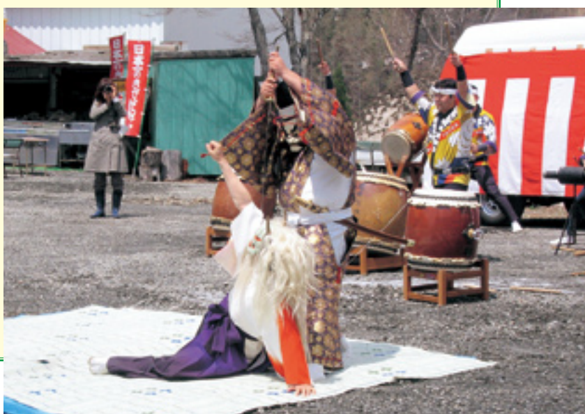
平維茂に征伐された鬼女紅葉（開山祭より）