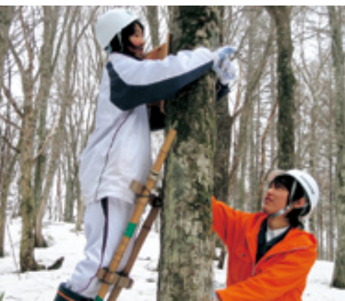
自作の巣箱を取り付ける生徒

同園は、野鳥の宝庫としても全国的に有名で、百種以上が観察されています。今回設置された巣箱でも、シジュウカラ等が繁殖を行い、来園者を喜ばせてくれることでしょう。