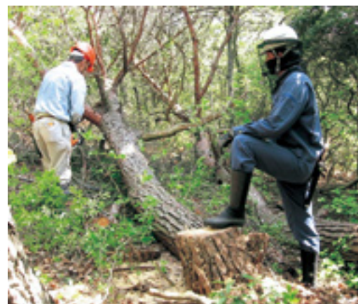
枯損木を処理するボランティア