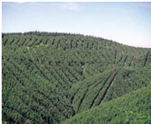
間伐の推進 (列状間伐実施箇所)

京都議定書で我が国が約束した六割の温室効果ガスの削減目標のうち、二・八割(千三百万炭素ト)を森林吸収量で確保することとなっているところである。これを達成するためには、平成十九年から