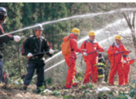
合同消火訓練に参加した森林官等

愛知森林管理事務所では、四季を通じて散策、オリエンテーリング活動の場として多くの人に利用されている東海自然歩道沿線の国有林が、アカマツの衰退した針広混交林となっており枯損木も多く見られることから、「見て触れて楽しめる明るい林内整備」を目指し、散策者への安全確保を含めた景観整備を進めています。このような取組の中、NCFCから枯損木の伐倒作業を体験メニューに加えたという申し入れがあり、実施に当たっては特殊な技術を要することから十分な検討を行うとともに当所技術指導者立ち会いのもと実施しました。