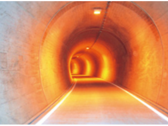
照明により通行安全性が向上したトンネル内

五 まとめ 今後は、これを活用し安全な資材輸送を行い、スゴ谷上流域の復旧を効率的に実施していく考えです。