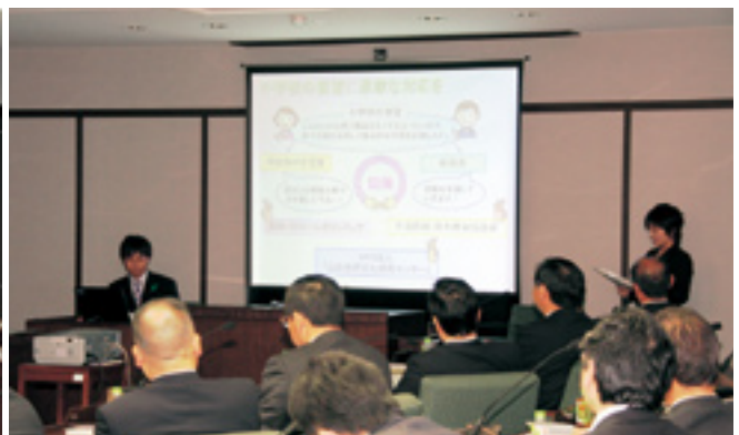
説明する飛騨署職員