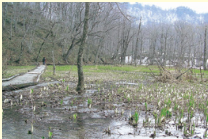
木道脇に広がる清楚なミズバショウ

旬の今池湿原には、一目八十一万株といわれるミズバショウが咲き観光客の目を楽しませてくれます。