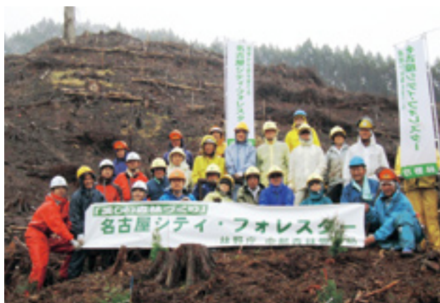
作業の後での記念写真

前日は、林木育種センター職員と共に晴天の中で事前準備を行い、当日も晴天と思いきや、あいにくの雨天となり最悪の事態も考えましたが、雨にもかかわらず集まっていたいた十七名の隊員により植樹作業を実施しました。参加した隊員は合羽を羽織りながらも