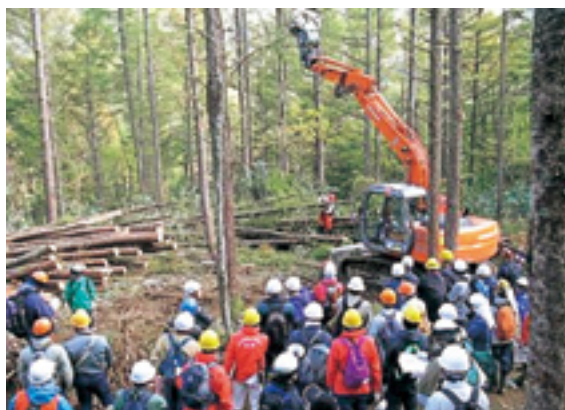
低コスト・高効率作業システム現地検討会

①素材生産事業を行う十署等において、現地にあつた作業システム及び路網の開設を試行(十九年度・三署から拡充)。また、民有林関係者とも連携して現地検討会を実施。