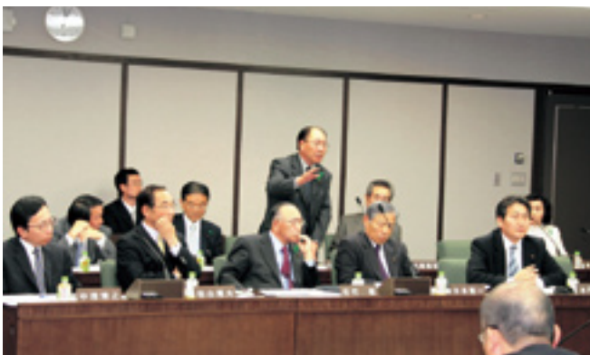
熱心に質疑をする市議会議員