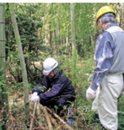
モウソウチクの除去作業

「きんたろう倶楽部」は富山市を中心に竹林等の整備を数多く行っていることからベテランの会員も多く、今回は、自走式チップパー機二台が作業に加わり、伐採したモウソウチクを林内に集積することなくチップ化して散布しました。会員の手際よい作業によって、スギ林の中も見違えるほどすっきりと整備され、心地よい汗をかいた会員からは「やりがいがあったな」、「チップを何かに活用できないか」との声も聞かれ、来年の再会を約束し作業を終えました。