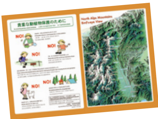
作成した四ヶ国語パンフレット

また、裏面には、北アルプスの山々の鳥瞰図を掲載していることから、日本の北アルプス登山の思い出となり、家族の皆さんにも日本の登山マナーを伝えることが期待されます。