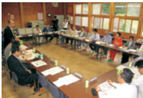
ボランティア団体との意見交換会の様子

め、外国語の案内看板が必要」、「今後も継続して総合的な保全事業を行って欲しい」等、様々な意見や提案が出されました。その中でも、「登山道のひとつである馬の背登山道の荒廃が目立ち、周囲の植物に影響を与えているのが心配なので早急な対策が必要」との意見に対して参加者一人一人の金華山への思いが活発な議論へと繋がり、今後の金華山の保全と利用のために各団体、機関が協働して取り組んでいく意思統一を図ることができました。