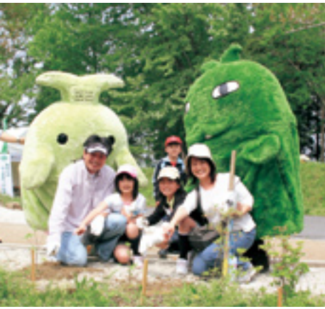
モリゾー・キッコロと記念写真