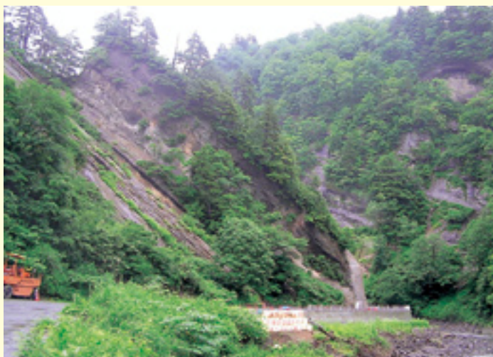
柔らかい地層が浸食されたケスタ地形