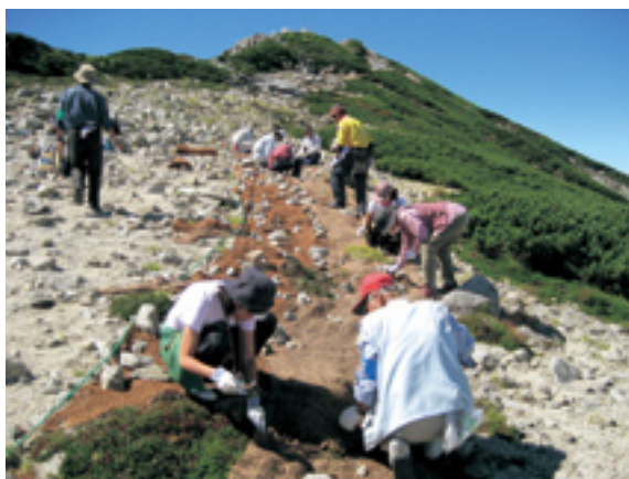
高山植物復元対策の実施

①ニホンジカによる高山植物の被害対策として、南アルプス仙丈ヶ岳において約〇・八haの防護柵を環境省・地元自治体との連携により設置。 ②管内全ての緑の回廊(四箇所、四万ha)において、野生動植物の生息・生育状況を把握するモニタリング調査を引き続き実施。 ③ヤツガタケトウヒ等の群落保護のため五箇所(五六〇ha)の保護林を新設(伊那市・富士見町)。また、保護林機能評価のための調査を新たに実施。 ④ライチョウ等の希少野生動植物の生息調査及び巡視を引き続き実施。 ⑤双六池や木曾駒ヶ岳等におけるヤシ繊維マット敷設による植生復元対策、グリーンロープの設置や保護巡視活動等を引き続き実施。