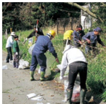
清掃する参加した職員

主催者を代表してNPO法人朝倉川育水フォーラム代表から挨拶の後、朝倉川全域にわたり地元の児童、生徒、住