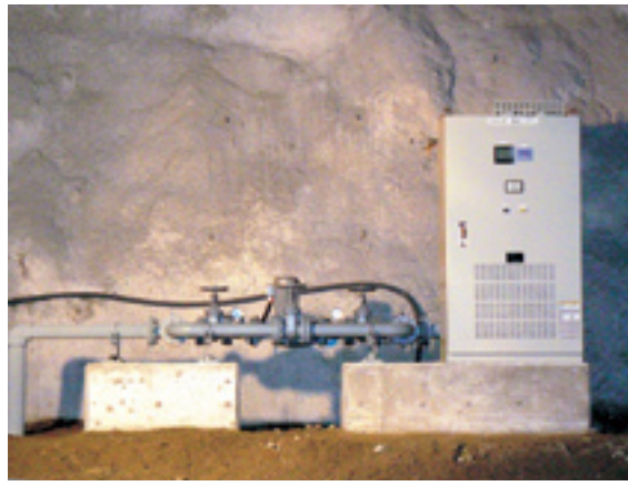
トンネル内の待避所に設置した発電機と制御器