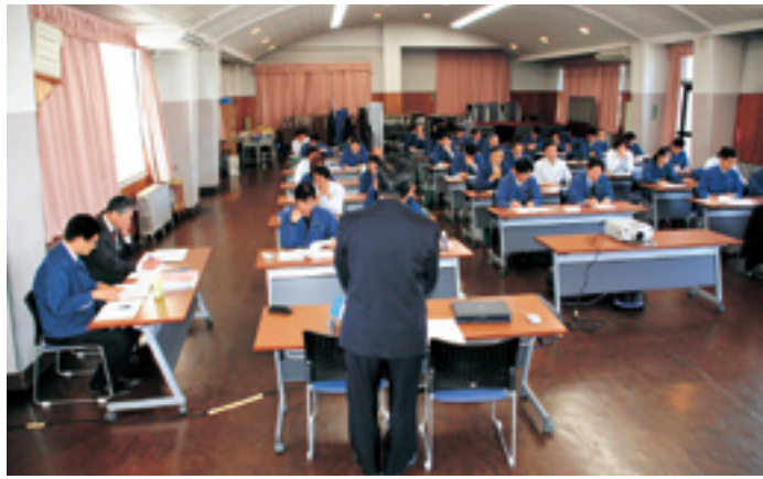
監督職員等への説明会の様子

て、素材生産及び造林の請負事業の一般競争入札の実施に係る説明会を開催し、森林官等百七十名が出席しました。 本説明会は、一般競争入札に即した契約約款や仕様書が新たに制定され、事業成績評定制度が導入されたことに伴い、監督業務等を円滑に実施する観点から開催したものです。 説明会では、請負契約における一層の透明性、公平性の確保等制度のポイントや新たに導入した事業成績評定の具体的な実施方法を重点に説明が行われました。 今後は新たな制度の下で、請負事業の円滑な実施に努めていくこととしています。