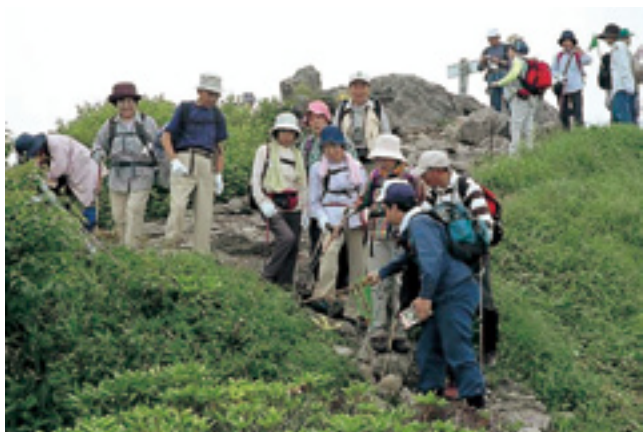
森林イベントの開催

④一般公募した市民による国有林モニター会議等を通じ、国有林への要請を把握し管理経営に反映する対話型の取組を引き続き実施。