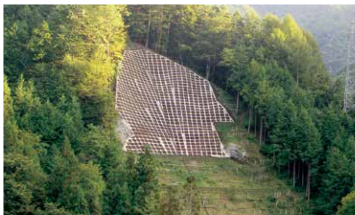
鳶ヶ巣復旧治山工事 完成状況