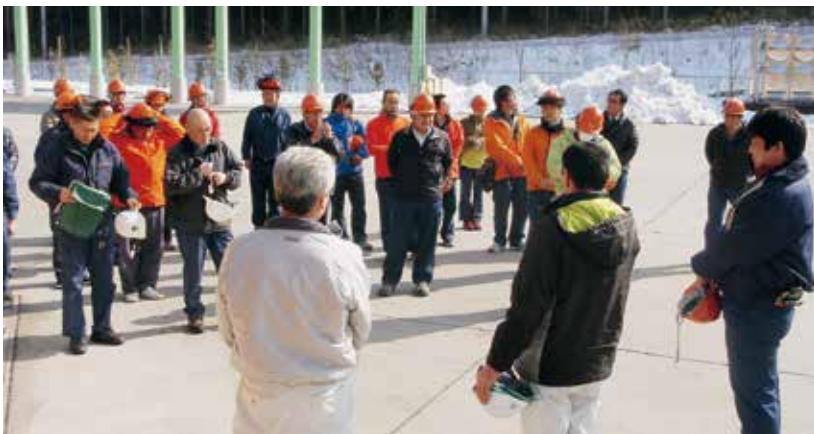
合板工場見学の様子

後、局・技センを含め総勢三十三名が参加して、管内にある内陸型国内初の「森の合板工場（平成二十三年本格稼働）」において、当署から生産された木材が製品として出荷されるまでの工程を見学しました。エンドユーザーとして国産材の安定供給に期待する切実な現場の声も聞かせて頂き、計画的な事業実行の責任を感じました。また、治山グループでは「国産針葉樹型砕合板の利用推進」という課題に更に一歩足を進める機会となりました。