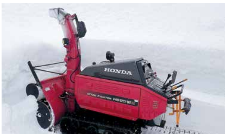
使用している除雪機

赴任当初は、雪深い奥地の村でうまくやっていたのだろうかと不安も多くありましたが、村民でもある非常勤職員の方々に支えられ、巡検用務や地域との対応などスムーズに事業を進行させることができています。また、無理だと思っていた大型除雪機の運転も、ご近所の方から褒められるまで上達しました。