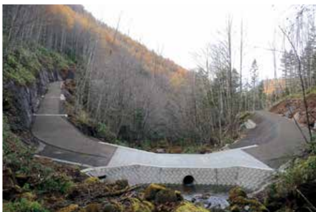
東俣谷林業専用道新設工事 完成状況