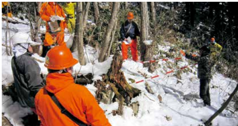
低コスト現地検討会の様子

後、局・技センを含め総勢三十三名が参加して、管内にある内陸型国内初の「森の合板工場（平成二十三年本格稼働）」において、当署から生産された木材が製品として出荷されるまでの工程を見学しました。エンドユーザーとして国産材の安定供給に期待する切実な現場の声も聞かせて頂き、計画的な事業実行の責任を感じました。また、治山グループでは「国産針葉樹型砕合板の利用推進」という課題に更に一歩足を進める機会となりました。