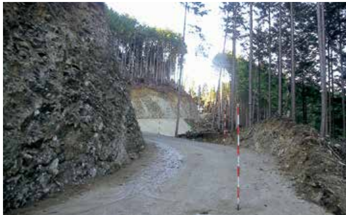
伊勢谷林業専用道新設工事 完成状況