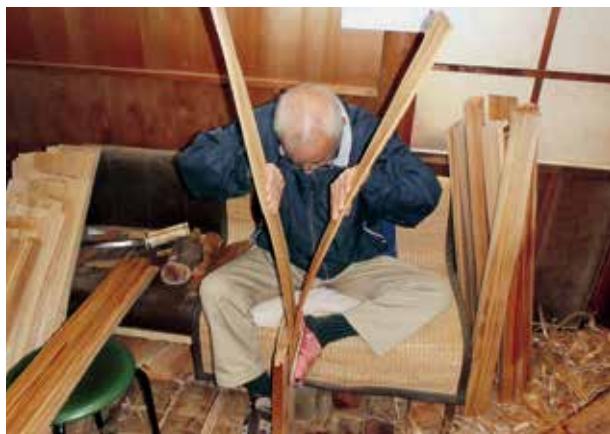
へぎ板の製作の様子

木曾郡木曾町開田高原では、昭和四十四年に木曾馬保存会が設立され、一時絶滅寸前であった「木曾馬」の飼育・保存に取り組み、現在では百六十頭程度まで増えてきています。 木曾郡木曾町開田高原にある「木曾馬の里・乗馬センター」には、約三十頭が飼育され、乗馬体験など観光客の人気を集めています。