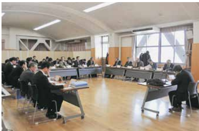
第三回検討会の様子