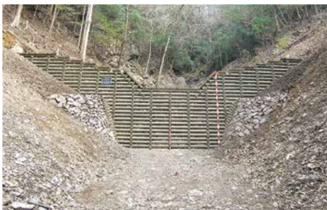
閘笥（男川支溪）復旧治山工事 完成状況