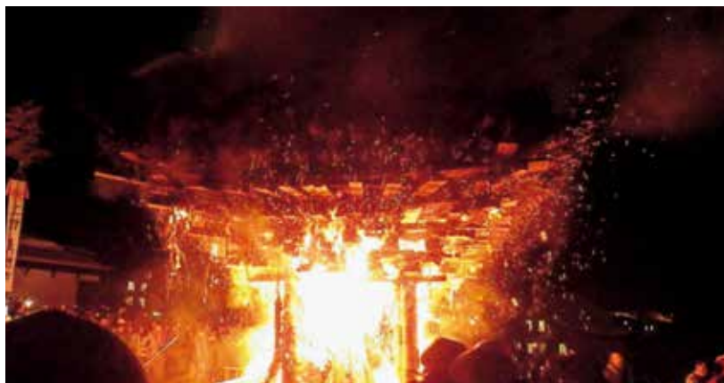
攻防の末、火が点けられた道祖神祭り社殿

野沢森林事務所は長野県のほぼ最北端に位置し、日本でも指折りの豪雪地帯である野沢温泉村に所在します。国有林は新潟県との県境稜線部が大部分を占め、約四千五百ヘクタールの森林面積を管理しています。国有林の多くは地域の重要な水源かん養林となっており、国有林内の水尾山から湧き出た水を使って造られた日本酒「水尾」は、後味の切れが良く、多くの日本酒ファンを魅了しています。