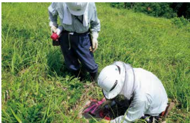
非常勤職員との巡検用務

管内の植生はブナの天然林が多く存在し、新潟との県境を歩く信越トレイルは北信署、上越署、地元NPOとの協定により整備され、春にはブナの新緑やギフチヨウなど、自然の豊かな風景を見るこ