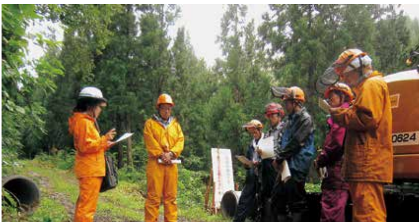
生産事業における安全指導

野沢温泉村では日本三大火祭りの一つに数えられている「道祖神祭り」が毎年一月十五日に開催されます。その社殿の一部に使われるブナ材の供給を村と協定を結んで行っています。管内には、こうした地域との連携を必要とする業務も多くあります。