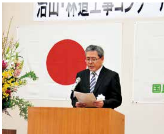
計画保全部長講評

このコンクールは、国有林野の公益的機能を十分に発揮させ、森林林業の再生の推進その他の事業実施における施策効果を一層発現させることに貢献した治山・林道工事であって、民有林の模範としてふさわしいものを表彰することにより、治山・林道工事における計画・設計・施工の適正化及び設計・施工技術の向上、並びに関係者の意欲高揚に資することを目的に治山部門は昭和四十二年度、林道部門は昭和四十四年度から実施