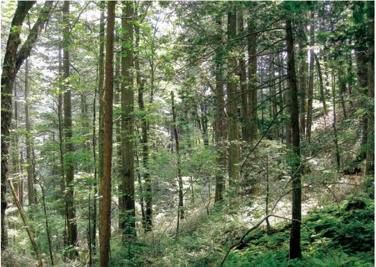
長野県木曾郡上松町 国有林内 温帯性針葉樹林