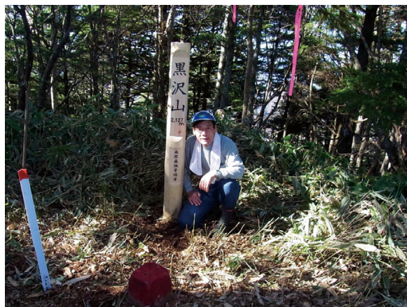
境界巡視の際に手作りの山名標を立てる

のに丁度良いくらいの規模ですが、地質が中生代の付加体からなるチャートを含んだ硬い岩石からなるため、ほぼ全域が急峻な切り立った地形をしており、近い距離でも現地に到達するには非常に時間がかかります。そのため、現地に何度も足を運ぶのは大変なので、できるだけ一度で済ますようにと、効率的な業務運営が自然と身につきま 辰野町の民有林には全くと言っていいほど自然林がありません。国有林は二十五パーセントが原生的な自然林のために、地元からも様々な要望が出されています。地元のニーズに合った、横川国有林の独自性を発揮した取り組みを進めていきたいと考えています。