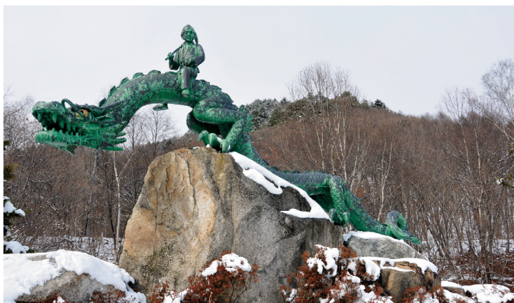
犀竜の母子像 (長野県大田市)