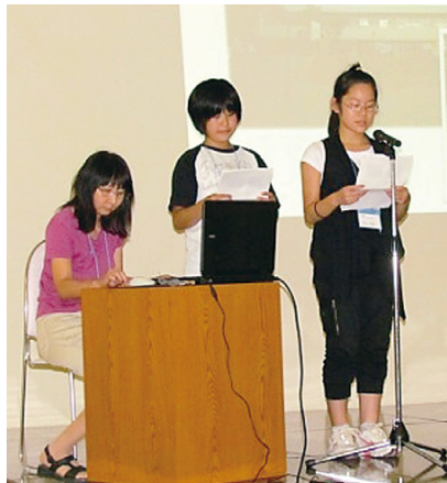
緊張しながら精一杯プレゼンを実施