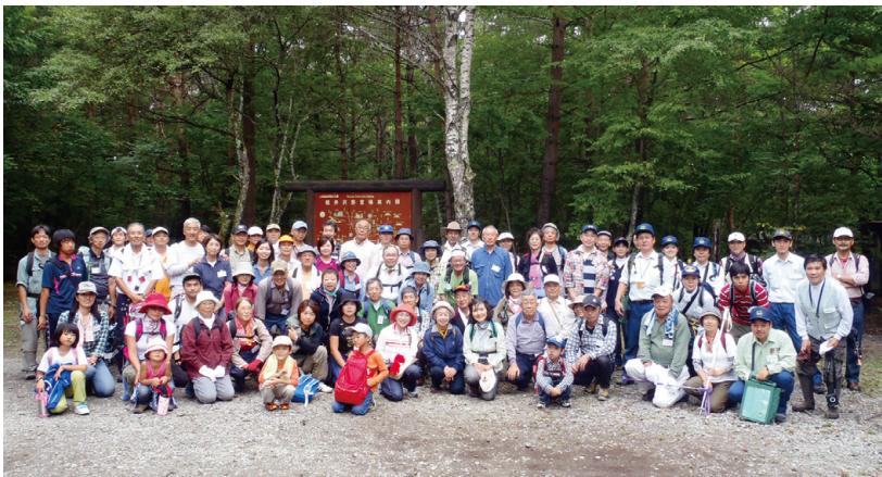
ツアーに参加された皆様

同事業の中では、三回の自然観察ツアーを計画しており、今回は、六月十二日（日）に行った「カラマツの新緑を楽しむ」に続く第二回目の開催となり、約八十名が参加しました。