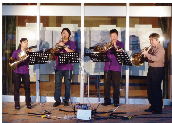
音楽祭の開催前のアトラクション（背景に写真パネルを展示）

「木曽式伐木運材図会」はわが国の代表的な林業地として知られた木曽地方や飛騨地方において、江戸時代から大正時代頃まで行われていた伐木・運材の様子を描写した絵巻であり、現在中部森林管理局で保管しています。