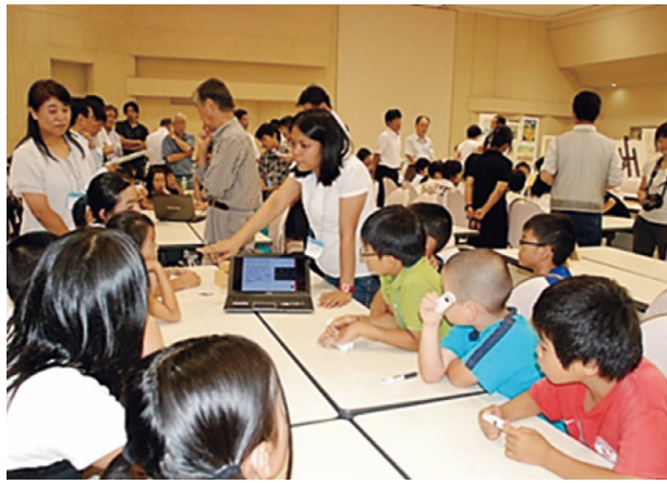
オイスカ海外学校林関係者との交流会の様子