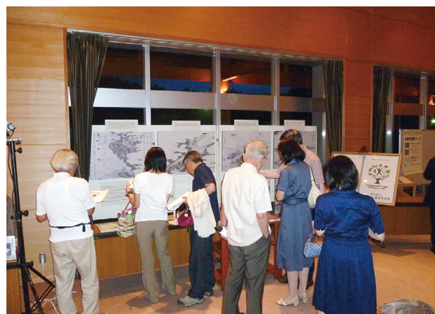
興味深そうに展示をご覧になる皆さん

クラシック音楽のイベント会場での展示ということで、一風変わった取り組みでしたが、国際森林年の意義や、古くから木曽山で営まれてきた林業に対する理解の醸成に資することができたものと考えています。