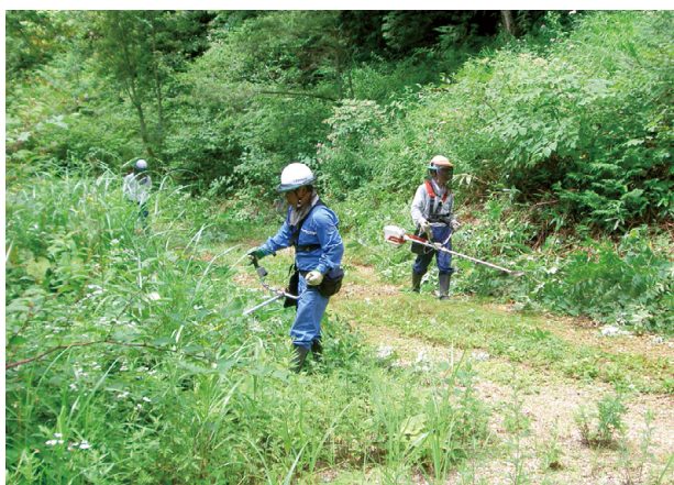
林道刈払いの様子

あり、高原野菜（特にとうもろこし、白菜）の生産が盛んです。御岳山東側山麓の新高国有林の標高の高い箇所には、木曾谷ではめずらしいコメツガ、シラベ、アオモリトドマツなど亜高山性の成熟した森林が育成されています。