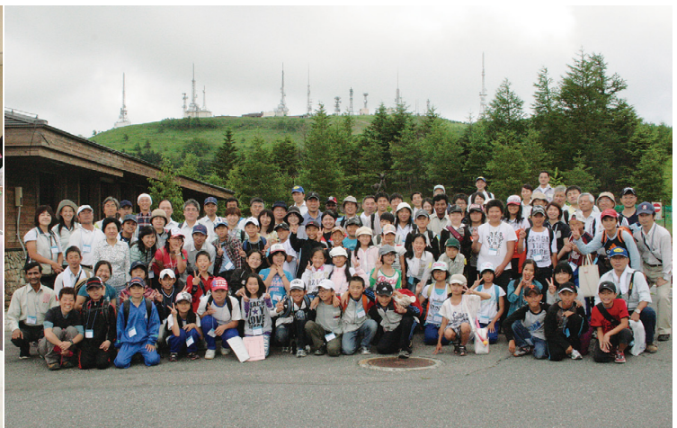
「学校林・遊々の森」全国子供サミット in 信州の様子