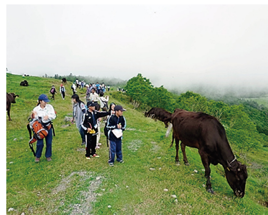
美ヶ原では放牧した牛が出迎えを

発表会終了後、宿泊場所に移動し、全員で夕食をとり、夜の部では、児童らはナイトウォークの他、ドバスアートに挑戦し、教師の方は自然体験や活動における意見交換会に参加するなど、それぞれに交流を深めました。 二日目は、朝からバス三台に分乗して美ヶ原高原に向かい、夏の高原での自然散策を実施しました。