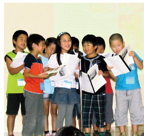
みんなで一致協力して活動を発表！

また、会場には、協賛企業による環境保全活動のPRパネルや環境グッズ、海外の児童が描いた絵画が展示され、サミットを盛り上げました。