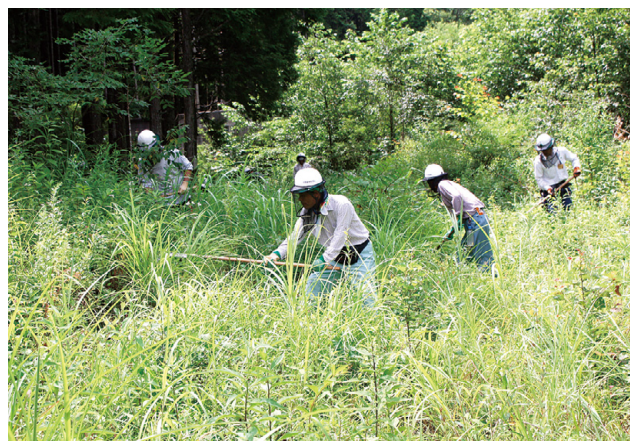
草刈作業をする参加者

森育成協議会と当支署の間において、森林整備を通じて、木の文化の継承を目的に、平成十八年に協定を締結し、以降毎年森林整備を実施しています。当日は、草刈作業及び生育に支障とな