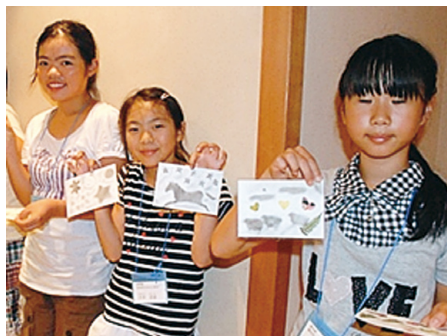
ドバスアートが完成して満足げ

児童達は、高原の清々しい空気を感じながら美ヶ原高原自然保護センターに戻り、各班で「ふりかえり」を行い、自然散策を終りました。この後、昼食を取り、それぞれに別れを惜しみながら美ヶ原高原を後にしました。 なお、次回（平成二十四年度）は、近畿中国森林管理局管内において開催される予定です。