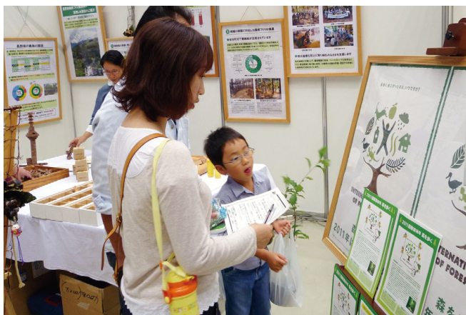
森林クイズに答えてすてきなプレゼントをもらおう

「企画調整室」 八月二十日、二十一日に開催された信州環境フェア（信州環境フェア実行委員会主催）に、長野林政協議会（長野県林務部・中部森林管理局）の取組として参加し、民有林と国有林の連携による森林づくり、地球温暖化防止対策、国際森林年等をPRしました。