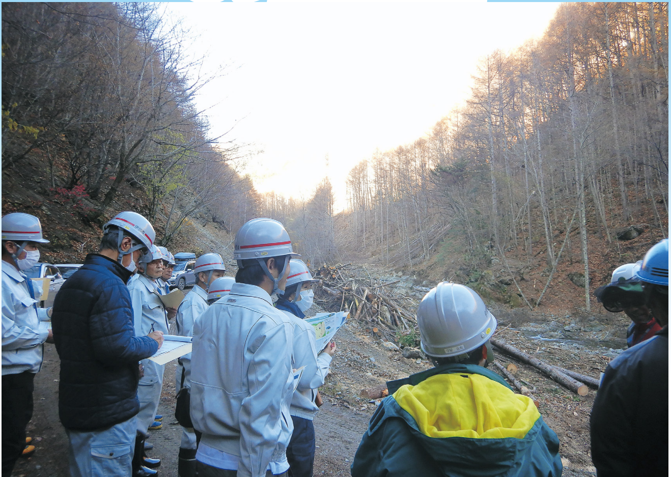
林業事業者から架線集材について説明を受ける伊那市議会議員