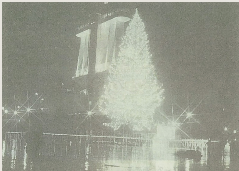
平成4年 名古屋港に設置されたツリー (現在の飛騨森林管理署が販売)

しかし時代は移り、戦後に植栽した造林木が成長してきた昭和五十年代後半から平成初期にかけては、各営林署での収入を上げるため、ウラジロモミ類などをクリスマスツリーとして販売する試みが行われました。