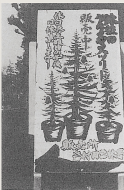
昭和五十九年 ツリー販売の宣伝看板 (現在の東信森林管理署)

その一方でクリスマスツリー用木のニーズは存続し、若齢木の盗伐が国有林でも続発、昭和三十年代後半のシーズン前には首都圏からアプローチしやすい浅間山周辺で盗伐防止のパトロールが行われる事態にもなっていました。