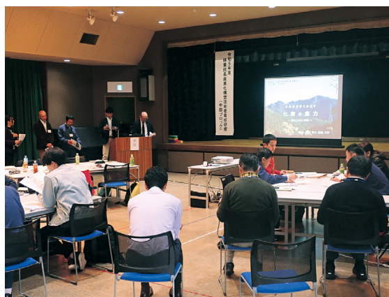
「林業成長産業化構想演習」の発表状況

現地検討や森づくりの現地実習を行い、三日目は各班で実際に路網・森林整備・木材生産の各事業計画と林業成長産業化のための戦略を練り、四日目には、その検討結果を発表し、質疑応答を行いました。参加した受講生からは、「最新技術や各種ソフトを活用して、市場のニーズに応じたサプライチェーンを含めた戦略や構想作りのノウハウを学習できた」などの声が聞かれ、技術力養成への一助となる研修となりました。 当センターでは今後も当該研修の現地スタッフとして、研修の運営をサポートしたいと考えています。