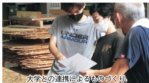
大学との連携によるものづくり

SDGsの取り組みとして、二十数年培ってきたストランドボードの技術を土台とし、いぐさやヨシ、竹、もみながら、稲わら、茶葉のカスタマイズのボード建材開発をはじめ、コーヒー豆カス等の食品廃材、工場から排出されるパッケージ端材や木質端材等の循環を目指した新たなボード開発にも取り組ませていただいています。