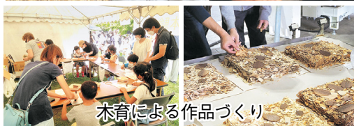
木育による作品づくり

また、「想いをつなぎ」を理念に、地域や企業、行政、NPOをはじめ大学や高校、子供たちと一緒に想いをのせた建材開発や木育、大学研究・VR等の研究など、たくさんの方と関わり、未来を創っていく取り組みを実践しています。