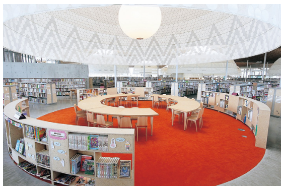
岐阜県産ヒノキのストランドボードを 書架、収納ケース、テーブルなどに使用 (ぎふメディアコスモス)

エスウッドは、森林資源が豊富な岐阜県の恵みをいただき、地域材、特に間伐材や小径材に新たな価値を、新たなマテリアル利用を