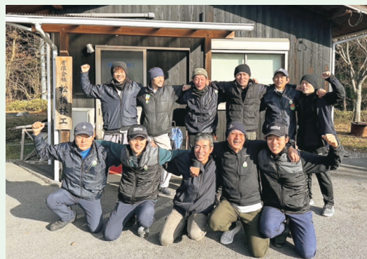
美しい自然を次世代に残すため、土砂災害等から人々を守るため、森林作業に誇りと生きがいを持って取り組んでいる松橋林工の山師たち

来年も一日一日を大切に、広報誌を発行していきたいと思っておりますので、よろしくお願いたします。それでは皆様、よいお年をお迎えください！