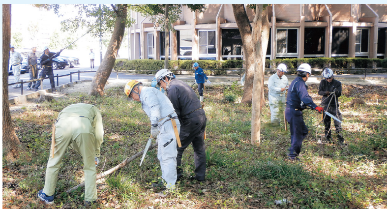
郷土の森で枯れ枝の除去などを実施

とする高齢級の常緑広葉樹林で、枝葉の繁茂や枯れ枝等が多く、隣接する白鳥庭園やタワーマンション、名古屋学院大学への通学など、歩行者や自動車への安全面も危惧されていました。