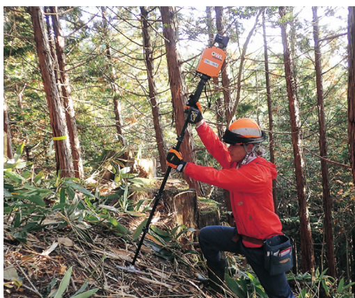
レーザー計測器で森林調査を行う筆者

森林に関わる仕事は幅広く、また、新しい技術も日々導入されるため常に勉強が必要ですが、地域や季節ごとに違う顔を見せてくれ