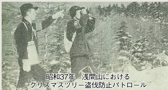
昭和37年 浅間山におけるクリスマスツリー盗伐防止パトロール

その一方でクリスマスツリー用木のニーズは存続し、若齢木の盗伐が国有林でも続発、昭和三十年代後半のシーズン前には首都圏からアプローチしやすい浅間山周辺で盗伐防止のパトロールが行われる事態にもなっていました。