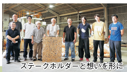
ステークホルダーと想いを形に

〒509-0108 岐阜県各務原市須衛町7-74-5 電話：058-379-3023 https://s-wood.jp/