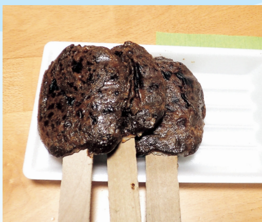
特産エゴマの五平餅が美味

国有林の現場の最前線で、働く森林官の仕事や、管轄する地域の特色などを紹介します。