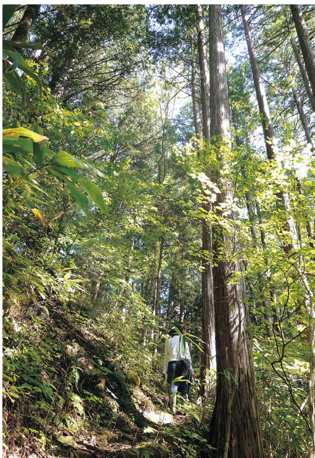
岐阜県最古のヒノキ人工林

そのような貴重な森林を守ることも森林官の仕事の一つですが、他に造林事業などの監督業務や境界の保全、増え過ぎたシカの捕獲