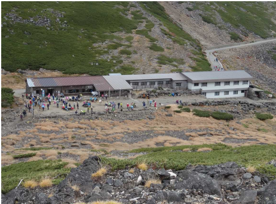
剣ヶ峰登山道より肩の小屋