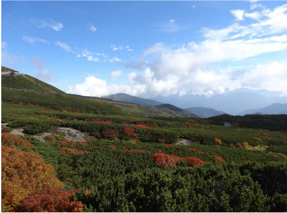
9月21日 紅葉が日増しに綺麗になっています。