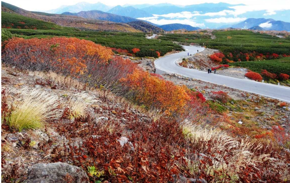
エコーラインの紅葉