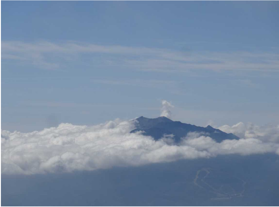
頂上より御嶽山を望む。