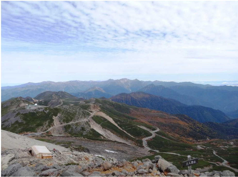
登山道より北アルプス方面