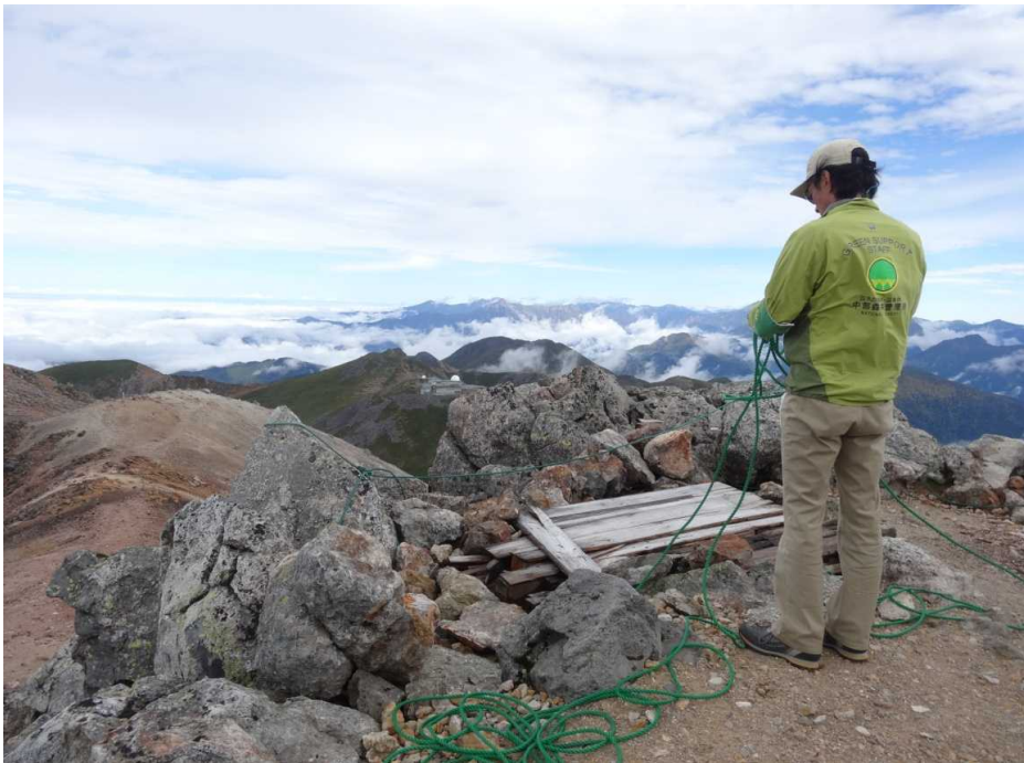
登山道のロープ張り