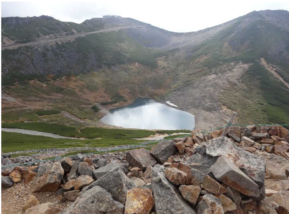
不消の池(富士見岳から)