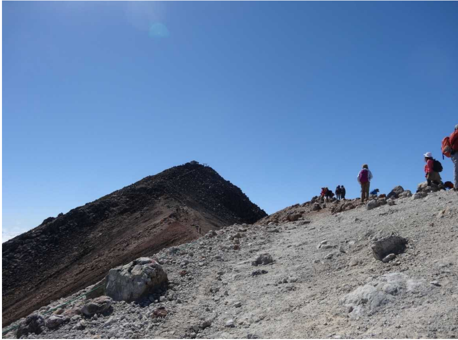
剣ヶ峰頂上を目指す。