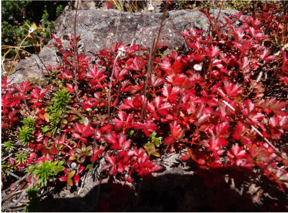
チングルマの紅葉