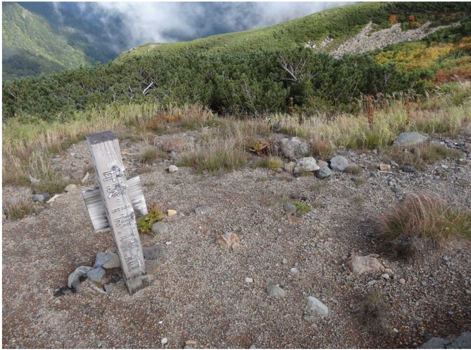
9月20日 平湯登山道口