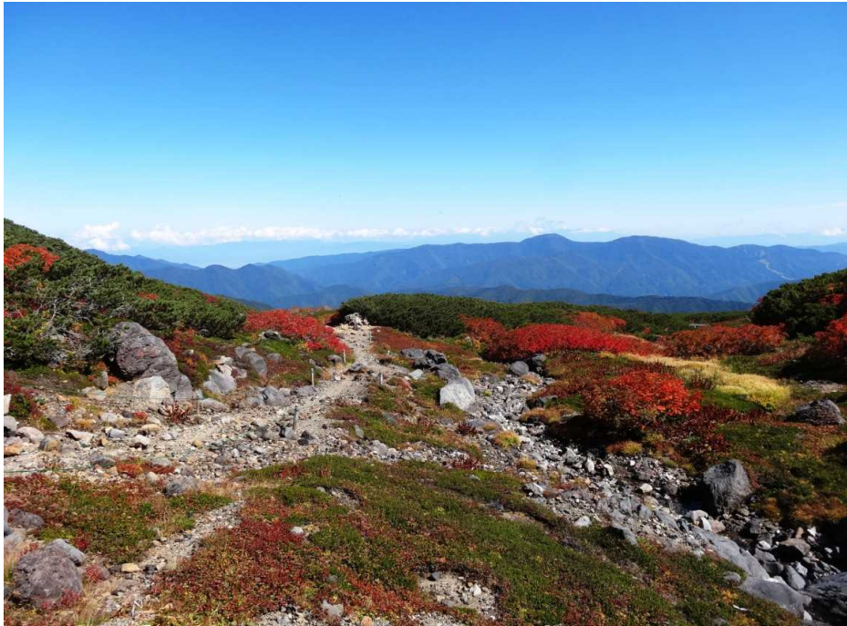
エコーライン登山道