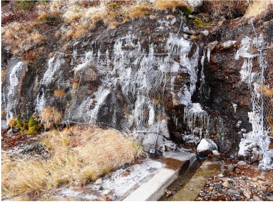
9月30日 エコーライン4号カーブの壁面の氷