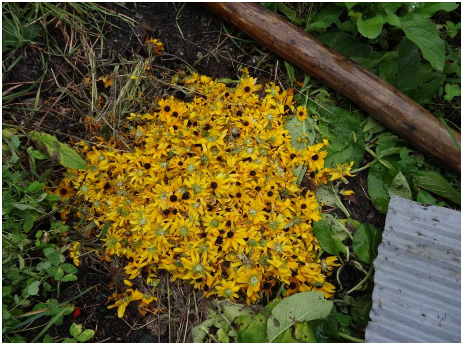
アラゲハンゴウソウ(外来植物)の除去分