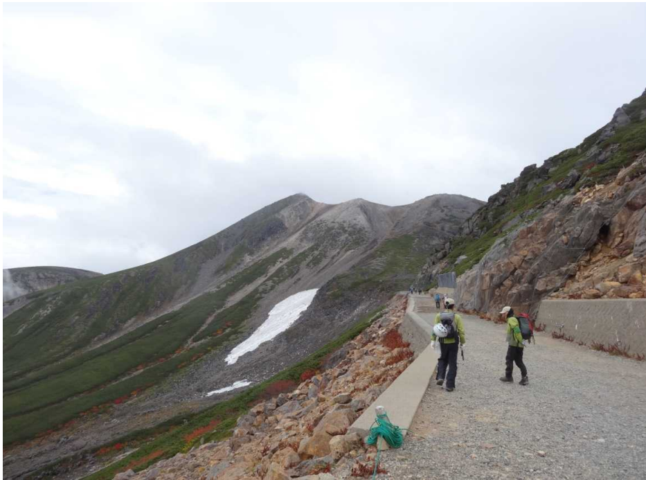
9月27日 東大道路より