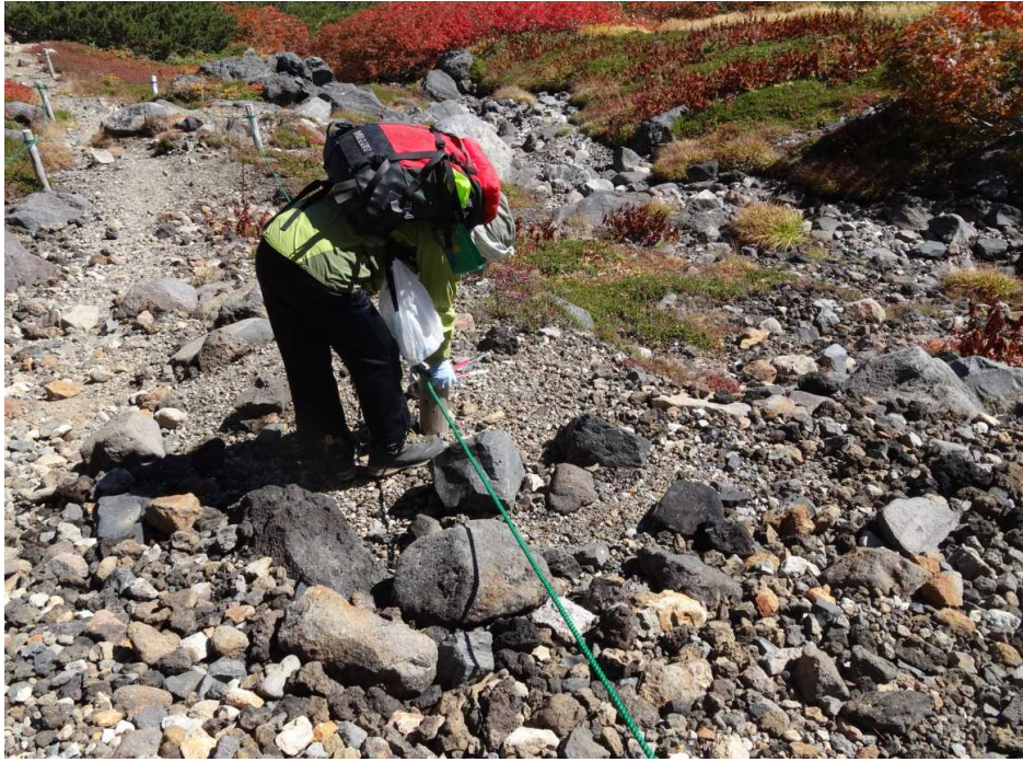
グリーンロープを下げる。