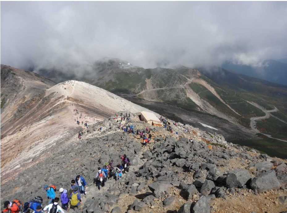
混み合う山頂付近