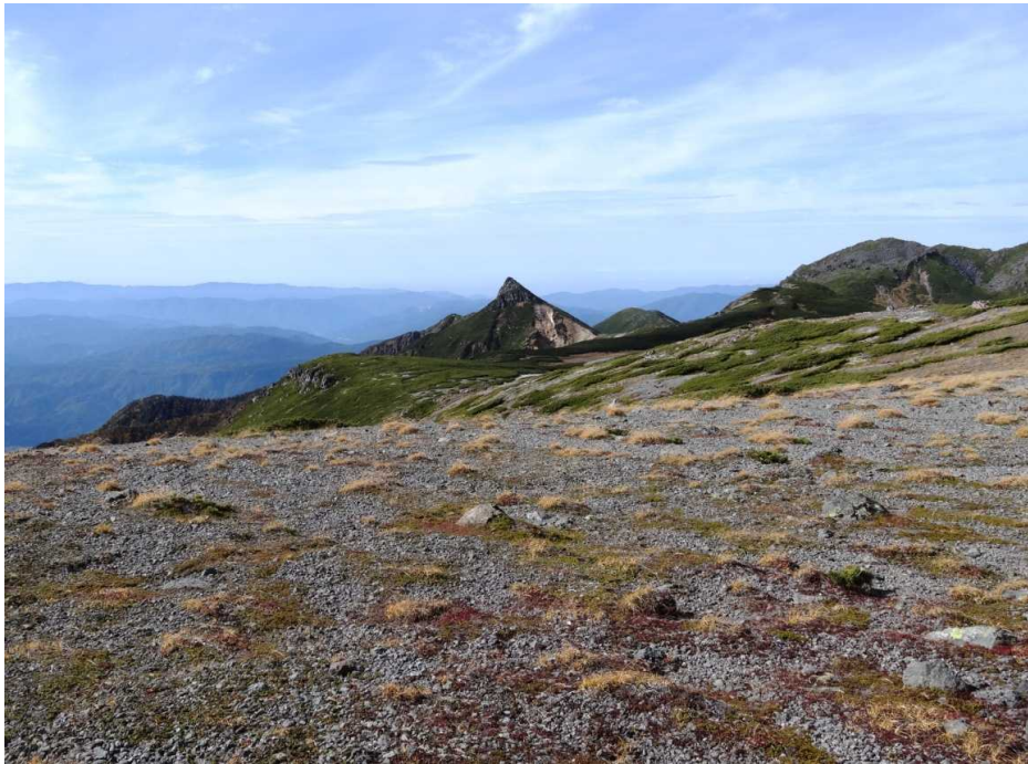
大黒だけより烏帽子岳