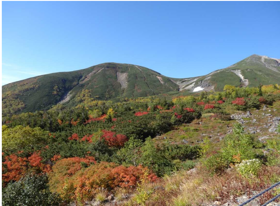
9月23日 乗鞍エコーラインの紅葉