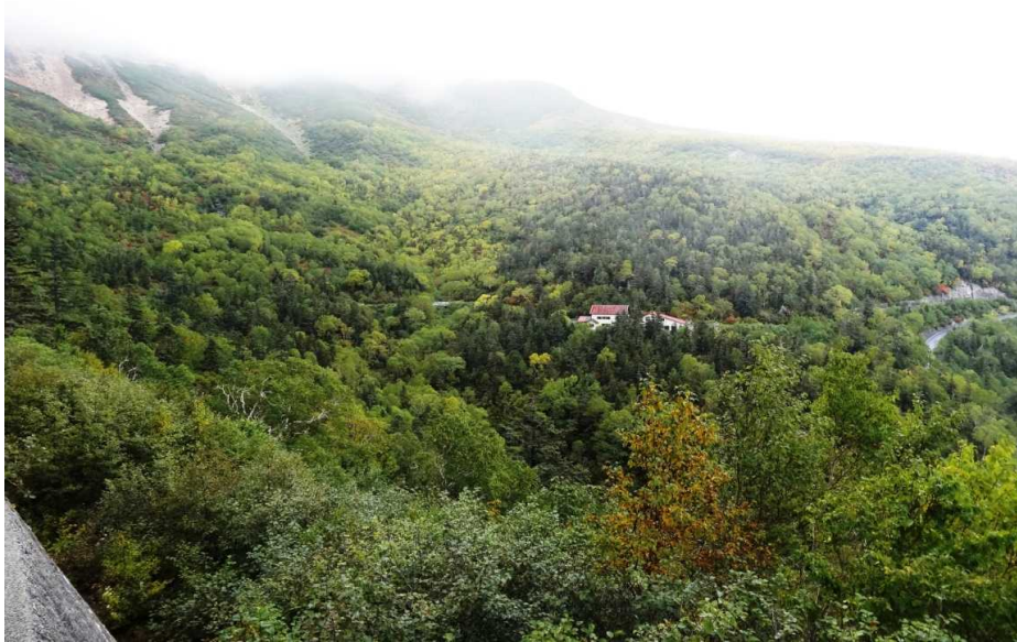
9月18日 位ヶ原の紅葉