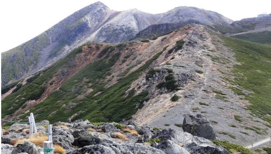
大黒岳より剣ヶ峰