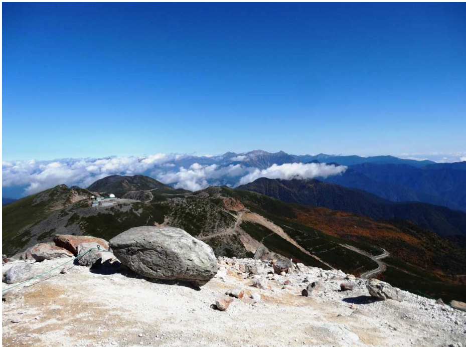
蚕玉より北アルプス