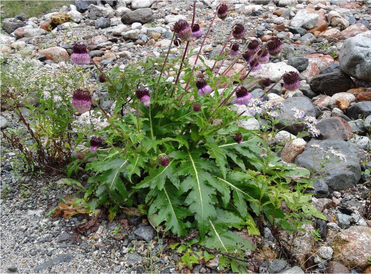
フジアザミ見事な花が咲いていました。