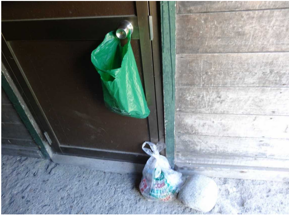
9月12日 横尾避難小屋建物内にゴミの放置有り(生ゴミ、食べ残し)回収。