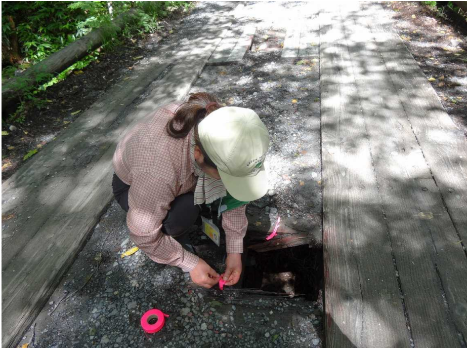
9月2日 治山道、長七尾根下流の橋の穴に赤テープにて標示。