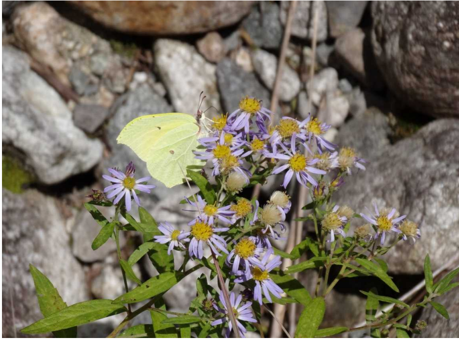
スジボソヤマキチョウ