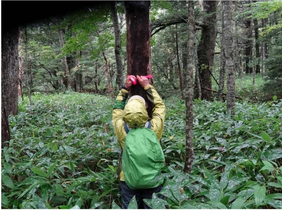
9月8日 枯れ木にテープを巻いて標示。