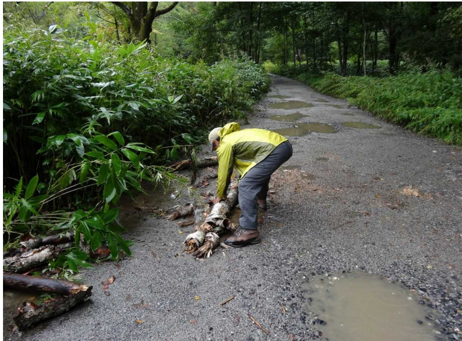
焼登山口に倒木発生。歩道脇へ寄せて処理しました。