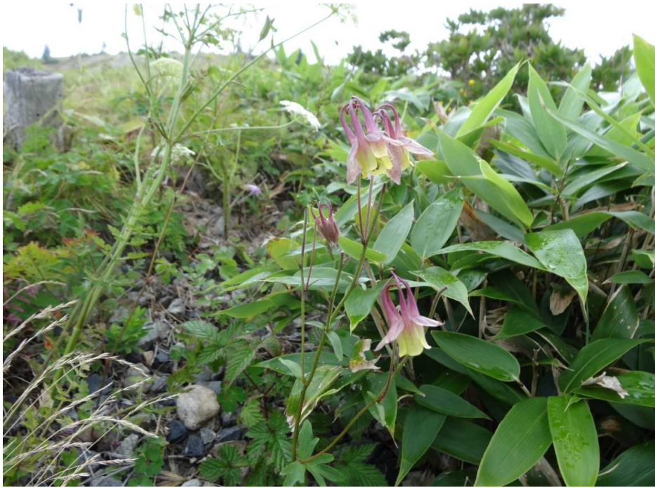
ヤマオダマキ(山苧環)