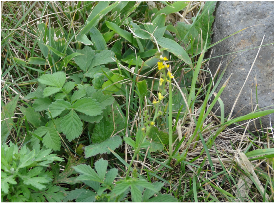
キンミズヒキ(金水引)