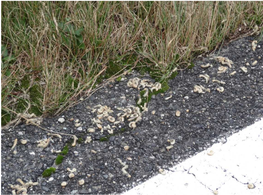
8月31日 ヤスデが去年に引き続き大量発生していました。