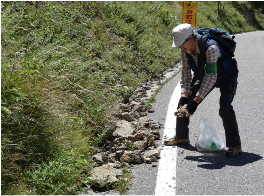
8月18日 落石の片付け