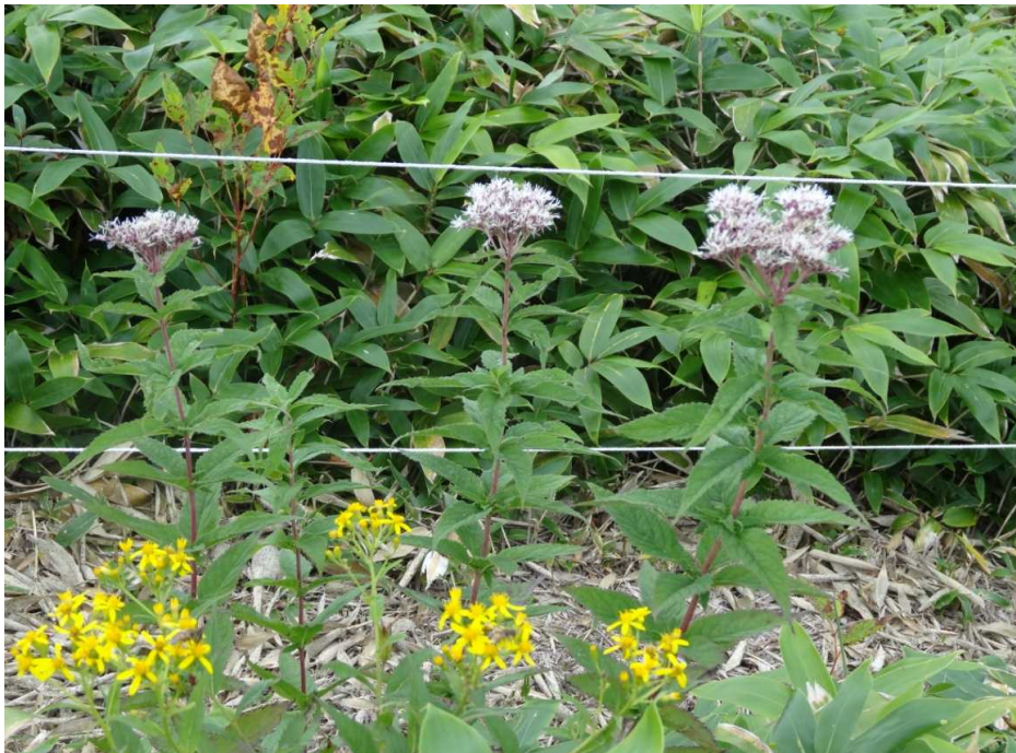
ヨツバヒヨドリ(四葉鶉)とキオン(黄苑)