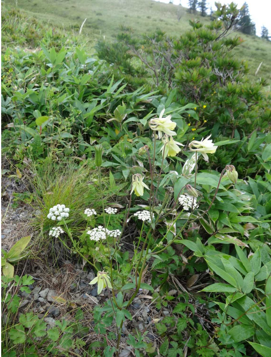
ヤマオダマキ(山苧環)とイブキボウフウ(伊吹防風)