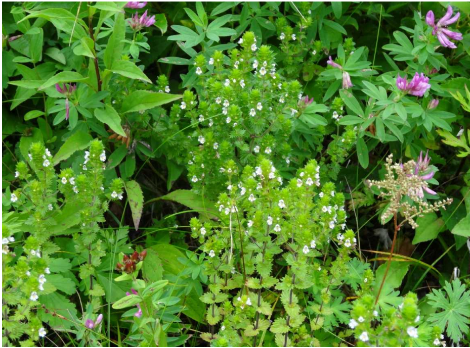
ミヤマコゴメグサ(深山小米草)とシャジクソウ(車軸草)