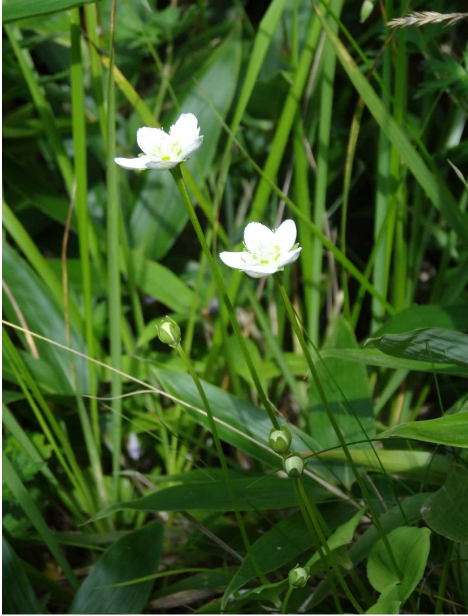
ウメバチソウ(梅鉢草)