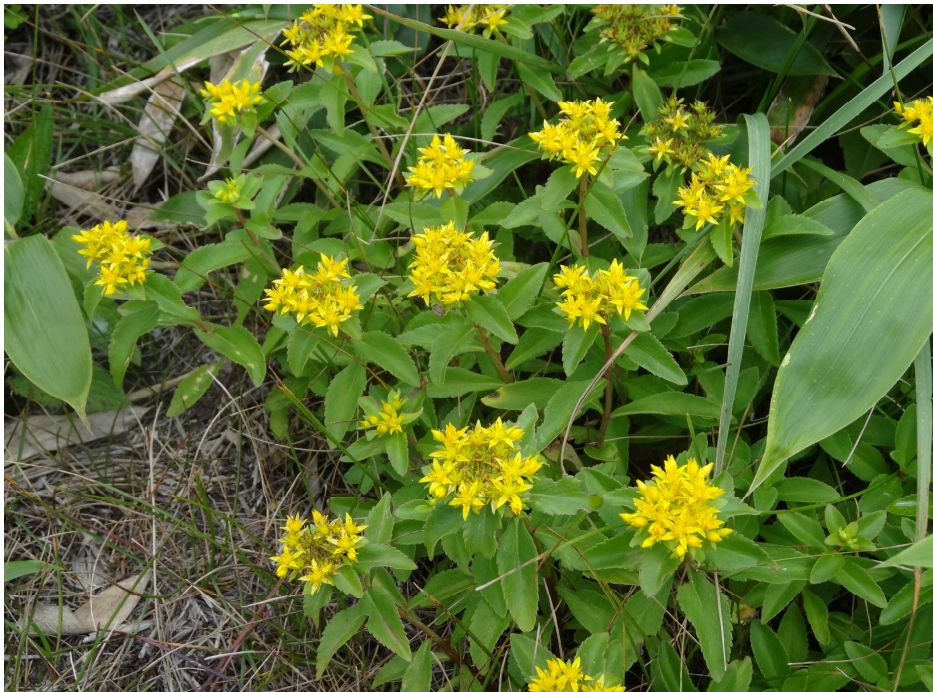
キリンソウ(麒麟草)