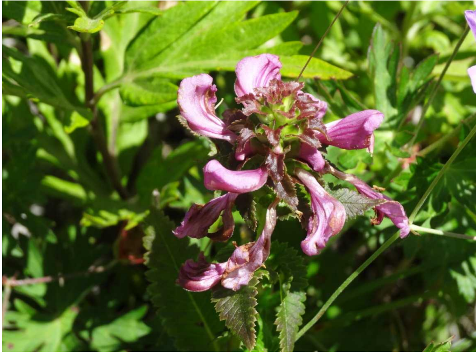
トモエシオガマ(巴塩竈)