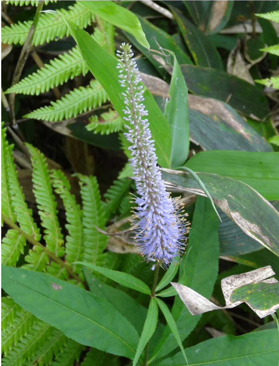
クガイソウ(九蓋草)