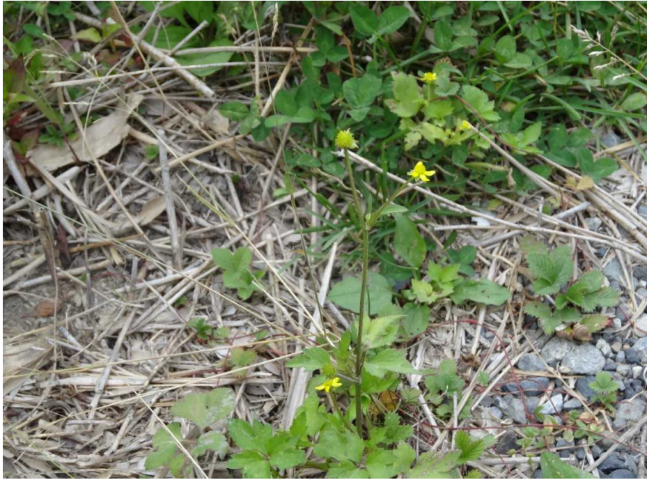
キツネノボタン(狐の牡丹)