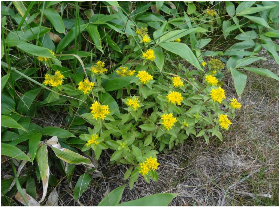
キリンソウ(麒麟草)