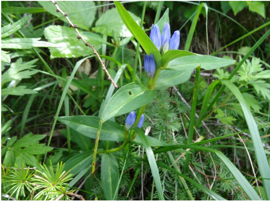
エゾリンドウ(蝦夷竜胆)