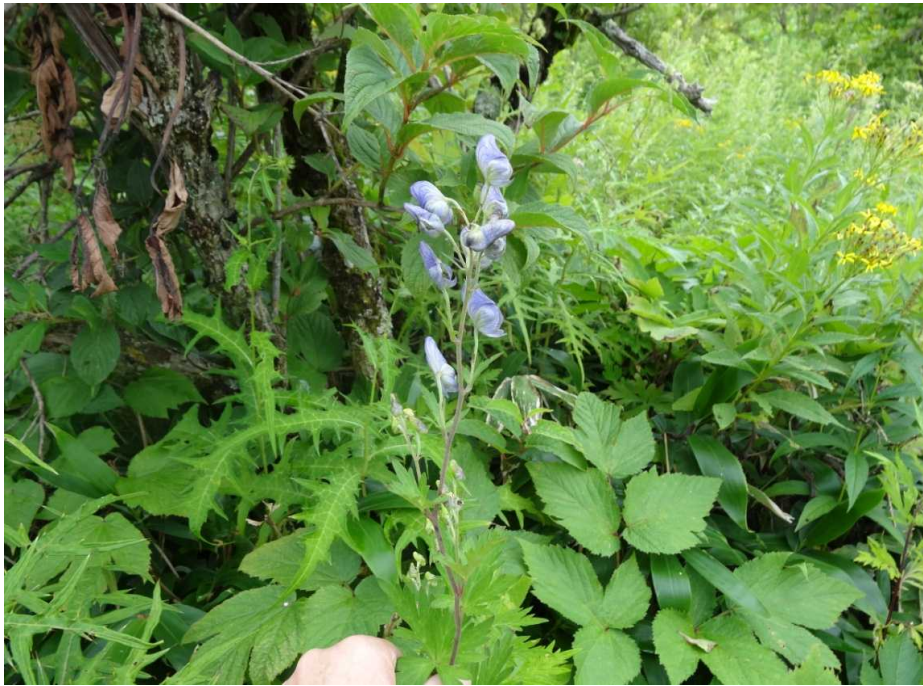
ヤマトリカブト(山鳥兜)