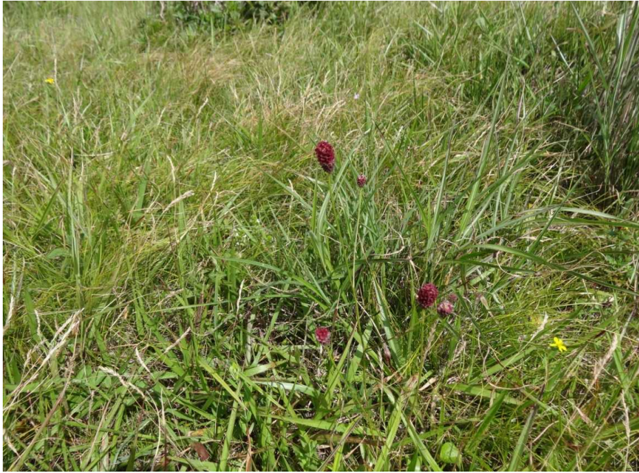
ワレモコウ(吾木香)