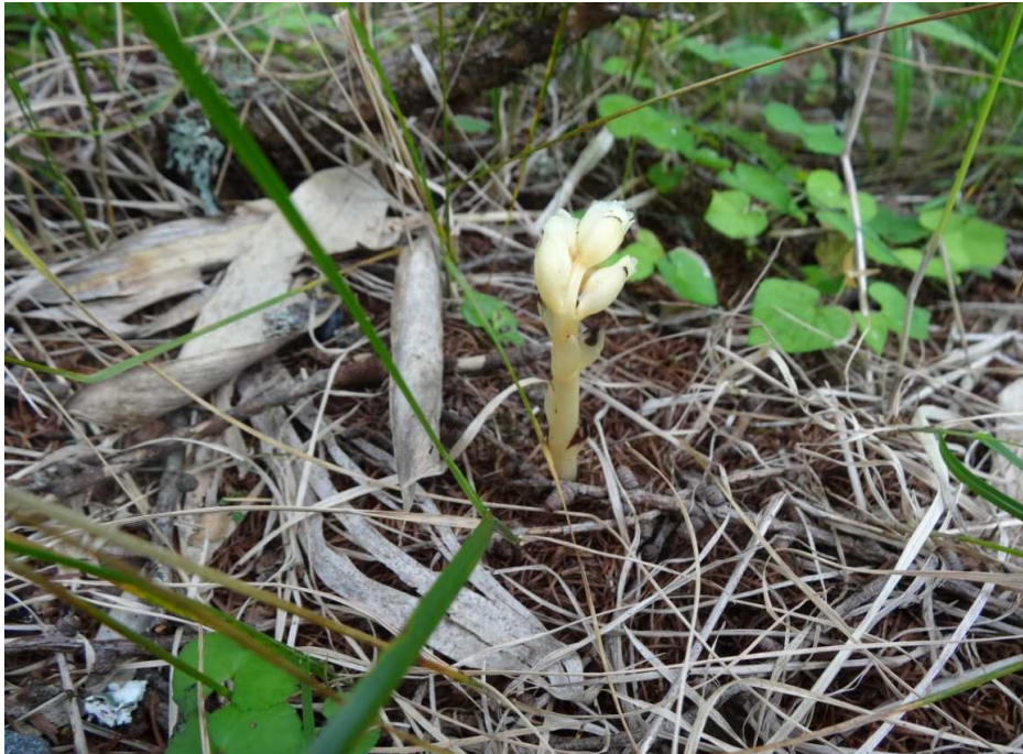
シャクジョウソウ(錫杖草)