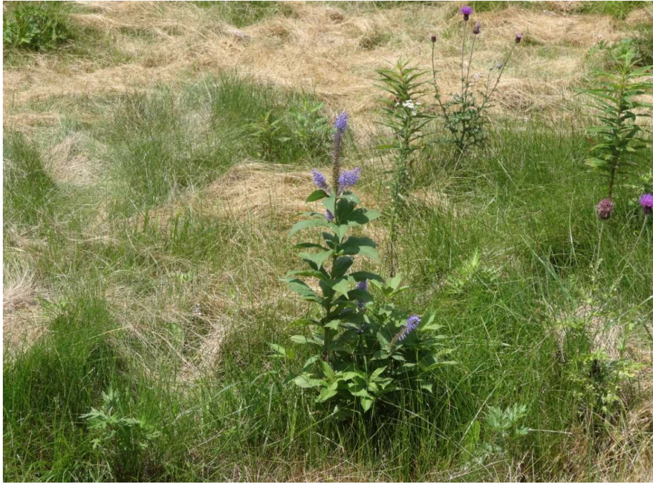
クガイソウ(九蓋草)