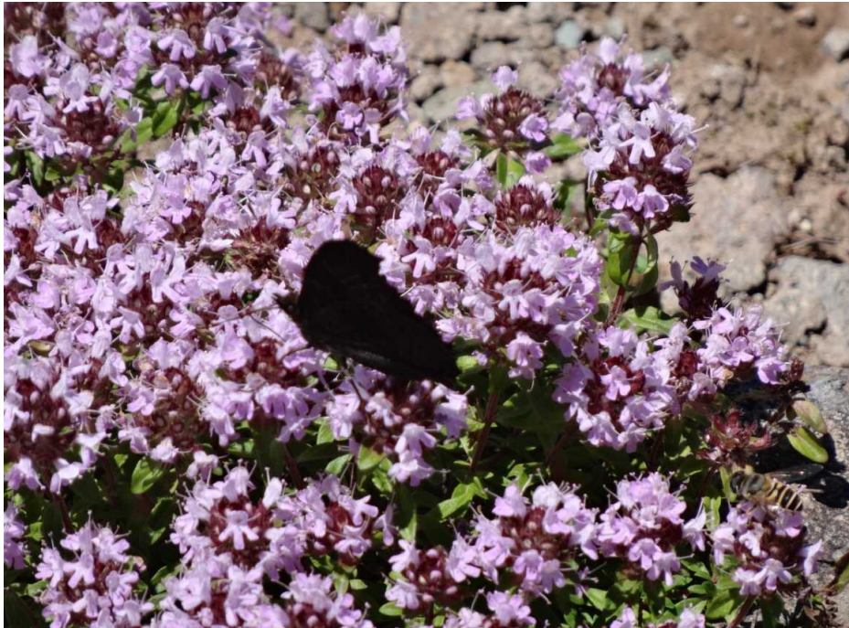
イブキジャコウソウ(伊吹麝香草)