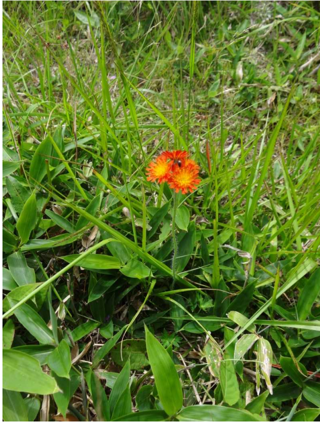
コウリントンポポ(紅輪蒲公英)