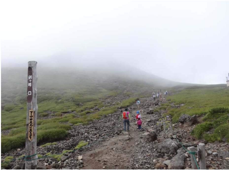
8月23日 剣ヶ峰登山口