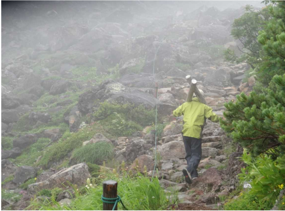
8月31日 杭の取り替え作業