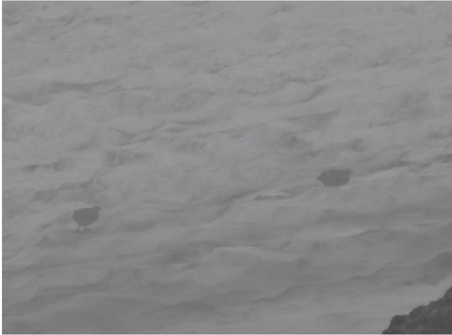
雪溪のライチョウ(雛)