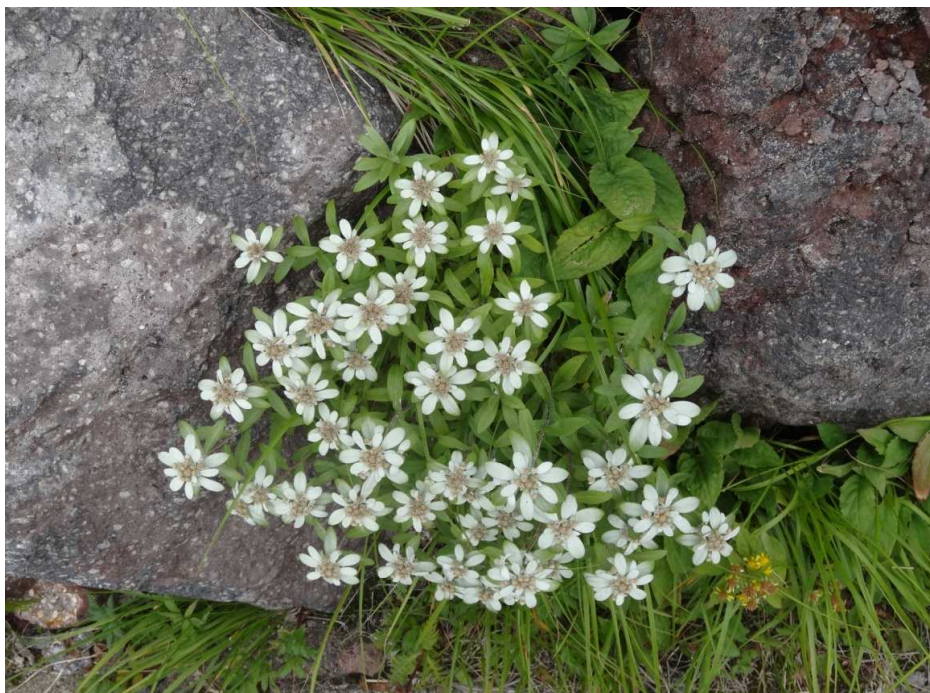
ミネウスユキソウ(峰薄雪草)