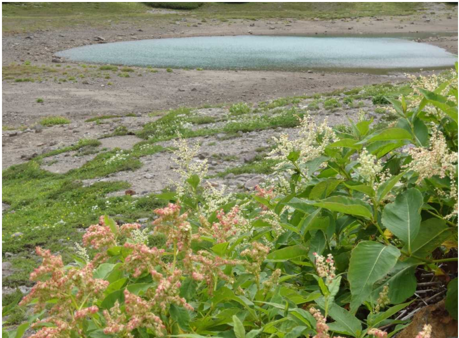
オンダテと鶴ヶ池