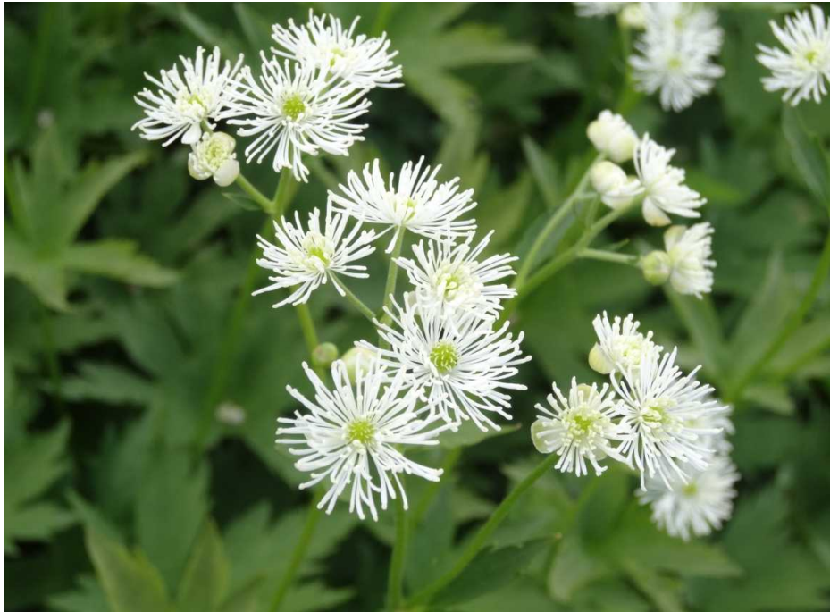
モミジカラマツ(紅葉唐松)