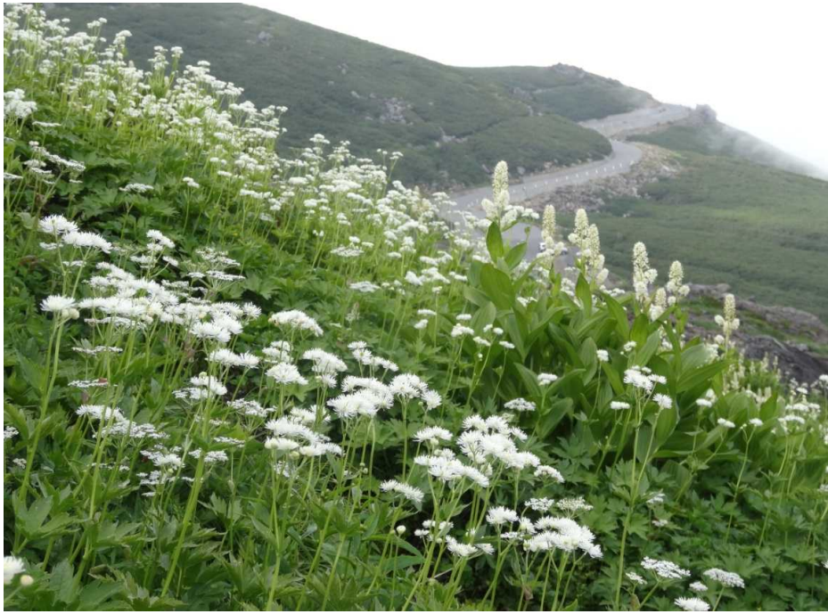
コバイケイソウ(小梅恵草)とモミジカラマツ(紅葉唐松)