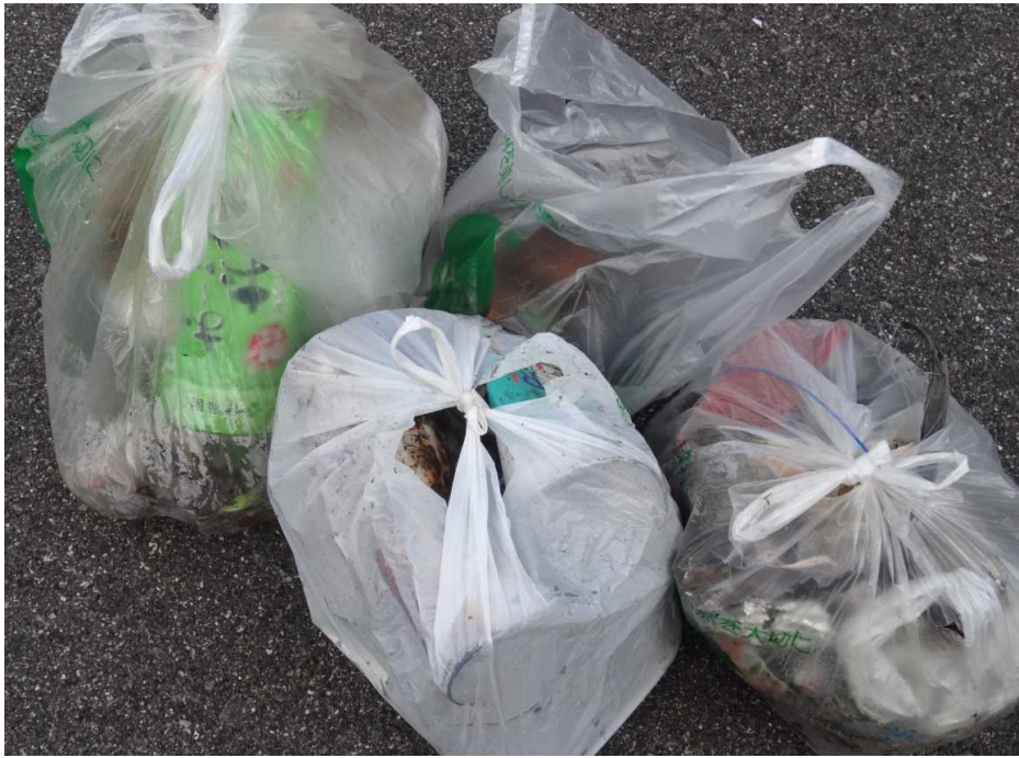
大雪溪での回収ゴミ