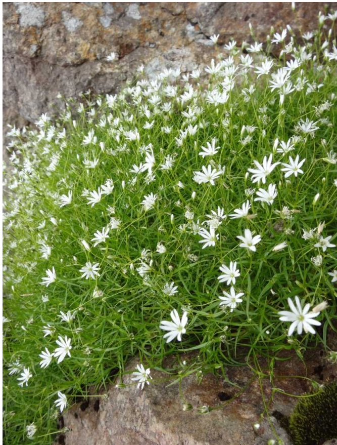
イワツメクサ(岩爪草)