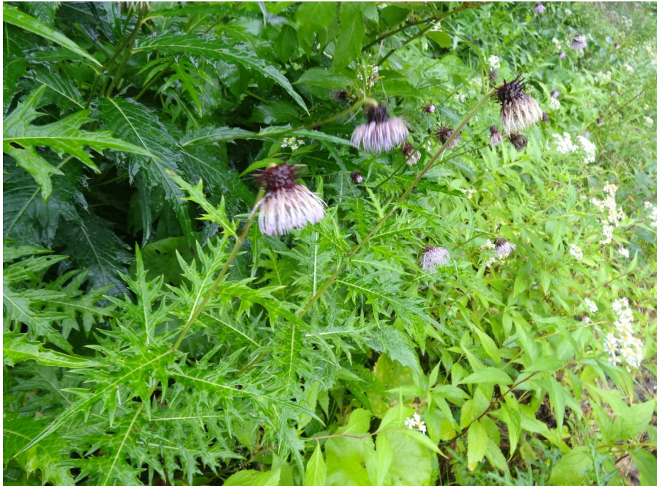
タテヤマアザミ(立山薊)