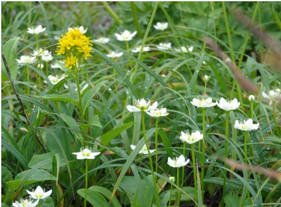
コウメバチソウ(小梅鉢草)