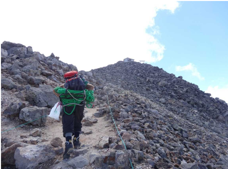
7月24日 ロープ張替のため担いで登山道を上ります。