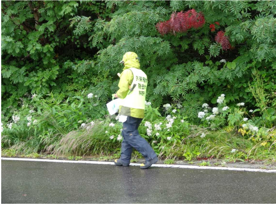
外来植物除去活動(セイヨウタンポポ)