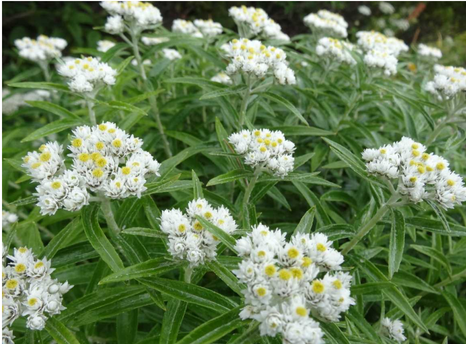
ヤマハハコ(山母子)