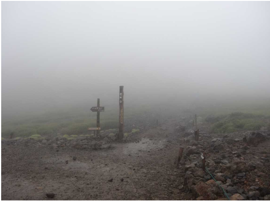
8月21日 剣ヶ峰登山口