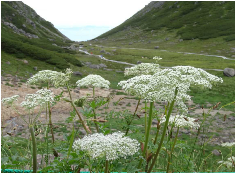
ミヤマゼンゴ(深山前胡)