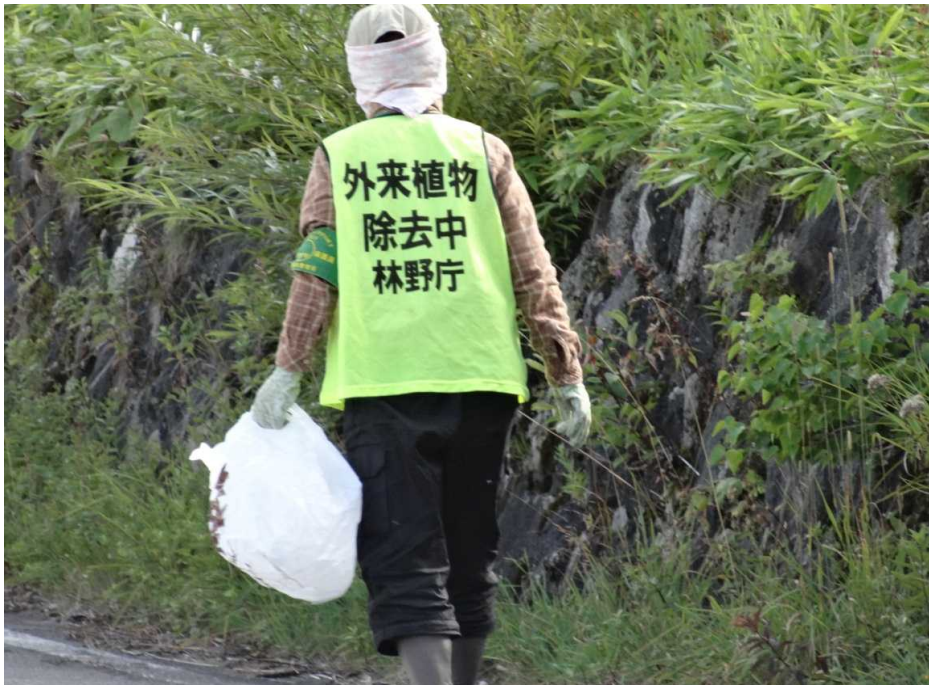
三本滝ゲート上のアラゲハンゴンソウ(外来植物)の除去