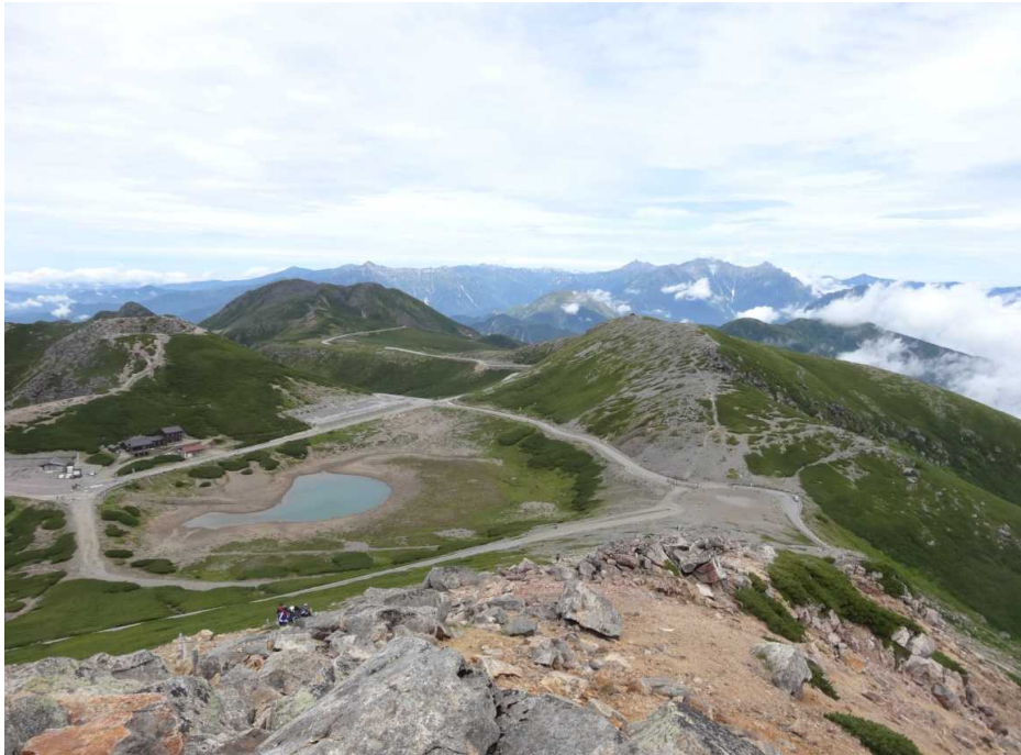
富士見より鶴ヶ池方面