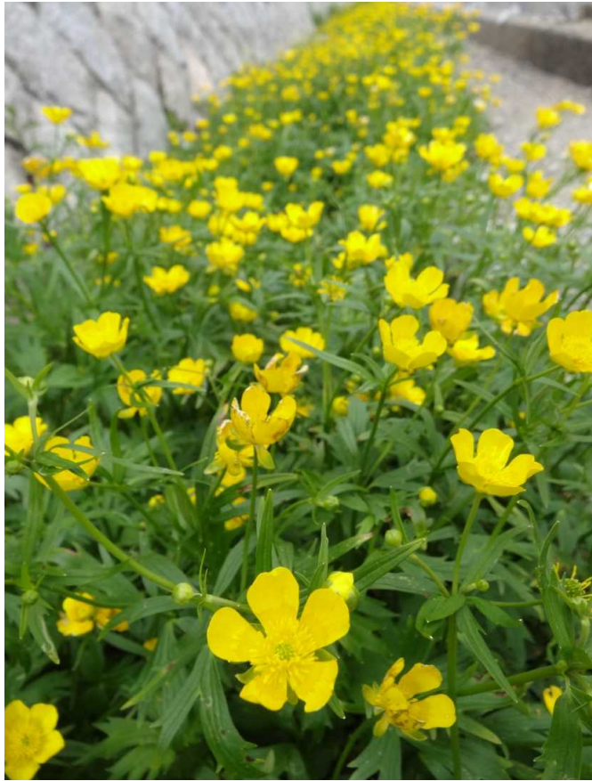
ミヤマキンポウゲ(深山金鳳花)