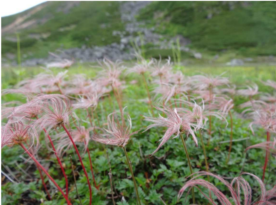
チングルマ(稚児車)