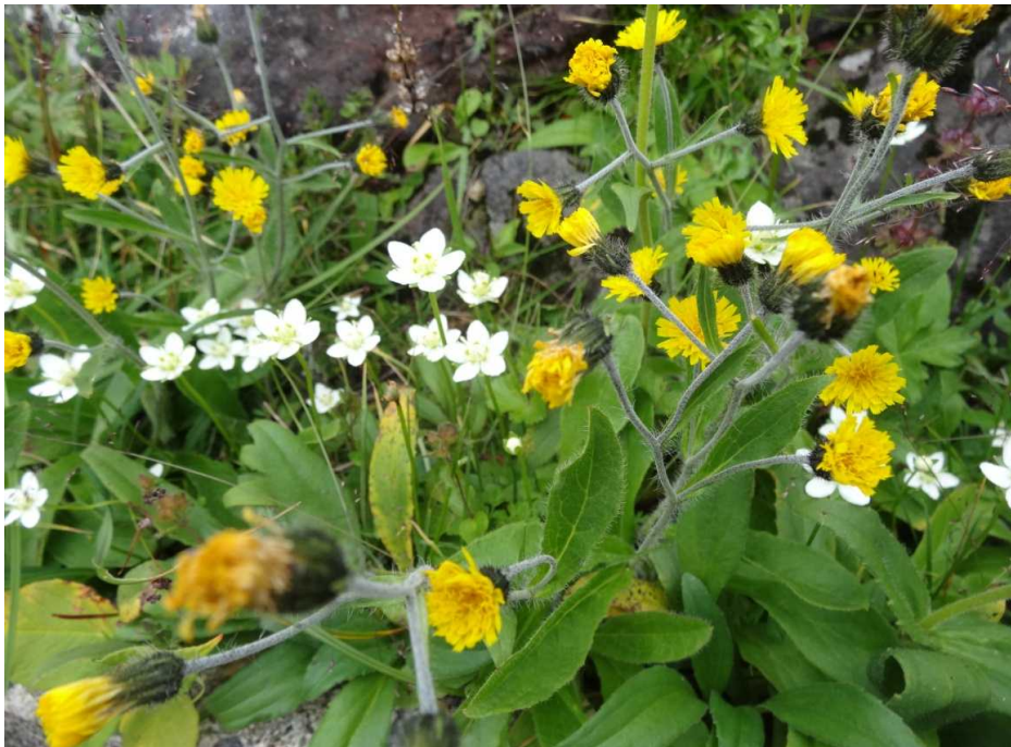
ミヤマコウゾウリナ(深山髭荊菜)