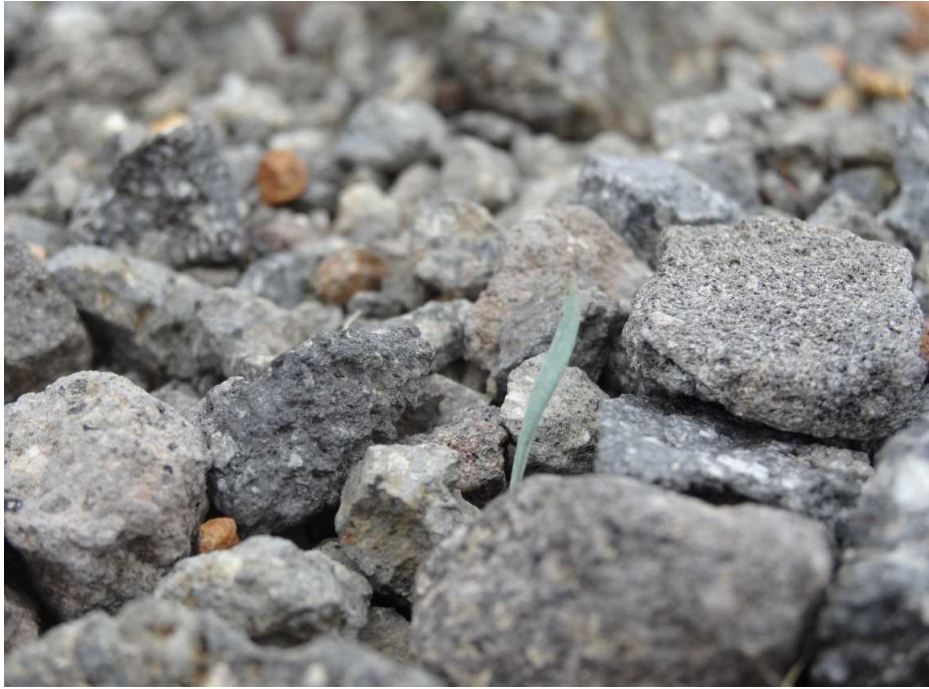
コマクサの双葉(単子葉)