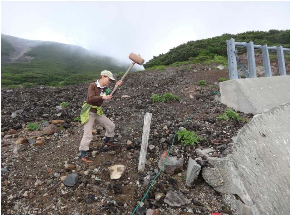
8月5日 県道4号カーブでのロープ張り