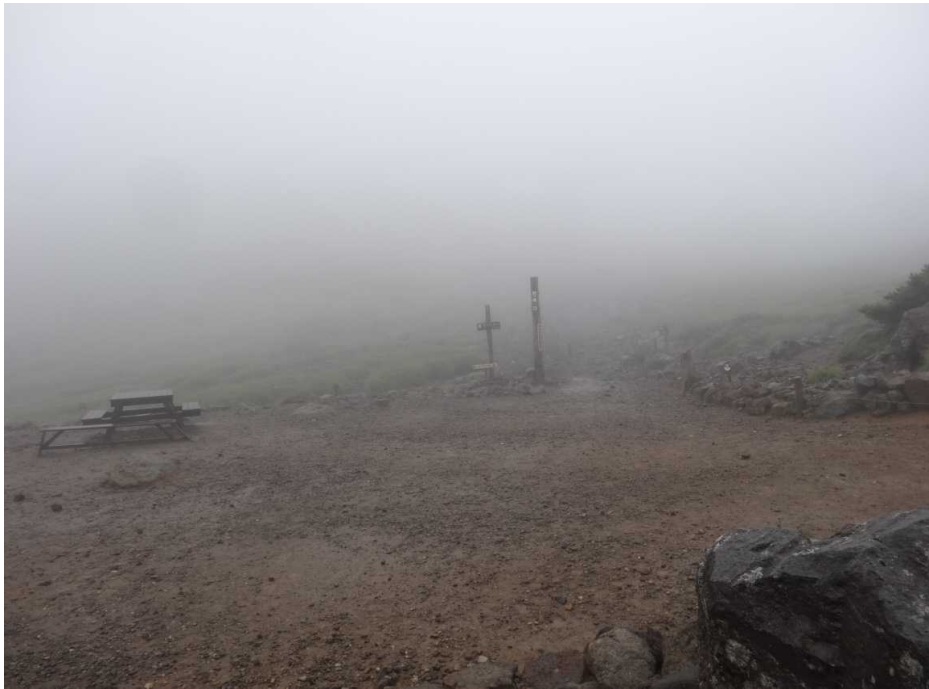
8月13日 人気の無い剣ヶ峰口