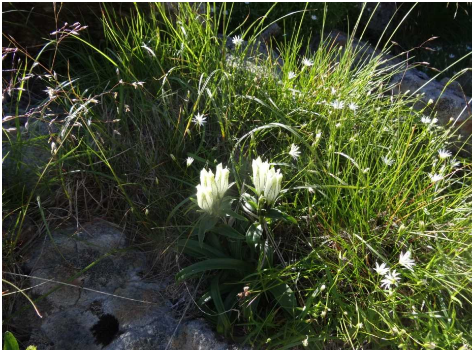
トウヤクリンドウ(当薬竜胆)