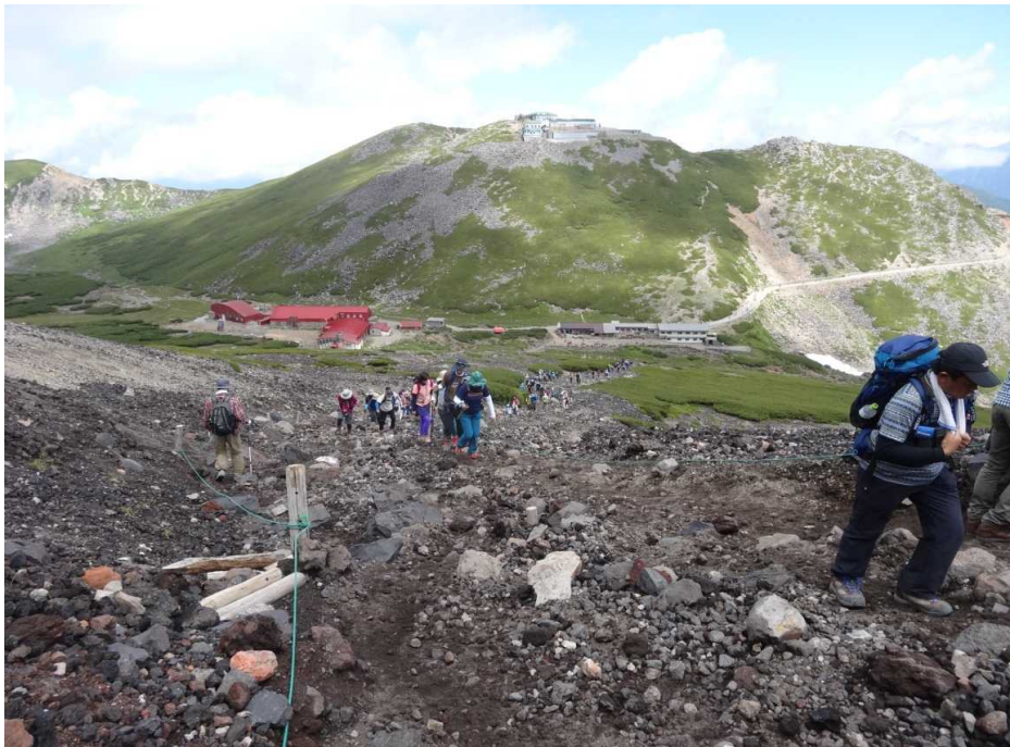
頂上を目指す登山客