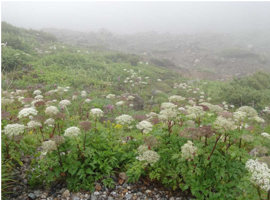
ミヤマゼンゴ(深山前胡)