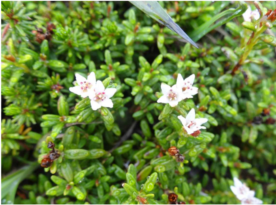
ミネズオウ(峰蘇芳)