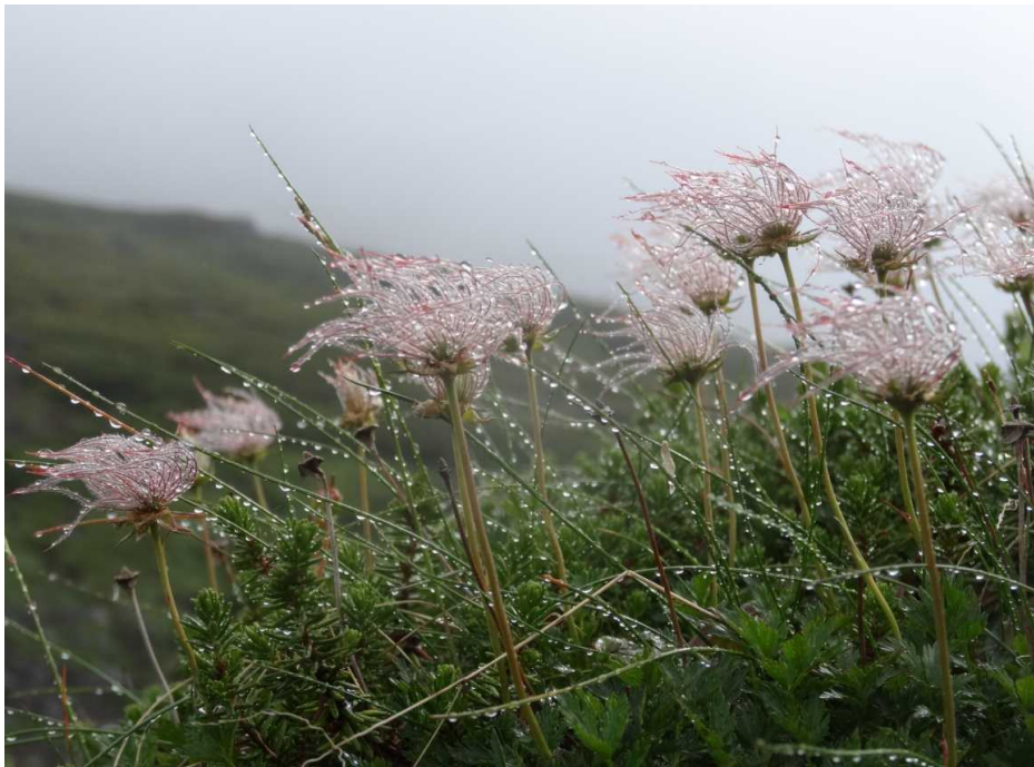
チングルマ(花が終わった後に羽毛状になる)