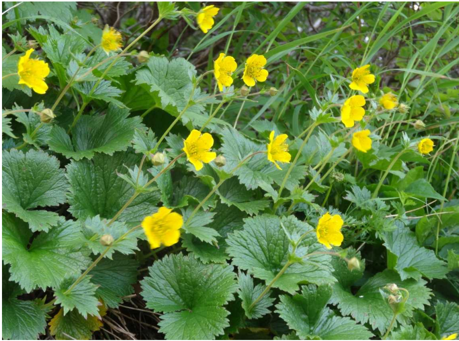
ミヤマダイコンソウ(深山大根草)