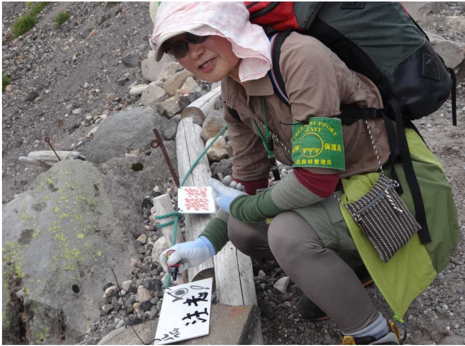
8月3日 看板の書き直し