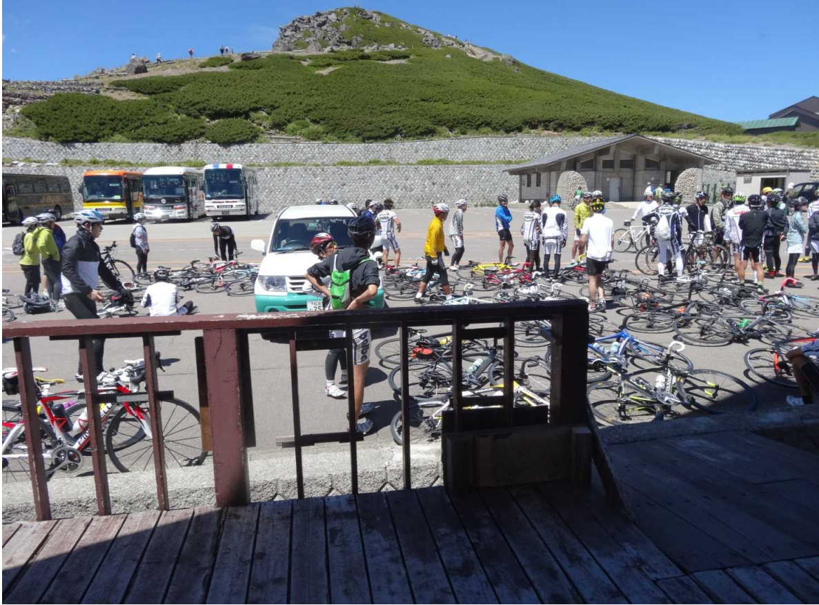
サイクリストでにぎわう畳平駐車場