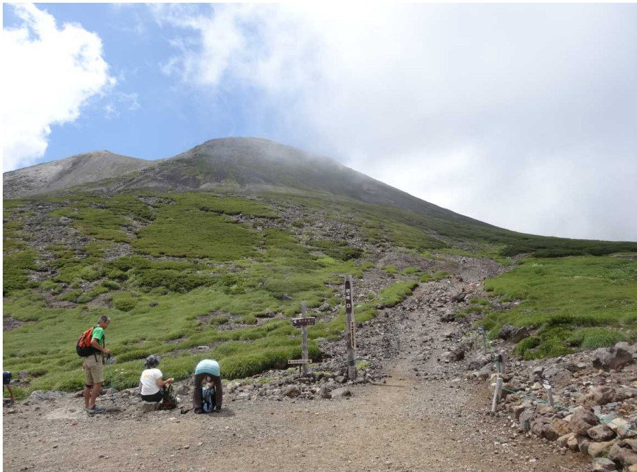
剣ヶ峰登山道入口