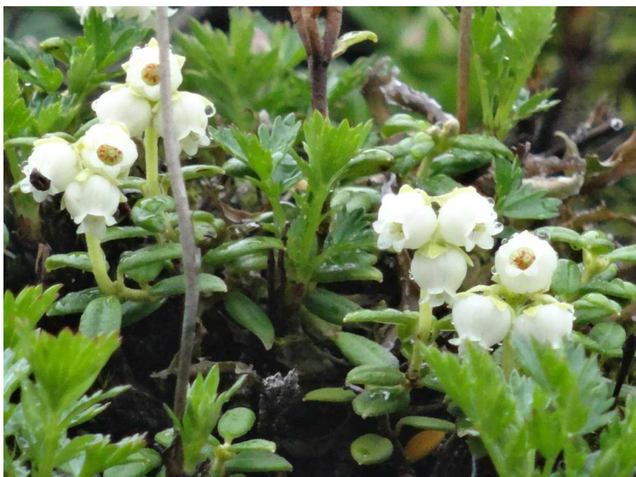
アオノツガザクラ(青の梅桜)