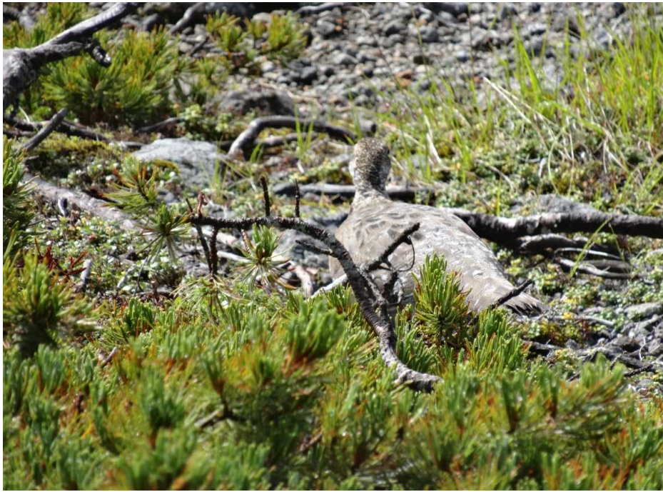
8月14日 ライチョウを目撃しました。