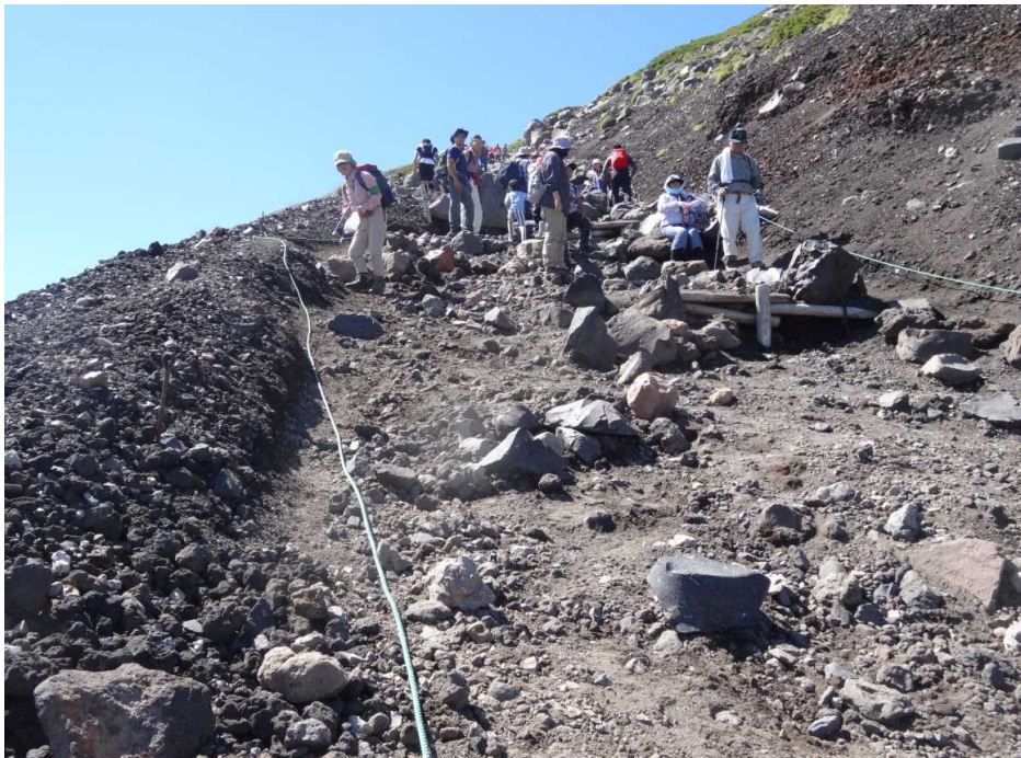
登山道(足元に注意！転石に注意！)