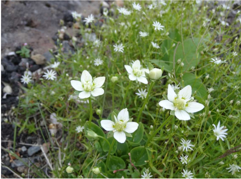
コウメバチソウ(小梅鉢草)