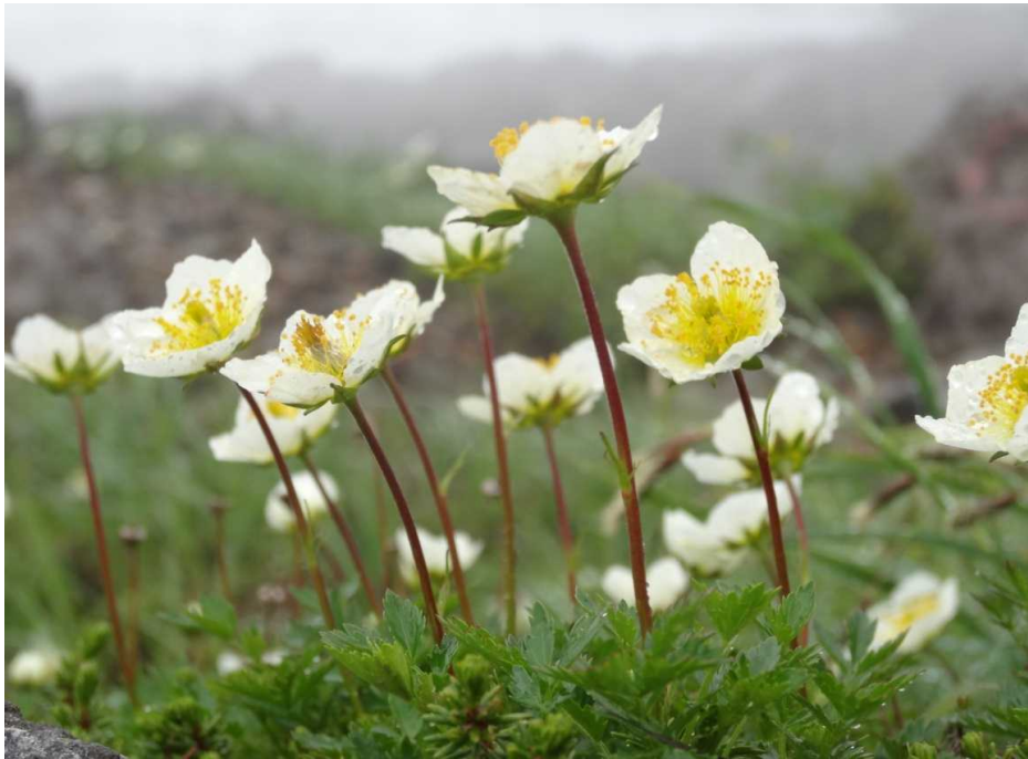
チングルマ(稚児車)