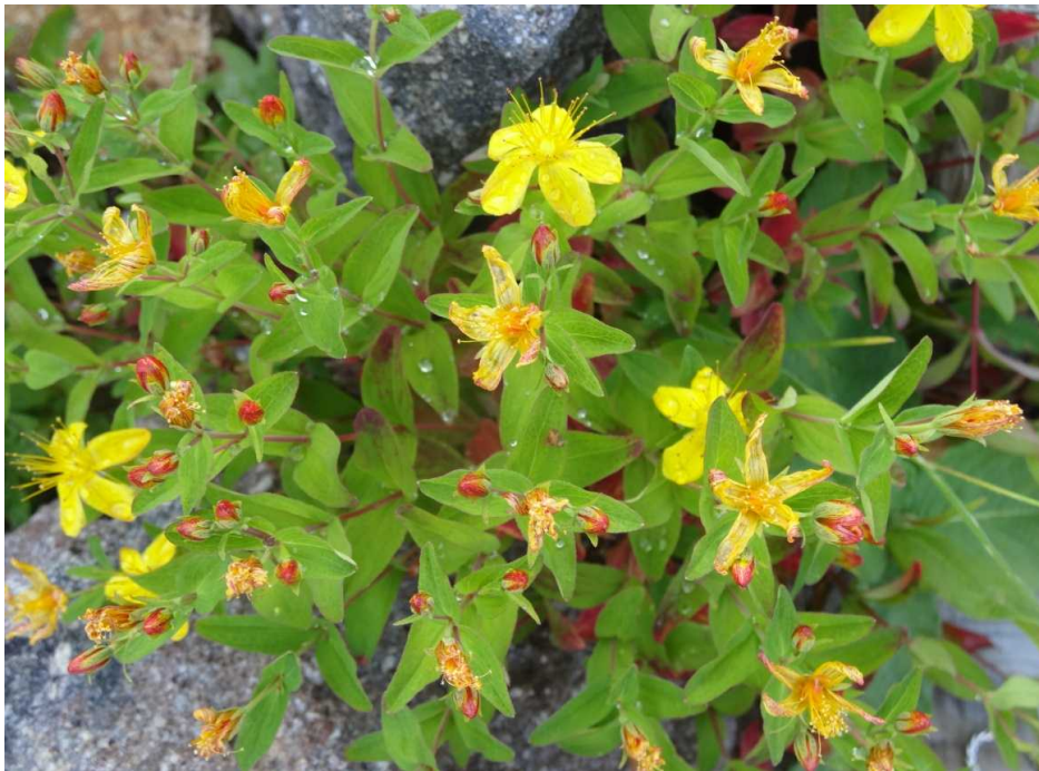
シナノオトギリ(信濃弟切)