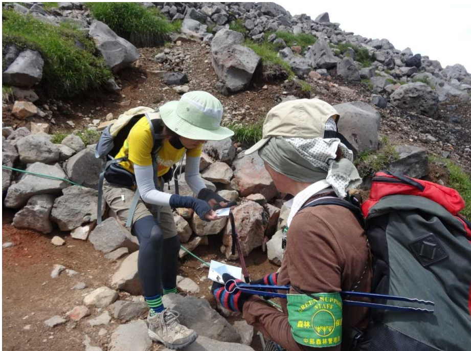
トレーディングカードを配布して登山マナーの啓発活動を行っています。