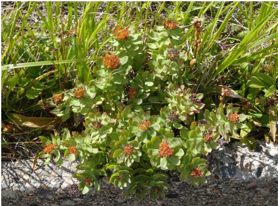
イワベンケイ(岩弁慶)