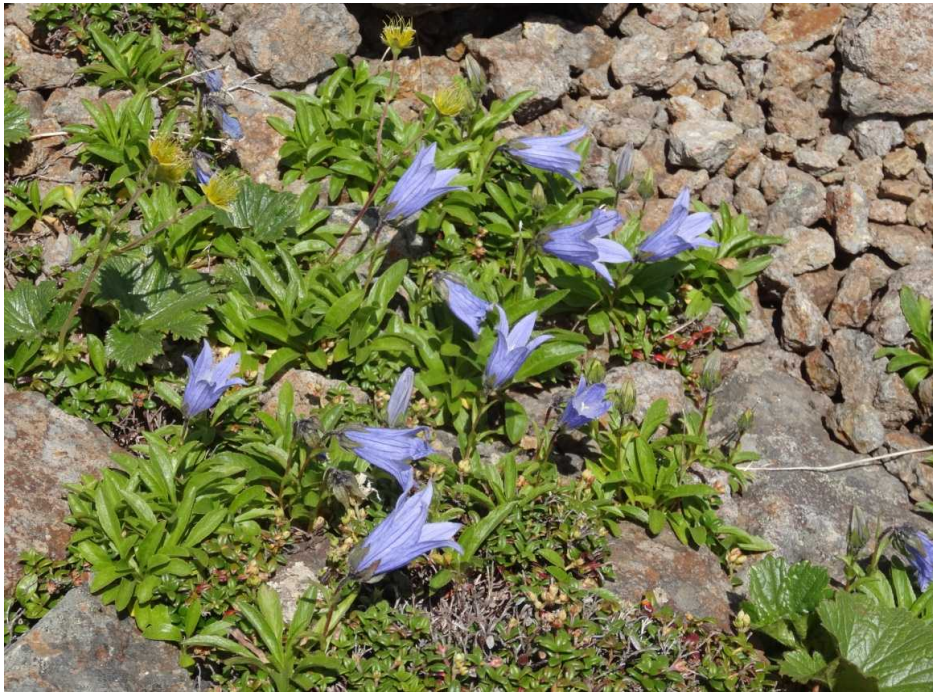
チシマギキョウ(千島桔梗)