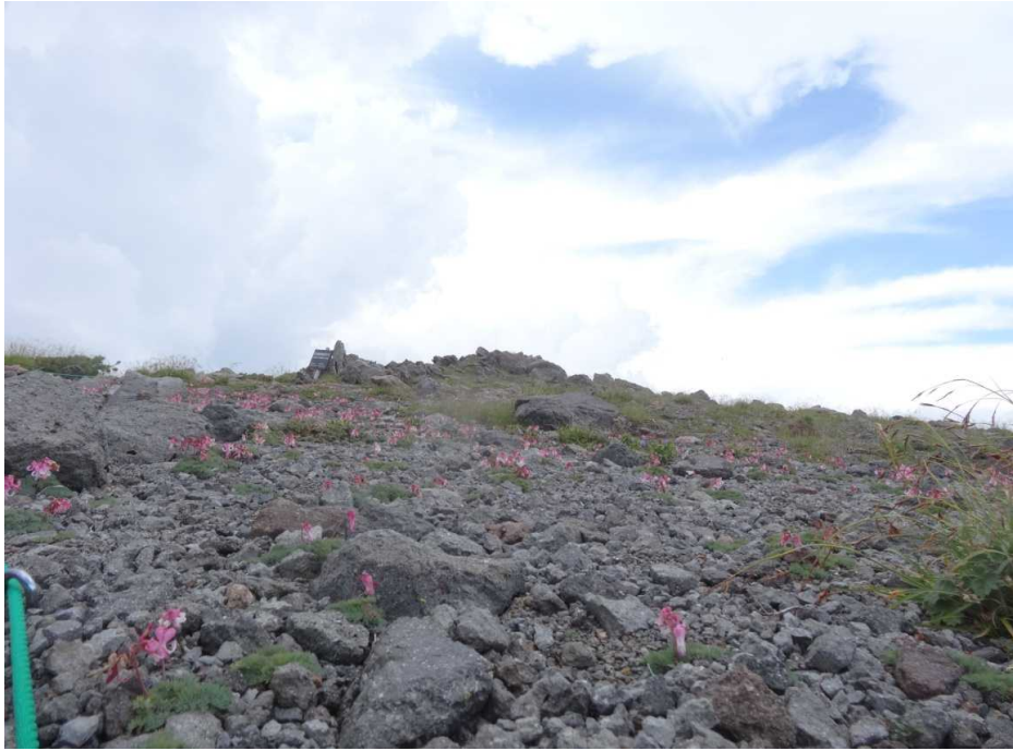
大黒新道のコマクサ群