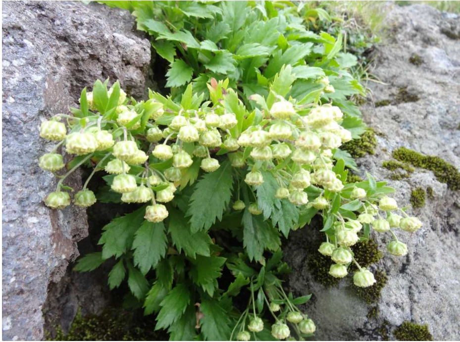
ミヤマオトコヨモギ(深山男蓬)