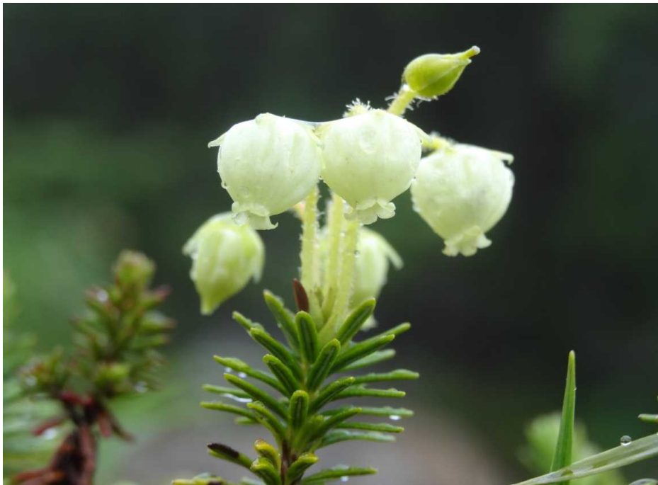
アオノツガザクラ(青の梅桜)