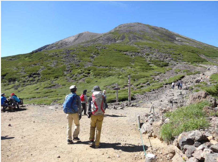
8月9日 剣ヶ峰を目指す登山者