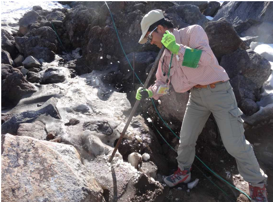
大雪溪登山道整備