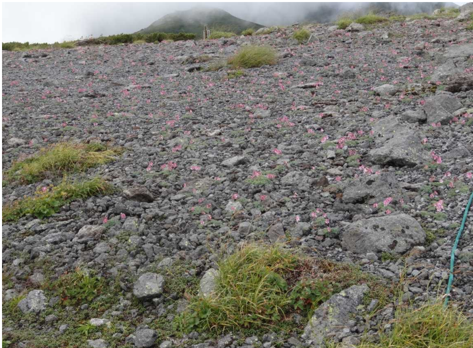
大黒岳のコマクサ群