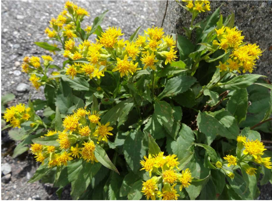
ミヤマアキノキリンソウ(深山秋の麒麟草)