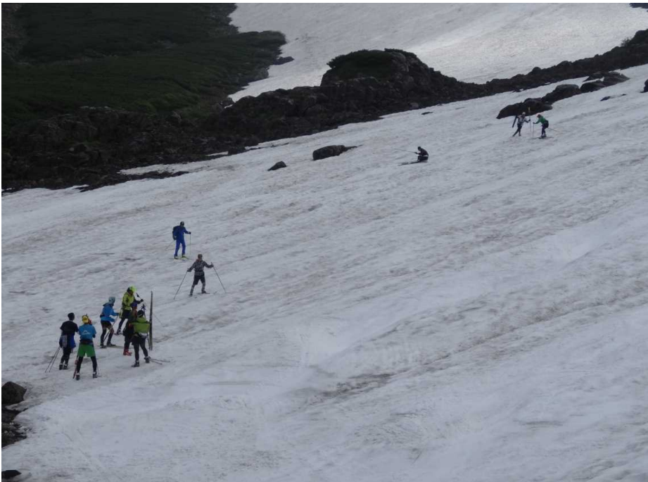
大雪渓でのスキーヤー