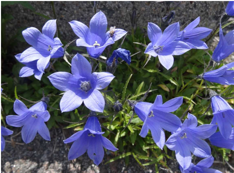
イワギキョウ(岩桔梗)