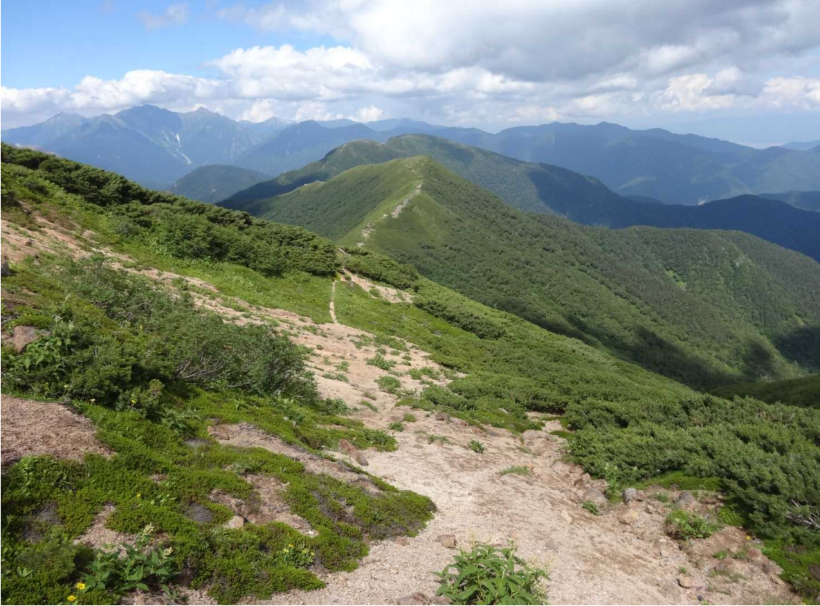
硫黄岳方面を望む