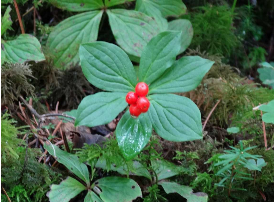
8月27日 ゴゼンタチバナ(御前橘)の実