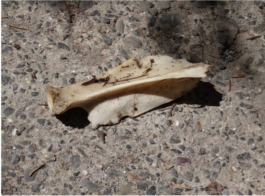
動物の骨が落ちていました。(新村橋左岸橋脚下部)