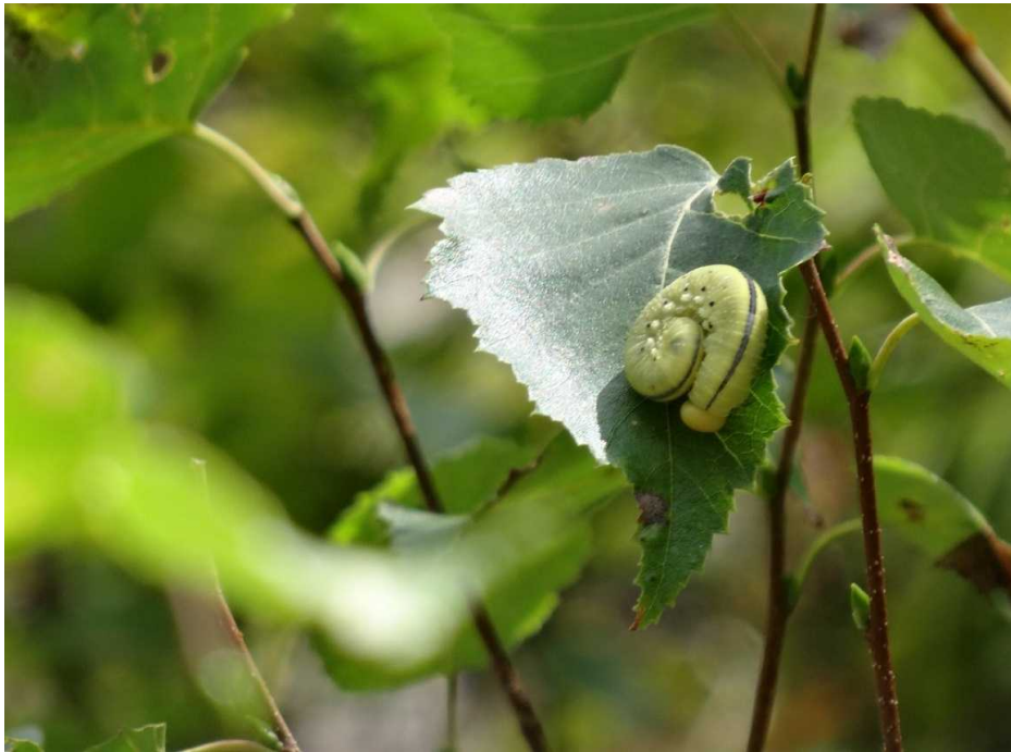
ダケカンバにイモムシ