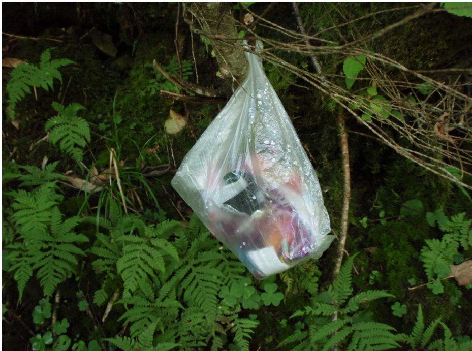
スーパーレジ袋に入れたプラゴミ袋が投棄されていました。