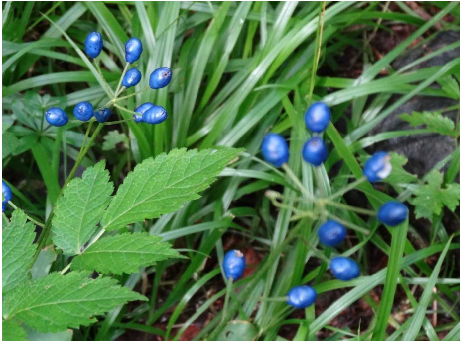
ツバメオモトの実