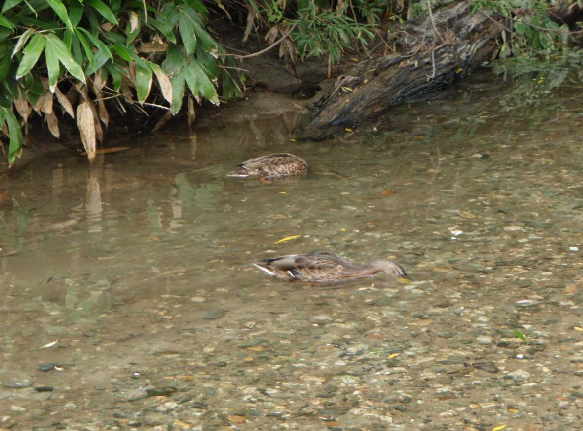
カモが2羽餌を探しながら遊泳中