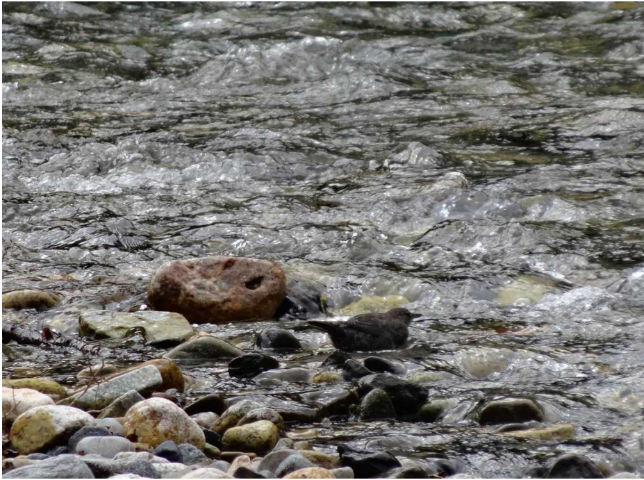
8月19日 河童橋下流にカワガラス