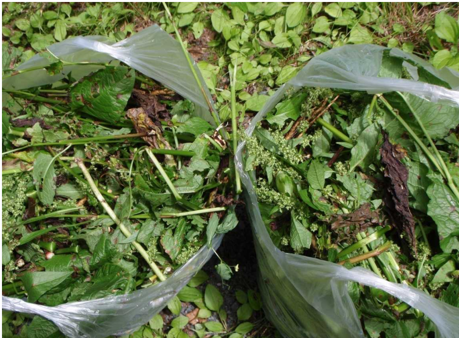
駆除した量は4Kgにもなりました。