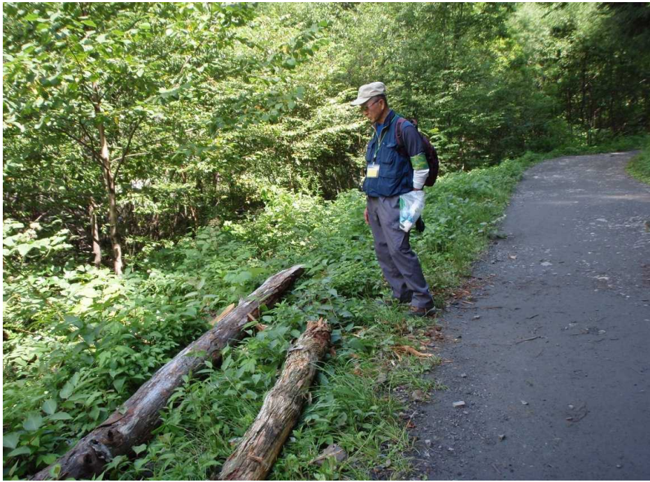
8月23日 横尾下流、大崩付近の歩道上部(山側)より倒木が発生した模様。 この所の雨天続きで湿り倒れたか？ 通路脇に処理されていました。