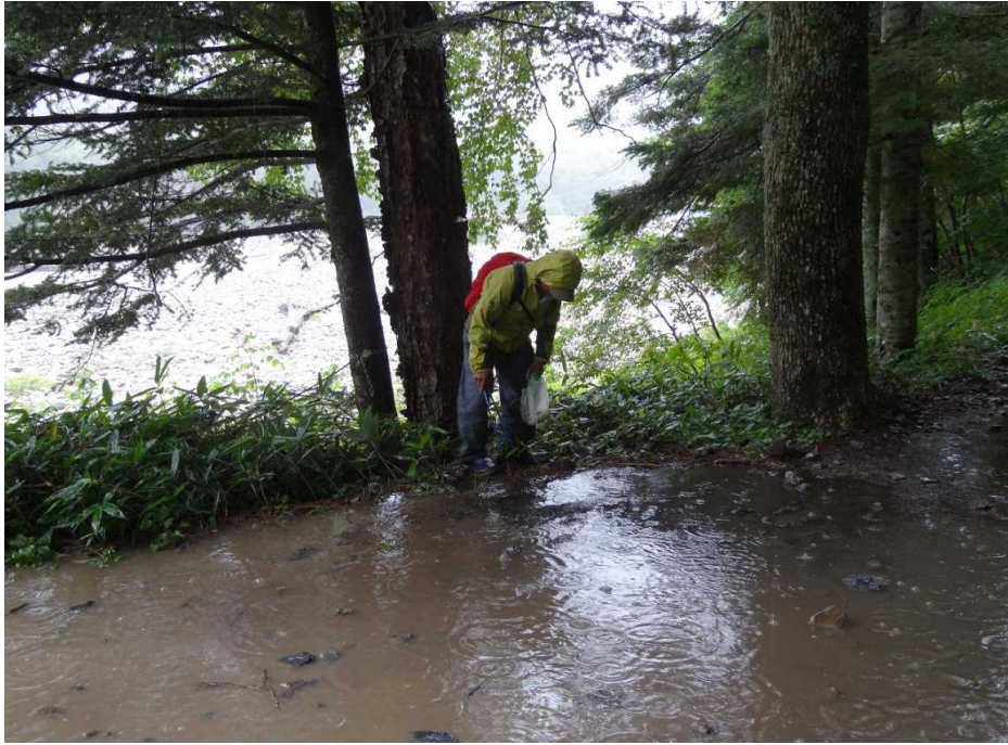
8月17日 下又白沢にて大出水有り、通行に困難を要する。