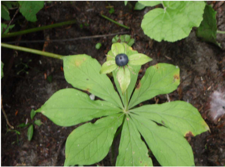
クルマバツクバネソウ(車葉衝羽根草)の実