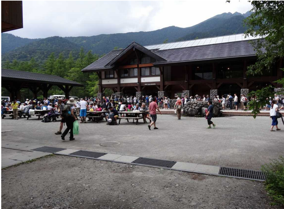
バスターミナルの混雑状況