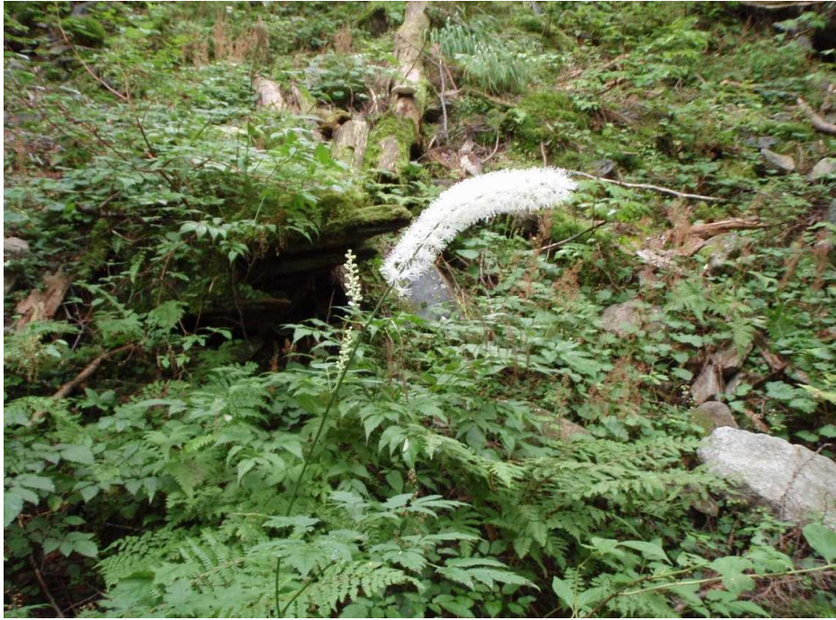
8月25日 サラシナショウマ(晒菜升麻)