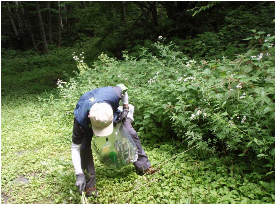
エゾノギシギシ(外来植物)の除去活動(明神橋右岸にて)