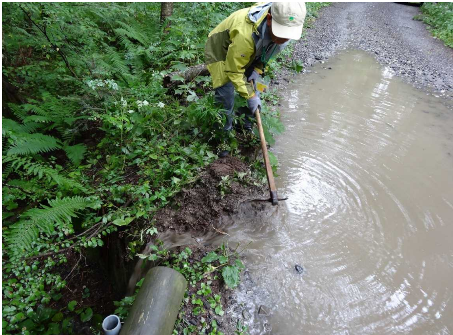
明神～新村間の大きな水たまりの水切り