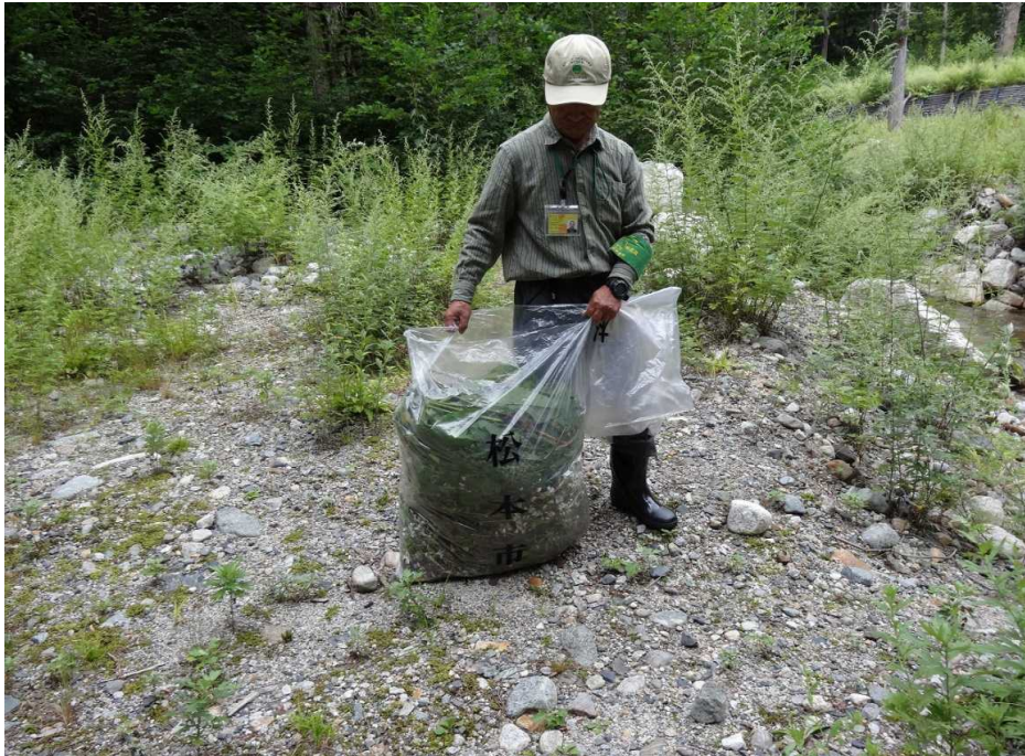
善六沢の外来植物除去12Kg (ヒメジオン、ムシトリナデシコ、チモシー、エゾノギシギシ)