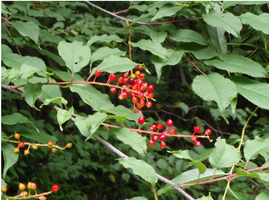
ウワミズザクラの実