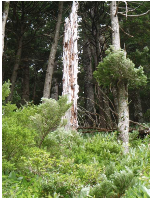
8月31日 新村橋横尾間の危険木倒し