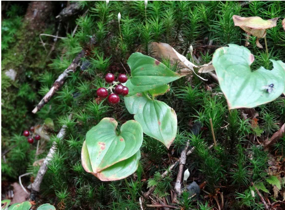
マイヅルソウ(舞鶴草)の実