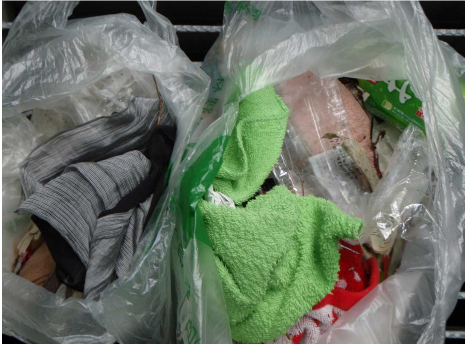
ゴミの投棄が多いです。 (汗をぬぐった後のタオル類の落とし物が目立ちます)