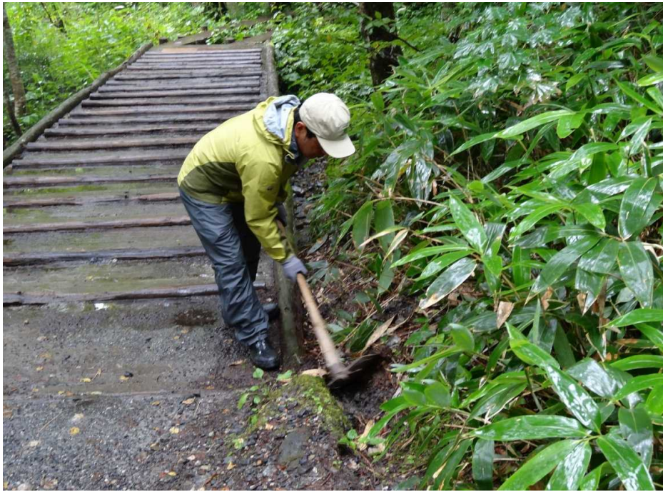
8月29日 木道に土砂が入らないよう水切り