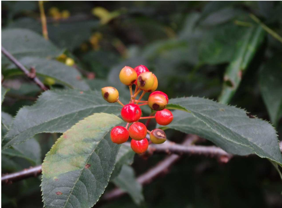
色づき始めたシウリザクラの実