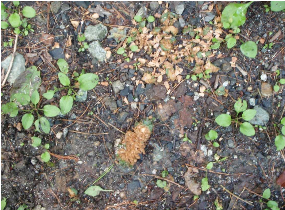
キタゴヨウ松ぼっくり(サルが食した後)