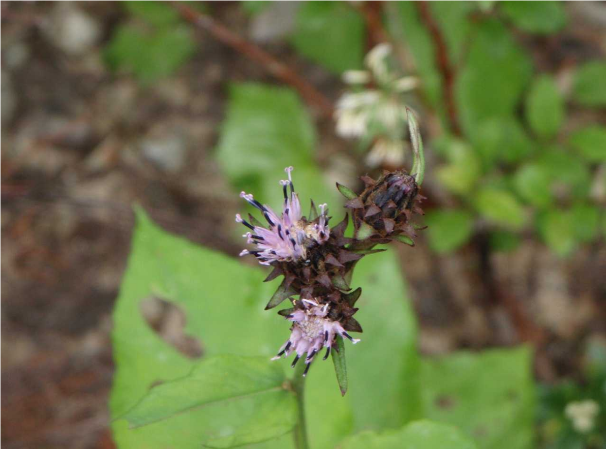
8月4日 クロトウヒレン(黒唐飛廉)