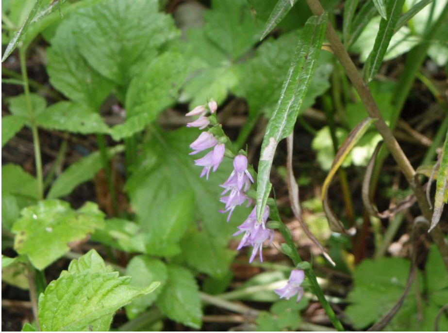
8月7日 ミヤマモジズリ(深山掬摺)