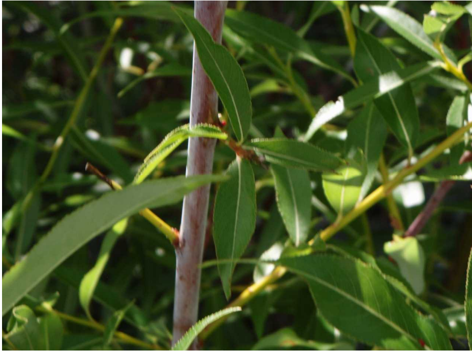
ケシウヤナギの化粧の幹