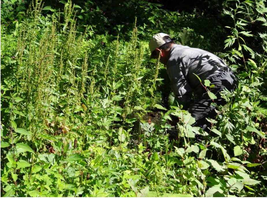
8月1日 外来植物のエゾノギシギシを焼岳口で除去しました。(3. 5kg)