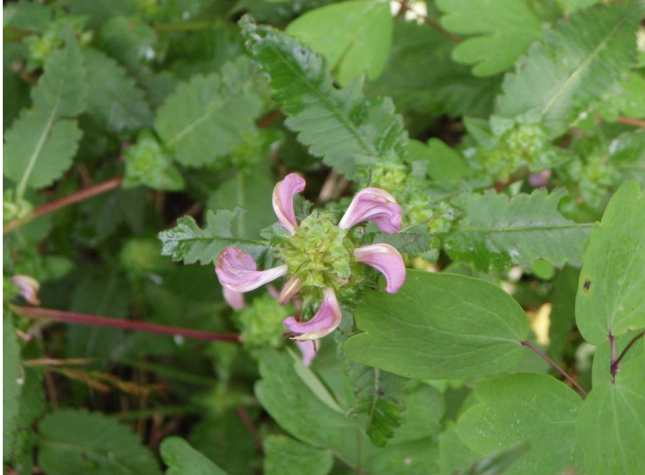
トモエシオガマ(巴塩竈)