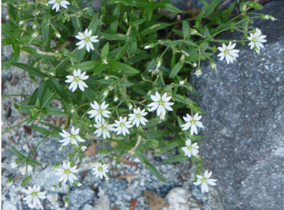
イワツメクサ(岩爪草)