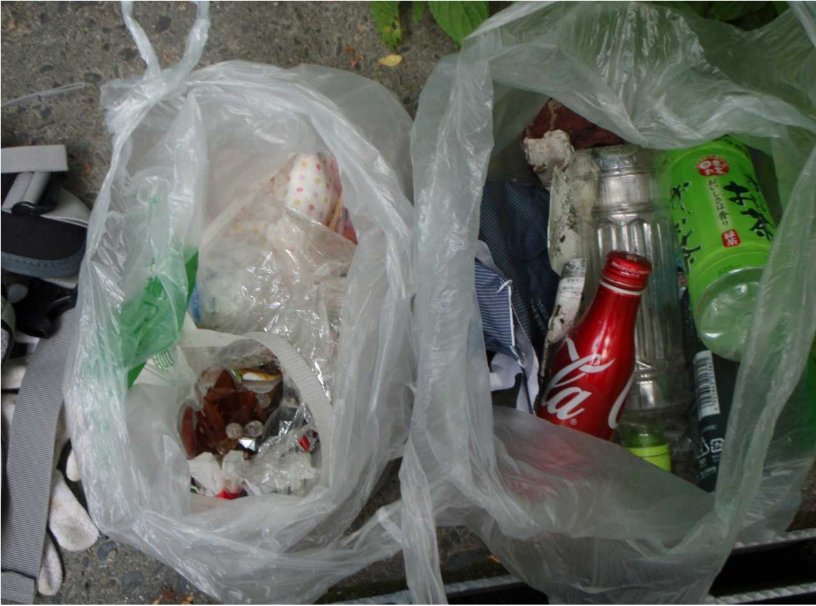
8月5日 ペットボトルが木道の下や筐の中に複数捨てられていました。