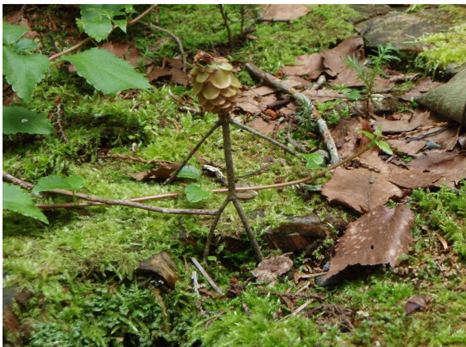
8月7日 松ぼっくりと木の枝で人形オブジェ2体 あまりの出来の良さに、登山者、歩行者、ほほえんで見て行きました。 (癒やされます)