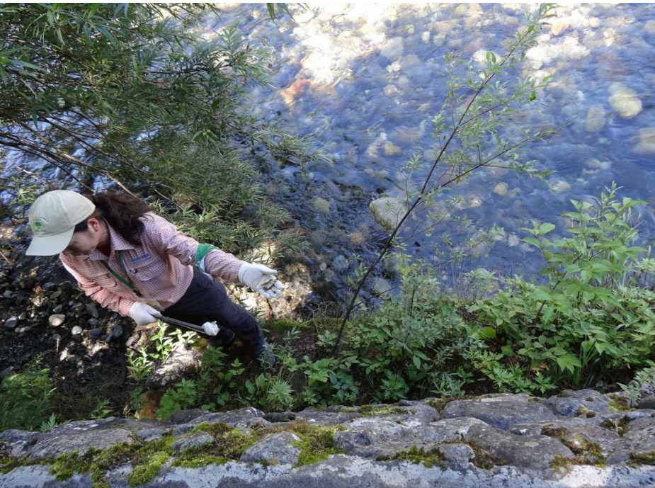
8月2日 徳沢出先にて河原への吸い殻ゴミの投棄が有りました。