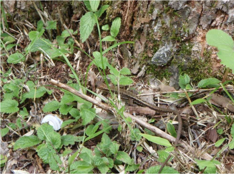
カナヘビがいました。(明神にて)