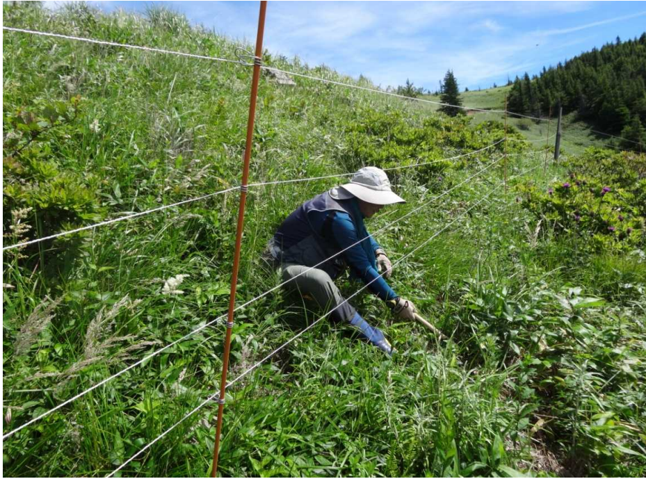
7月26日 電気柵の草刈り