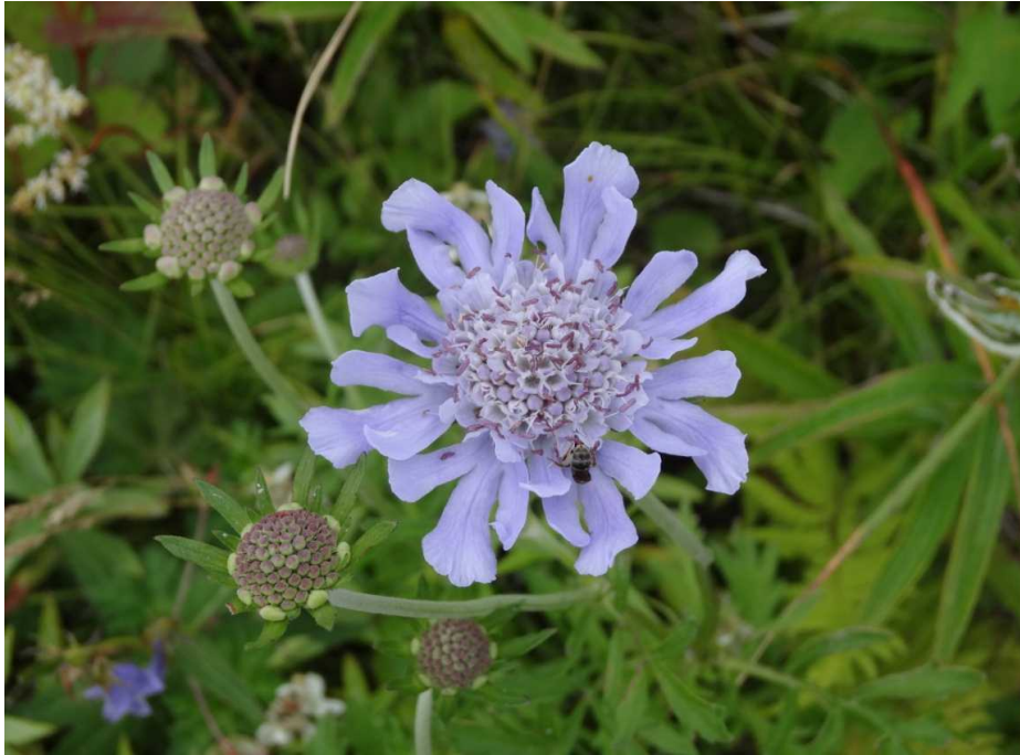
マツムシソウ(松虫草)