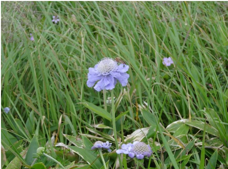
マツムシソウ(松虫草)