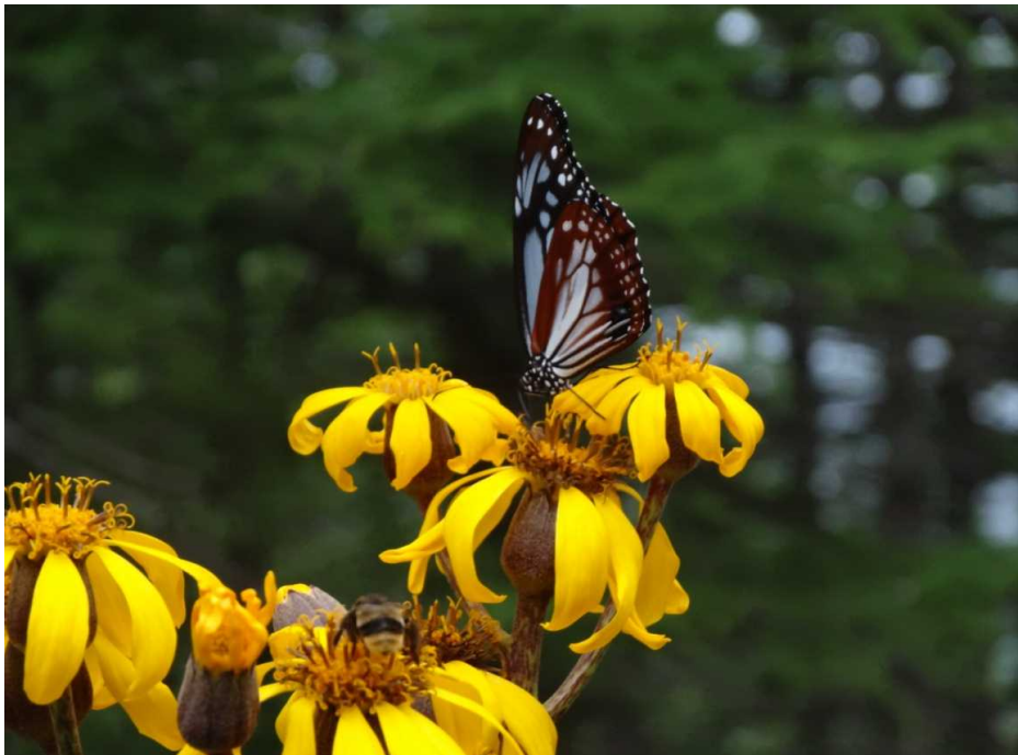
マルバダケブキ(丸葉岳蓐)とアサギマダラ