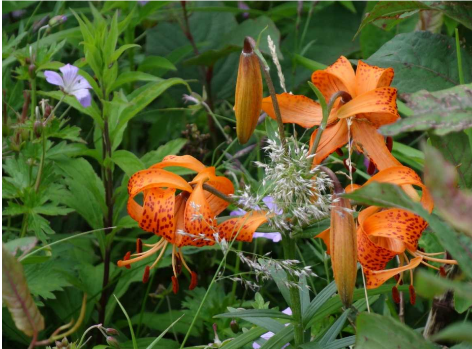
コオニユリ(小鬼百合)