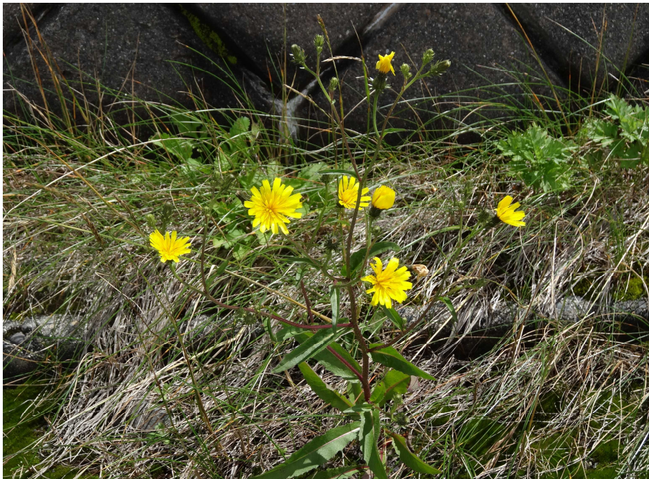
カンチコウゾウリナ(寒地毛蓮菜)