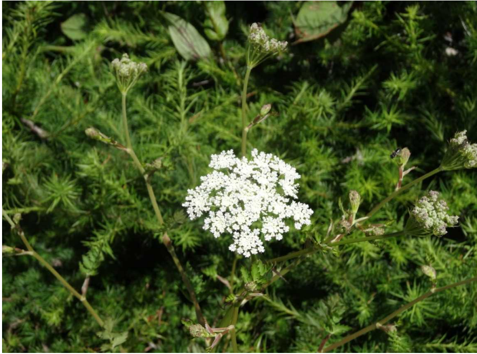
イブキボウフウ(伊吹防風)