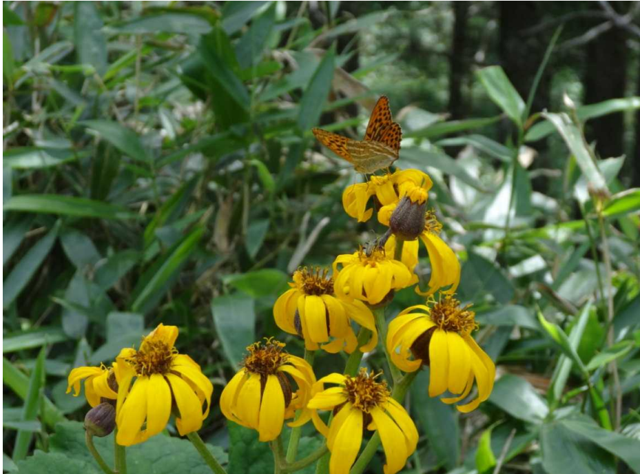
マルバダケブキ(丸葉岳蓐)