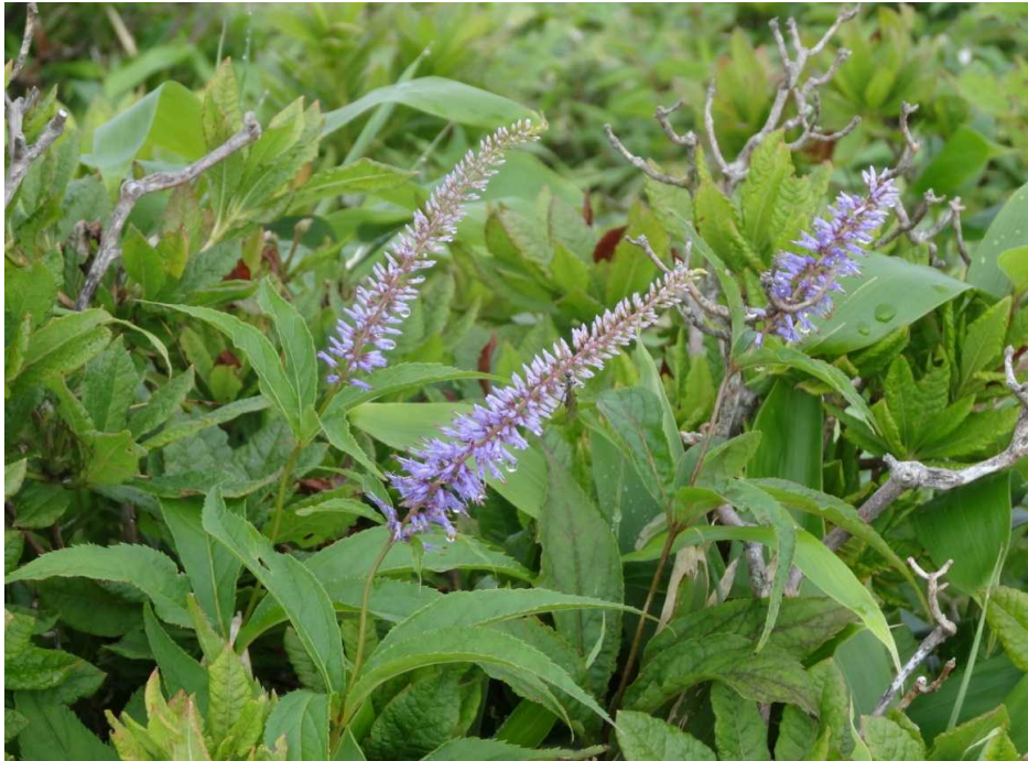
ヤマトラノオ(山虎の尾)