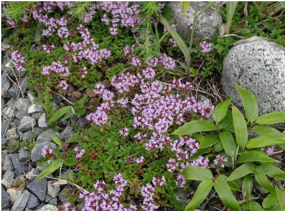
イブキジャコウソウ(伊吹麝香草)