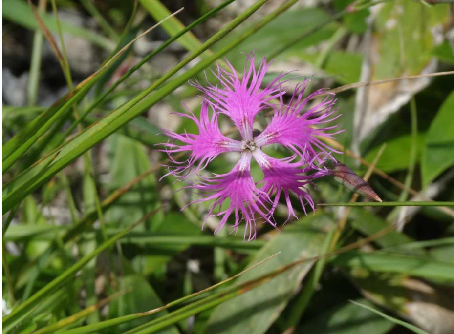
エゾカワラナデシコ(蝦夷河原撫子)