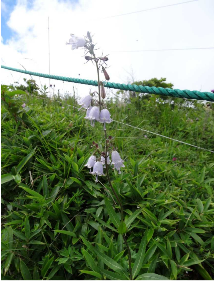
ツリガネニンジン(釣鐘人参)