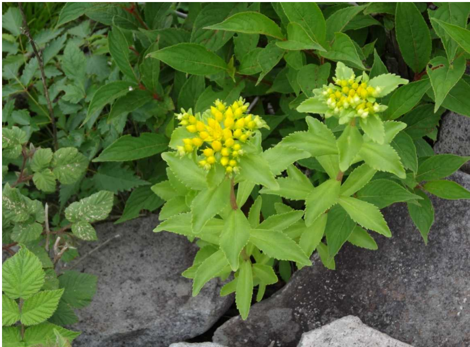
キリンソウ(麒麟草)