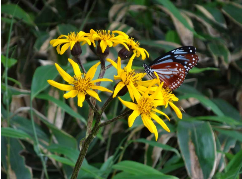
マルバダケブキ(丸葉岳蓼)とアサギマダラ