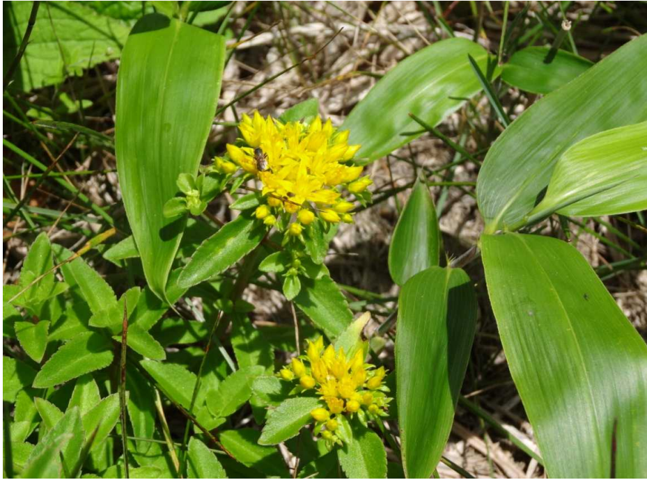
ホソバノキリンソウ(細葉の麒麟草)