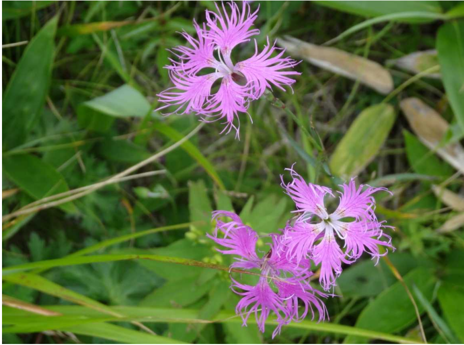
エゾカワラナデシコ(蝦夷河原撫子)