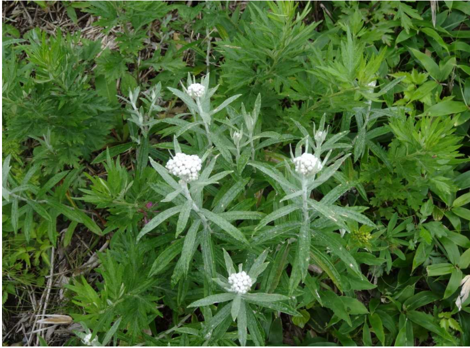
ウスユキソウ(薄雪草)