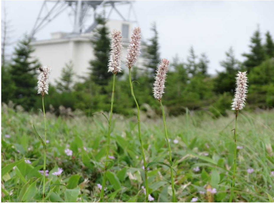
イブキトラノオ(伊吹虎の尾)