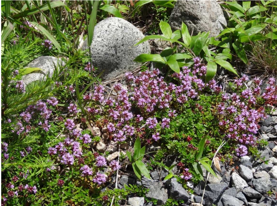
イブキジャコウソウ(伊吹麝香草)