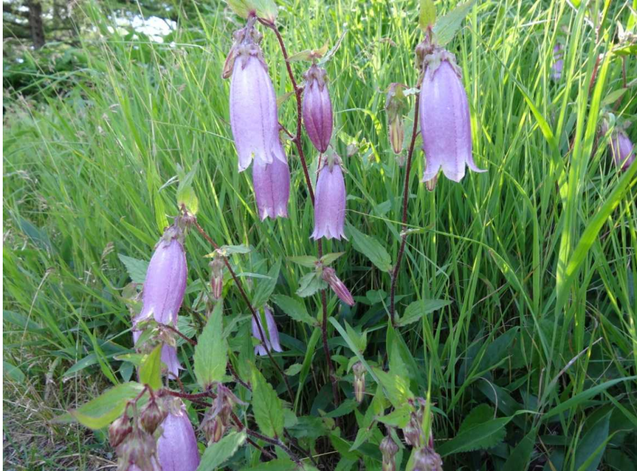
ヤマホタルブクロ(山蛍袋)