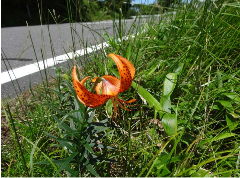
コオニユリ(小鬼百合)