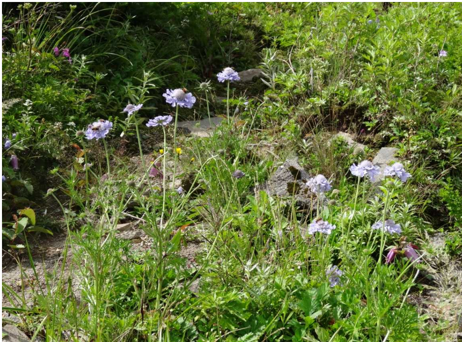
マツムシソウ(松虫草)