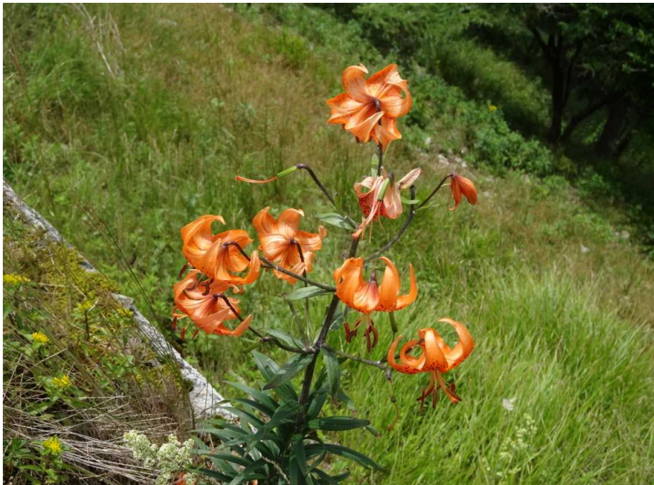
コオニユリ(小鬼百合)