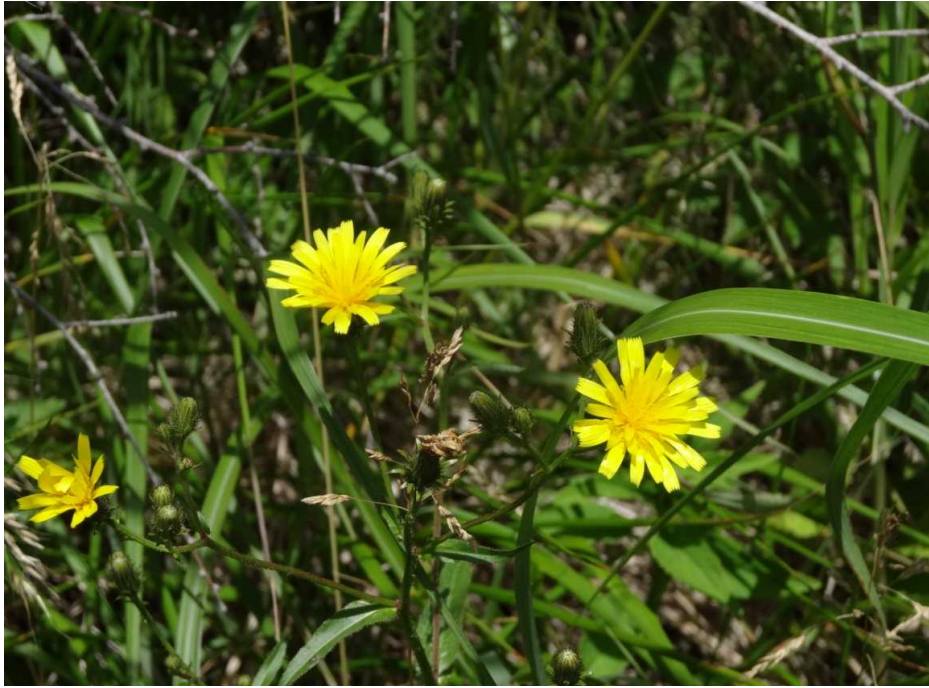
カンチコウゾウリナ(寒地毛蓮菜)