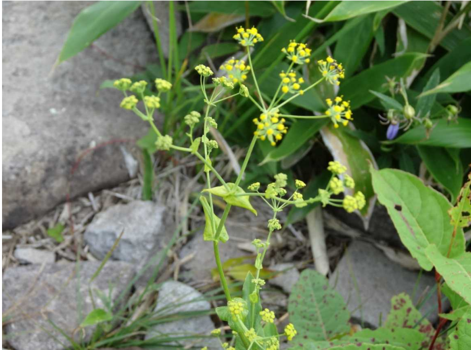
ホタルサイコ(蛍柴胡)