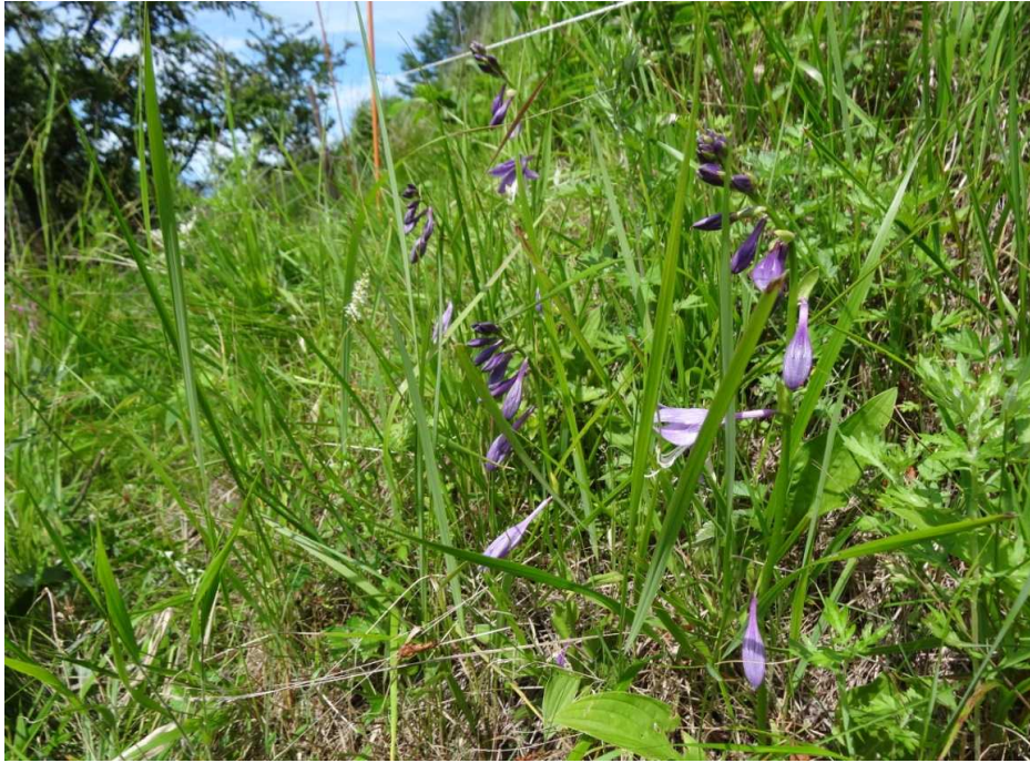
オオバギボウシ(大葉擬宝珠)