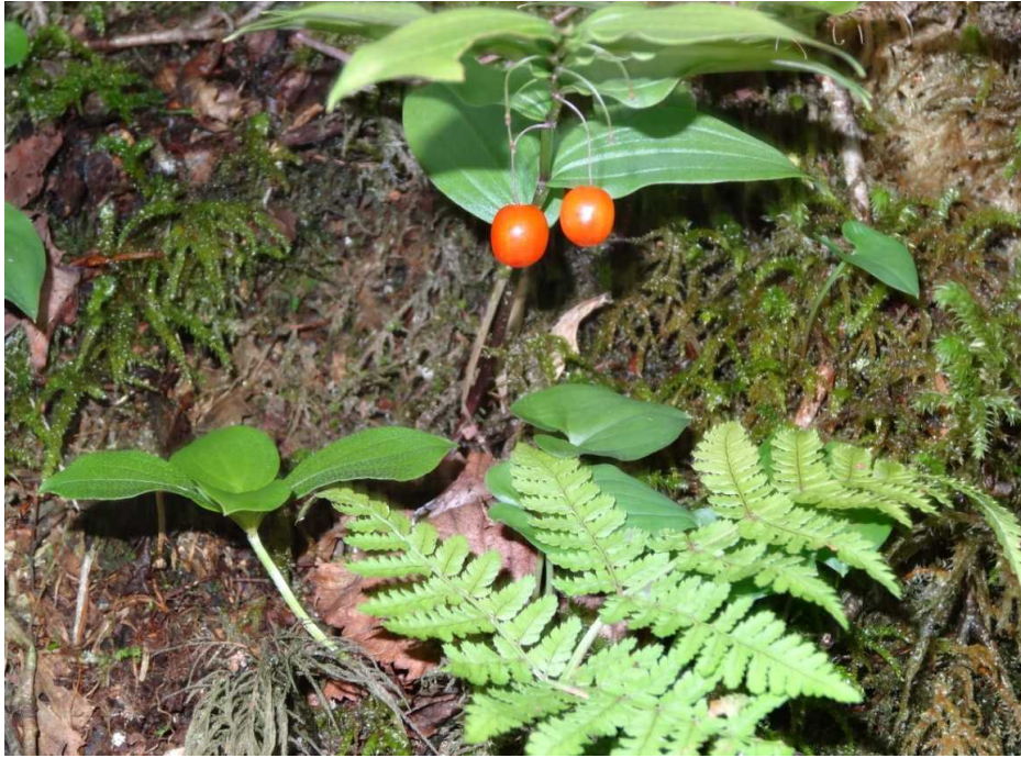
タケシマランの球状液果