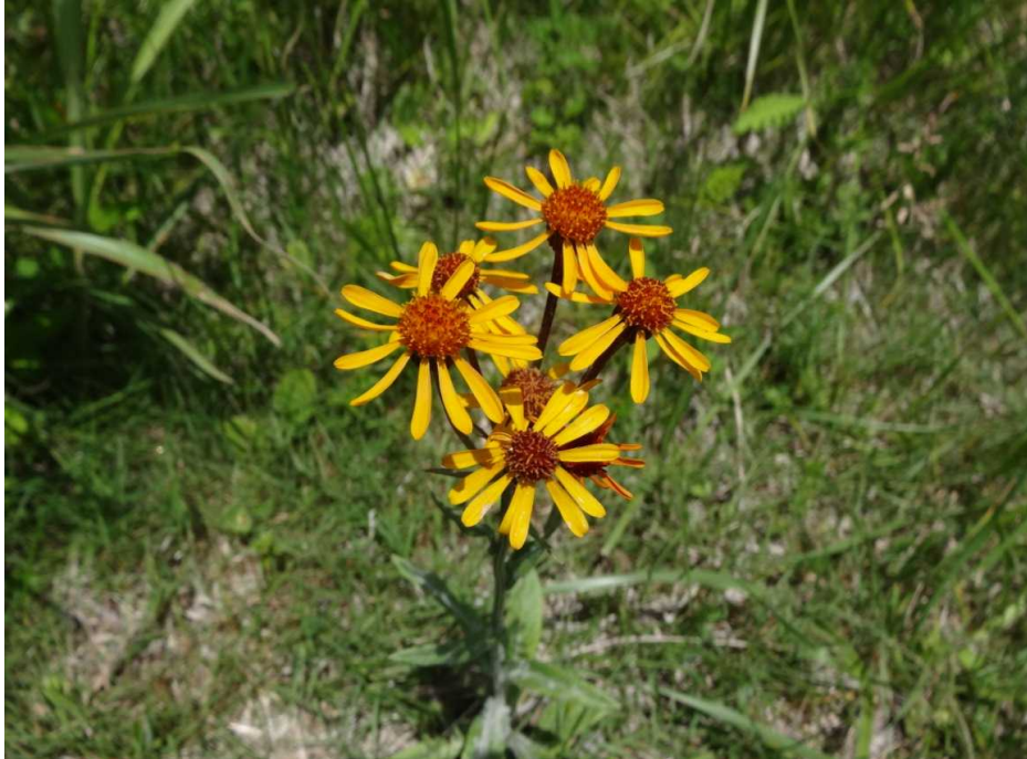
コウリンカ(紅輪花)