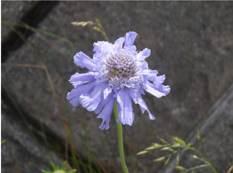
マツムシソウ(松虫草)