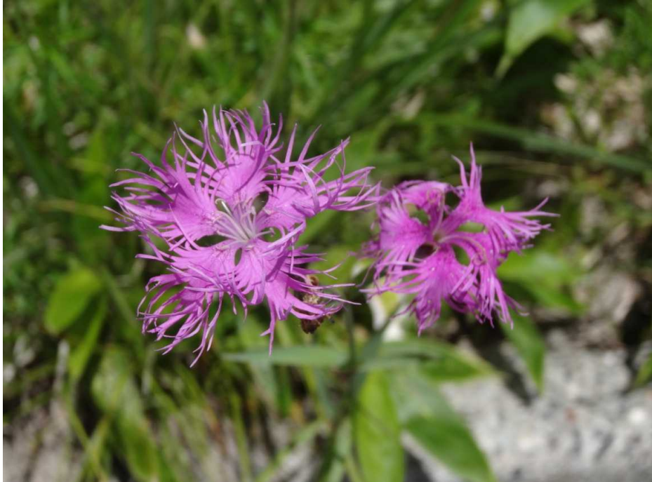
エゾカワラナデシコ(蝦夷河原撫子)