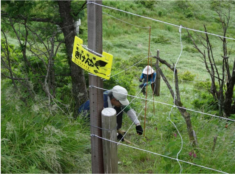
7月25日 電気柵の草刈り