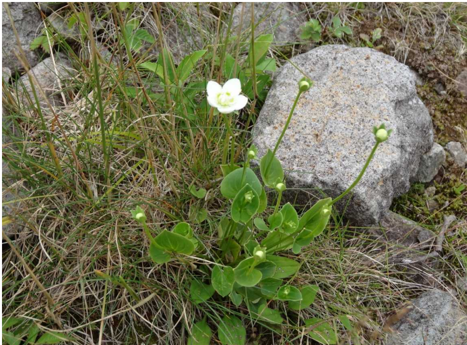
ウメバチソウ(梅鉢草)