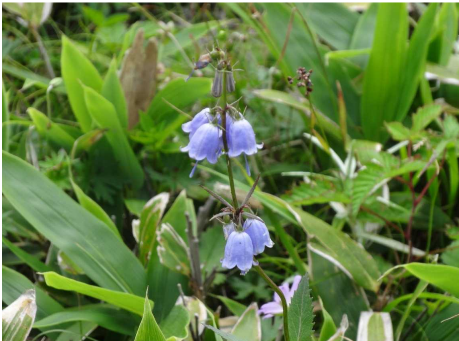
ツリガネニンジン(釣鐘人参)