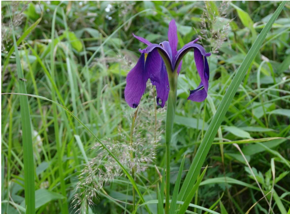
ノハナショウブ(野花菖蒲)