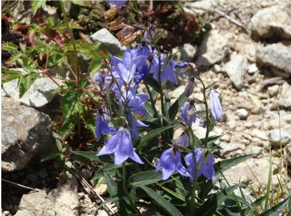
ヒメシャジン(姫沙参)