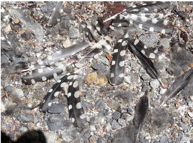
ヤマセミが補食されていました