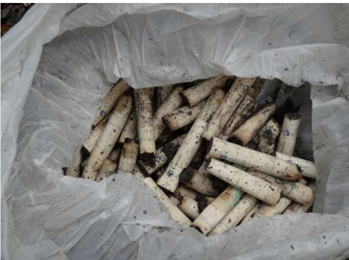
タバコの吸い殻の大量投棄 マナーを疑いたくなります