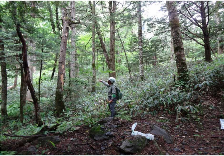
7月5日(日) 危険木の確認