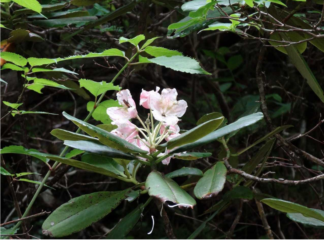
今年最後のシャクナゲ