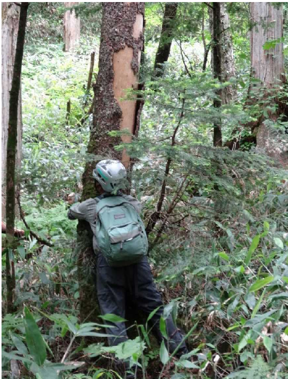
危険木の表示 (テープ巻き)