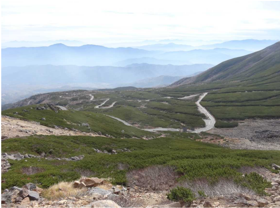
10月10日 エコーライン