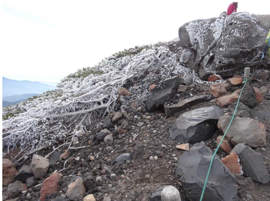
凍てつくハイマツ