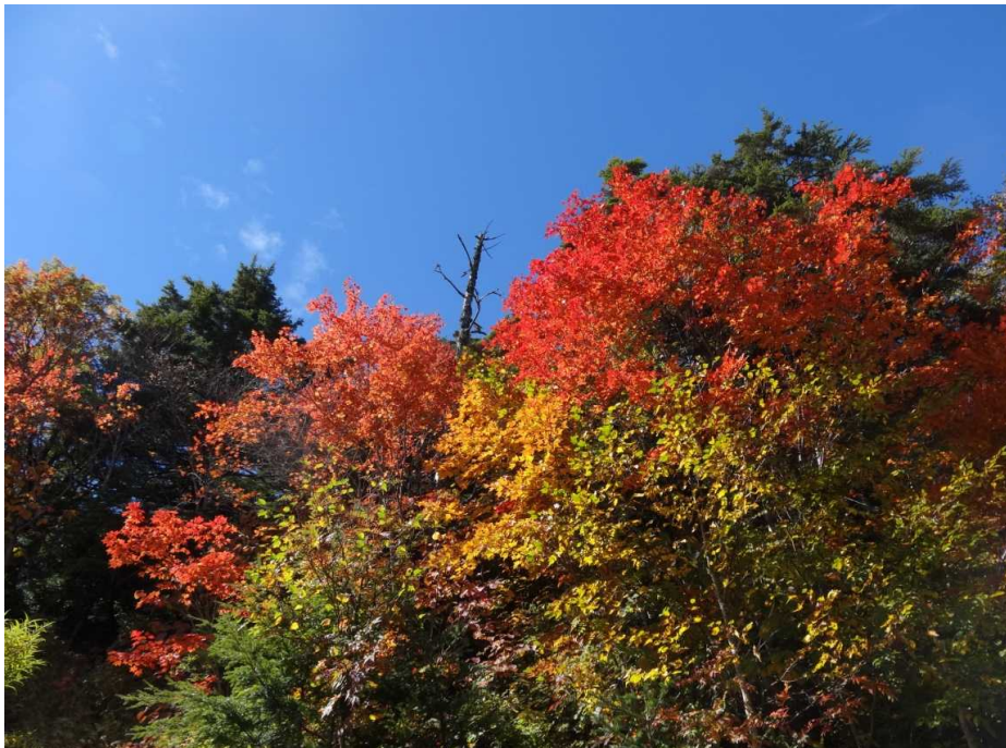
エコーライン周辺の紅葉