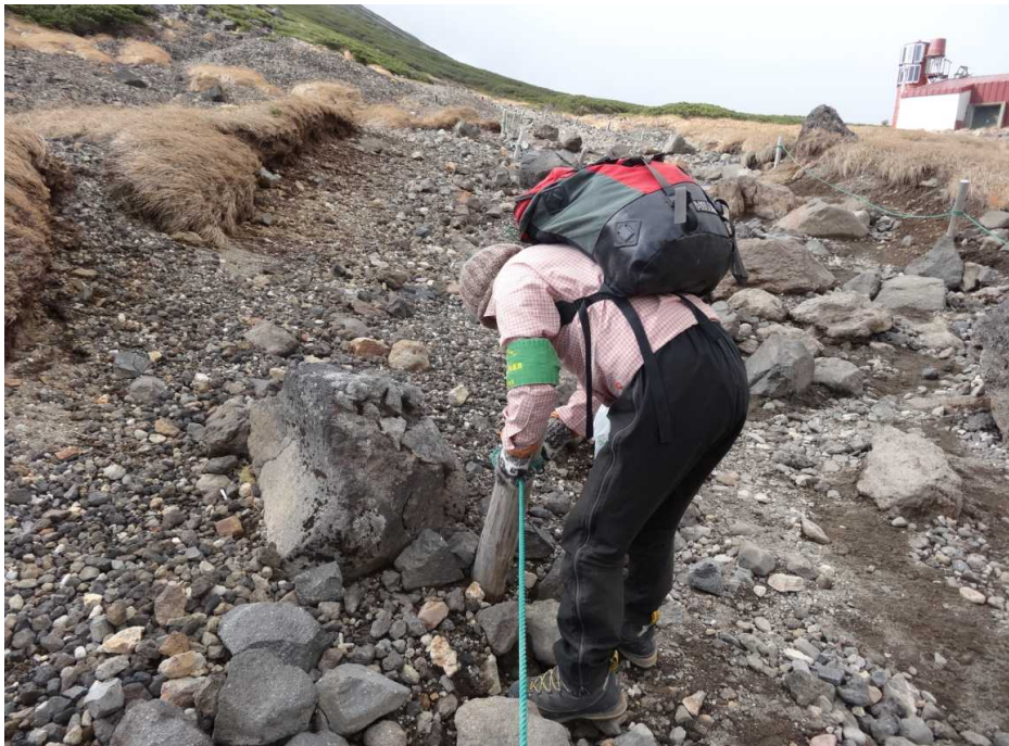
ロープを緩め下げる(冬対策)