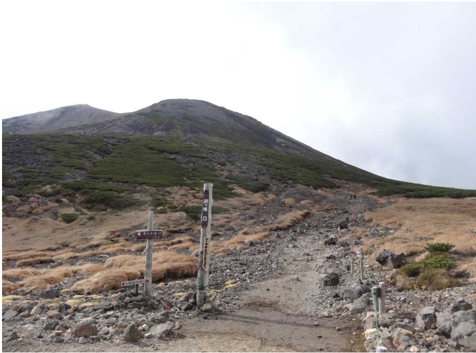
10月5日 剣ヶ峰登山口