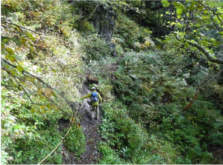
三本滝からの登山道