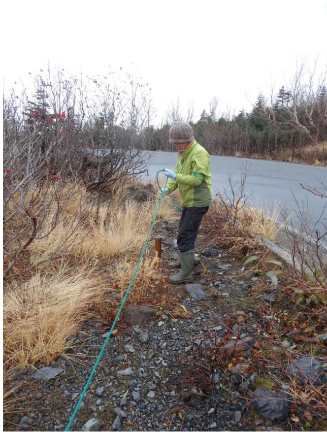
10月11日 県道のロープ外し