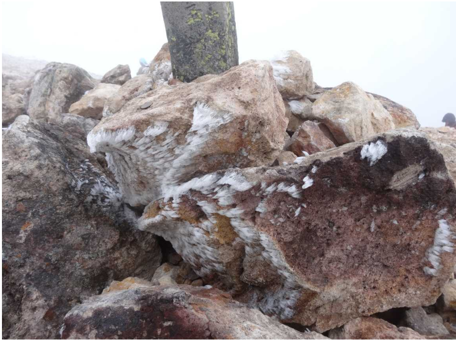
10月4日 蚕玉岳のエビの尾