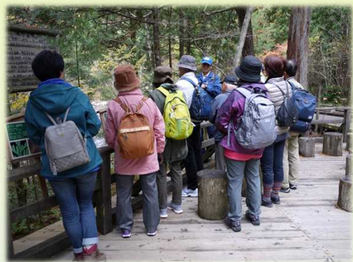
木曾五木の話などを行いながらご案内します