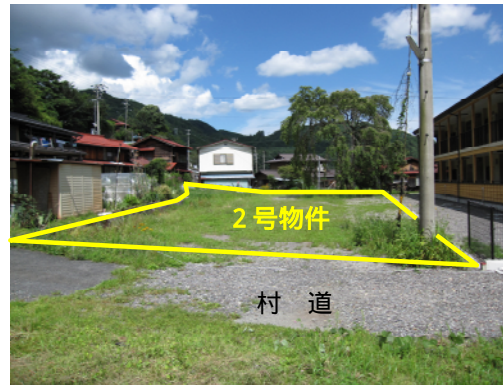
物件西側から撮影(2471番8/土地723.28㎡)