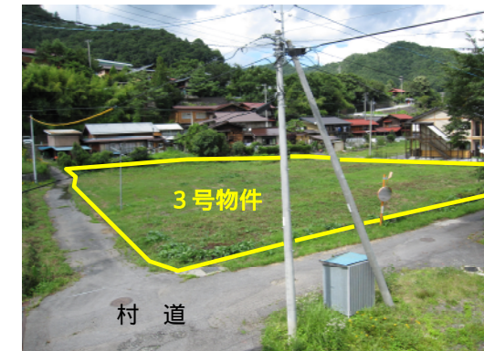
物件南西側から撮影(2471番9/土地1,819.41㎡)