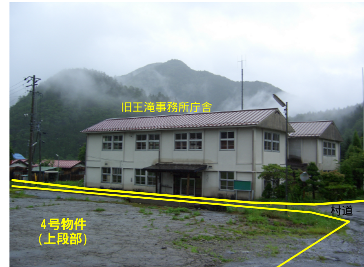
物件北西側から撮影(2508番3・2471番10方向) (2508番3・2471番10・2508番3・2533番/土地6,281.57㎡)

上記写真 から は一般競争入札物件となっており、ホームページの「一般競争入札物件」にて掲載しています。 詳しくは、「中部森林管理局ホームページ」「国有地の販売情報」「一般競争入札物件」をご覧ください。