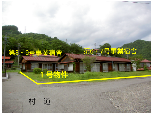
物件南西側から撮影(2460番1/土地858.95㎡)