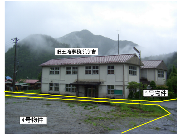
物件北側から撮影