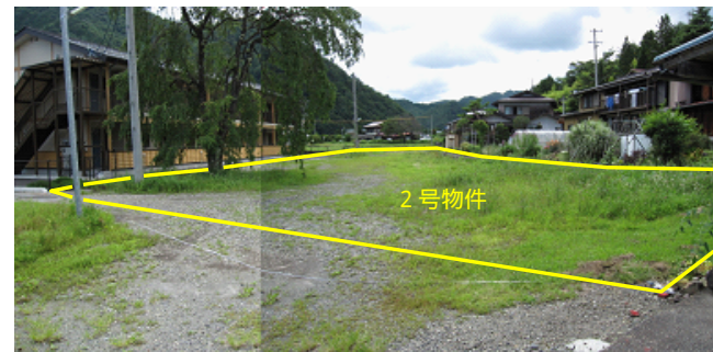
物件北東側から撮影