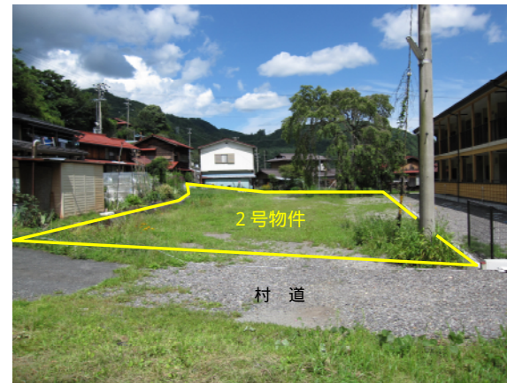
物件西側から撮影