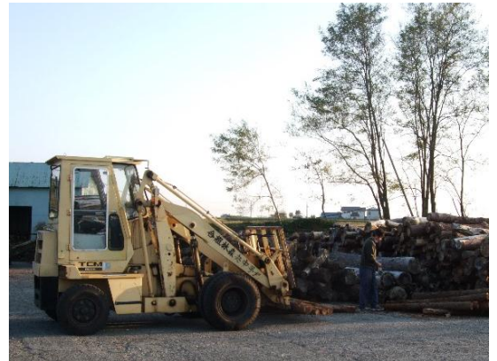
間伐材運び隊（岩手県紫波町）

松枯れ木の除去など高度な技術を要する作業は、岩手中央森林組合や民間事業者の一部委託することにより、森林所有者の作業負担を軽減。また、町と農林公社を中心に、地域住民の合意形成を図るとともに、交付金に係る事務手続きの支援を行っている。