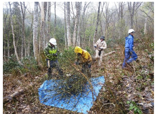
樵舎（たきぎのかい）（富山県南砺市）

調査活動については「森林空間利用タイプ」で申請を行っている。クロモジの資源量や収穫後の回復状況等について調査することにより、安定した収穫量の確保と持続可能な利用を目指す。将来は、キハダ、ホウノキなど、薬効のある植物の採取についても検討中である。