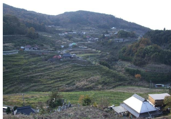
上山集楽林業部（岡山県美作市）

過疎高齢化が進む中山間地域では、里山林整備の担う人材が不足しているが、同市では地域おこし協力隊員が、その担い手となっている。森林所有者の合意形成も隊員が率先して行い、本年度は6ヘクタールの活動計画を申請。次年度はさらに範囲を広げる予定である。若者たちに刺激され、地区住民も整備活動に参加するという好循環が生まれている。