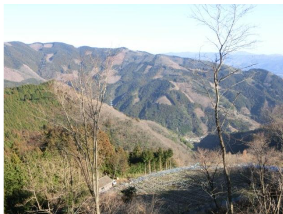
内子町森林組合（愛媛県内子町）

組合では、経営計画策定の際の現場確認作業とあわせて、整備対象地をみつけている。地域単位で面積をまとめ、作業を請け負うことができれば、組合の新規事業に発展できると考えている。伐採したクヌギは、ほだ木として出荷する他、県外のチップ業者に原木のまま出荷している。